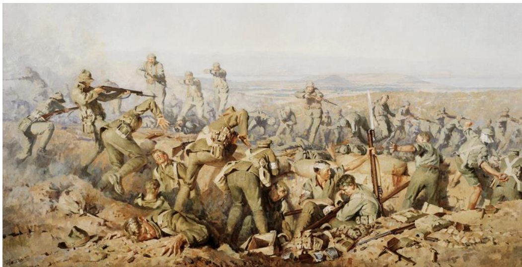
Новозеландцы отбивают атаку турок на Чунук Баир - высоту, господствующую на полуострове (Ion G. Brown, 1990)

10 – Войска союзников выбиты турками с холма Чунук Баир