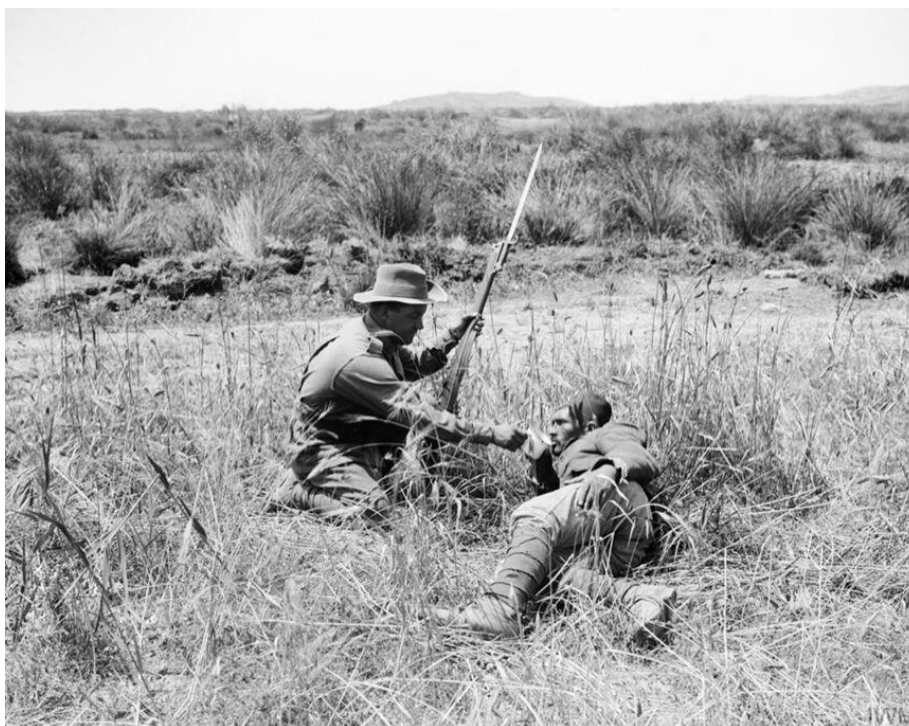
Австралиец дает воду раненому турецкому солдату...

К осени 1915 года стало ясно, что турки, обладающие численным превосходством и сражающиеся за свою землю с исключительным упорством, отступать не намерены. О прорыве турецкой обороны не могло идти и речи. Позиционная борьба истощила силы союзников - подкреплений для несущих тяжелые потери десантных частей не было.