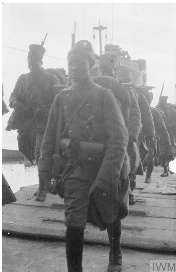
Сенегальские стрелки высаживаются на берег – май 1915