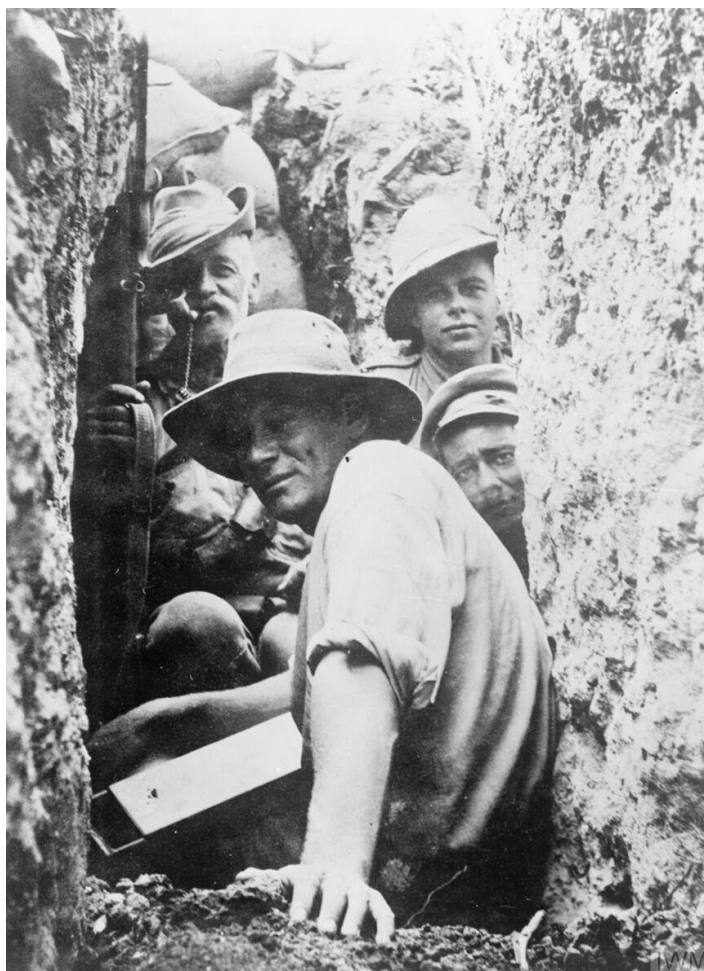
Австралийцы в траншее...