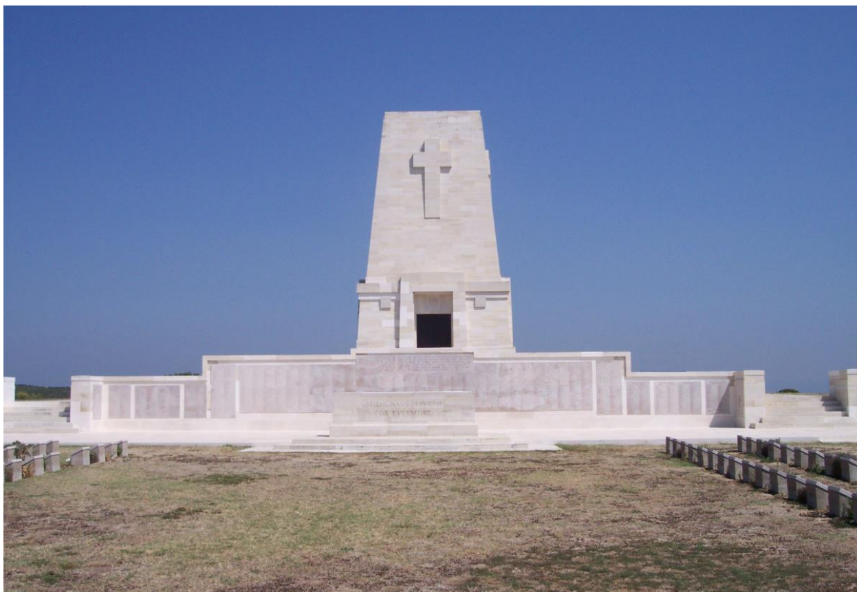
Памятник погибшим АНЗАКам.

национальный праздник ANZAC Day – своего рода день рождения нации и день памяти соотечественников, погибших во всех войнах.