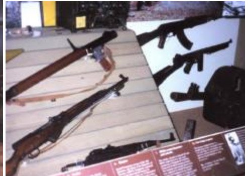
Оружие советского и китайского производства, захваченное австралийцами во Вьетнаме