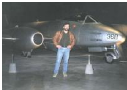
Автор рядом с Метеором, одним из тех, который воевал против МИГов в Корее