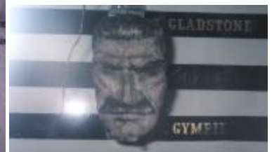
Эту голову Сталина выточил во время ВМВ на Тихом океане австралийский моряк с корабля Gympie . Скульптурный портрет был помещен на стенку столовой, входя в которую моряки корабля говорили: «Good morning (day), Uncle Joe!»