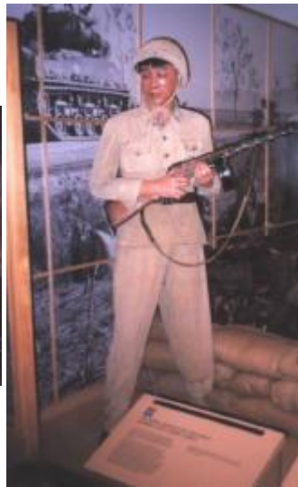
Солдат Народно-Освободительной Армии Китая с автоматом ППШ