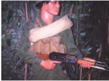
Солдат Вьетконга с автоматом Калашникова