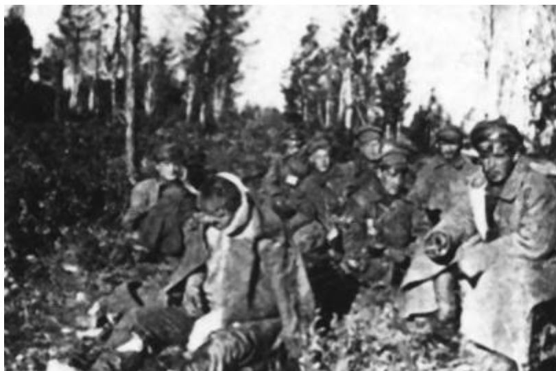
Красноармейцы, попавшие в плен в бою под Емцой

В течение следующих четырех недель союзники передали белогвардейцам все захваченные у большевиков позиции и ушли вверх по реке в Архангельск. Здесь они не забыли уничтожить скопившееся в порту огромное количество военного снаряжения, как будто понимая, что вскоре город будет захвачен большевиками. За четыре дня, к 27 сентября, все британские войска были эвакуированы из Архангельска.