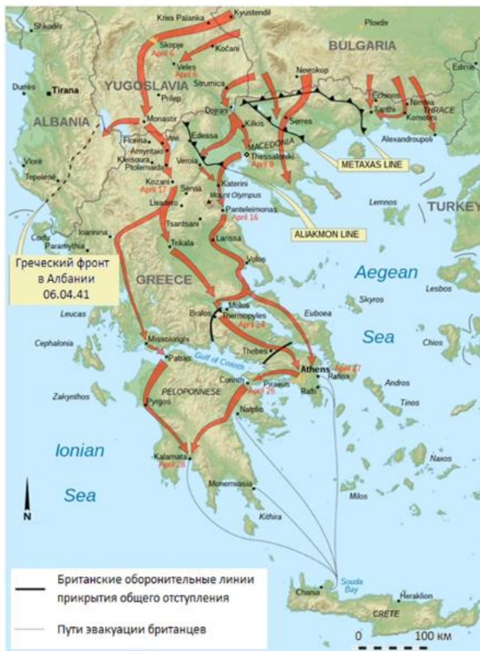
Схематическая карта германского вторжения в Югославию и Грецию

Белес в районе города Дойран/Dojran до устья реки Нестос/Nestos с изолированными укреплениями дальше к востоку, в Тракии. Вторая линия проходила за первой от хребта Белес, вытягиваясь вдоль реки Стримон/Strimon. Однако обе эти линии не имели существенной глубины и, даже если бы их удалось удержать, болгарские аэродромы располагались всего в 50-100 милях от Салоник – порта, который не имел средств ПВО и даже системы оповещения об воздушных налетах и который мог быть в короткий срок превращен авиацией в руины.