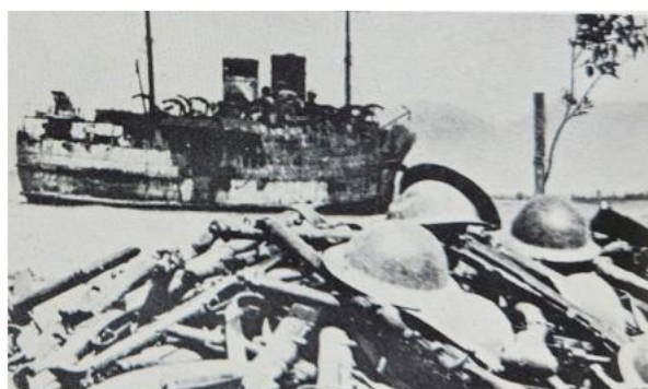
Сцены поражения: слева сверху – те, кого так и не подобрала корабли; справа сверху – брошенная британская техника; слева внизу – на пути из Греции; справа снизу – брошенные эвакуированными солдатами каски и оружие

В ожесточенном бою каждая из сторон потеряла по 300 человек убитыми и ранеными, и, как ни удивительно, на какое-то время британцы взяли вверх. У людей вновь появилась надежда на успешную эвакуацию. Соединение британских кораблей из двух крейсеров и шести эсминцев было на пути к Каламате, когда в городе шел бой. Моряки прочли сообщение, переданное сигнальным фонарем: «В гавани боши ( Boche - одно из прозвищ