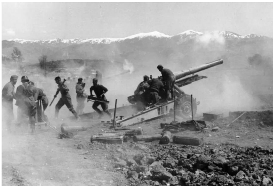
Немецкие артиллеристы ведут огонь по позициям союзников на Фермопильской Линии

22 апреля австралийские артиллеристы, занимавшие позиции на перевале Браллос/Brallios в районе Фермопил открыли огонь с расстояния около 6 миль по продвигающимся к рубежу их обороны немцам и поразили вражеский грузовик. Артиллерия среднего калибра открыла ответный огонь, потом подтянулись тяжелые орудия, и уже вскоре началась полномасштабная перестрелка. Атака немецкой пехоты была отбита, но при этом был подожжен и взлетел на воздух склад боеприпасов австралийцев, и несколько человек погибло.