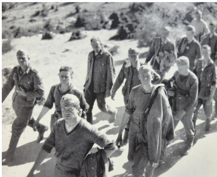
Немцы, взятые в плен в боях в районе перевала Сервия

Именно в эти дни австралийцы и новозеландцы сражались бок о бок на перевале Сервия , и здесь Корпус ANZAC пережил второе рождение через 26 лет после Галлиполи . Их упорное сопротивление вынудило немцев оставить идею прорыва через перевал – вместо этого они бросили танки и пехоту в обход на ощутимом расстоянии к западу от него, но в ночь с 17 на 18 апреля, когда основные экспедиционные силы уже были далеко на юге, обороняющиеся организованно отступили в условиях вовремя опустившегося тумана. Утром 18 апреля немецкие патрули обнаружили, что перевал больше никто не обороняет.