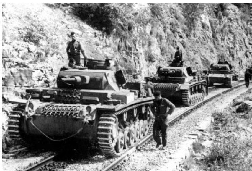
Немецкие танки продвигаются вперед вдоль железной дороги

Форт Эхинос в Тракии капитулировал 8 апреля, но другие форты Линии Метаксаса продолжали сражаться. Угроза Салоникам в тот день быстро становилась все более очевидной на фоне стремительного продвижения немецкой 2-й Танковой Дивизии (13-й Корпус) в районе Дойрана. Атака панцеров прорвала слабую оборону греческой 19-й Дивизии, и это оказалось важнейшим моментом всей кампании. Экипажи легких танков британского 4-го Полка Гусар (1-я Бронетанковая Бригада), действовавшие к западу от реки Аксиос, взорвали дорожное полотно и железнодорожные мосты через реку и, по приказу Уилсона, отступили через горные проходы Эдхесса и Верия к Козани. Здесь они присоединились к силам, создающим заслон в районе горного прохода Веви .