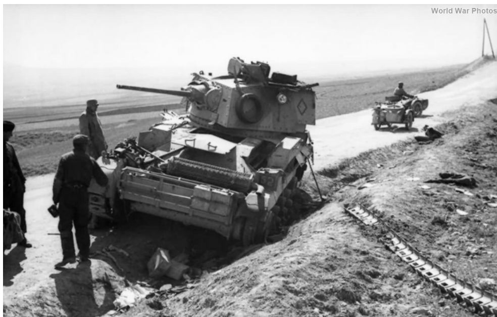
Немцы осматривают брошенный британский танк...

на твердый грунт. Тем не менее, эскадрон оставил позади несколько потерявших ход машин, и, когда после морозной ночи пришло сообщение о том, что сведения о продвижении вражеских танков были ложной тревогой, и мы вернулись назад, нам пришлось подсчитывать ущерб от этого бесполезного похода. Пять танков были брошены с безнадежно порванными гусеницами, у двух полетели поршни. Запасных частей у нас не было, поэтому танки пришлось взорвать.»