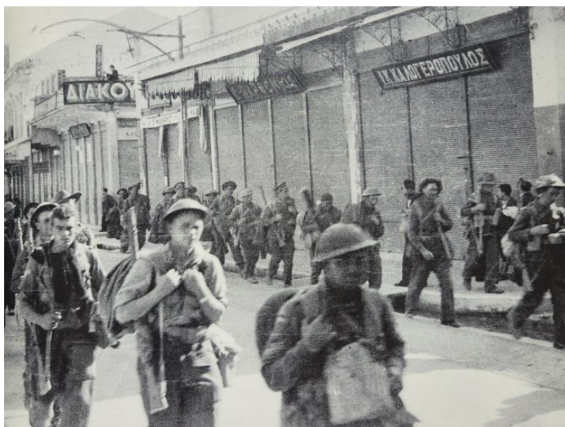
Одна из сцен эвакуации. Солдаты идут через Каламату к пляжам...

К югу от канала численное превосходство немцев сказалось уже вскоре, и немногие обороняющиеся были ими смяты, хотя они успели убить или ранить 285 солдат и офицеров 2-го парашютного Полка противника. Так или иначе, это был заметный успех немцев, и они 26 апреля с триумфом вступили в Коринф в сопровождении захваченного у британцев танка. Говоривший по-гречески немецкий офицер освободил мэра города от его обязанностей. По всей Греции наблюдалась похожая картина: танки и бронетранспортеры, забитые перепачканными пылью солдатами, с грохотом вкатывались в города, на первый взгляд, покинутые жителями. Через 2-3 часа солдаты уже были чистыми и подтянутыми и начали с помощью листовок, в которых объяснялось, как переводить рейхсмарки в драхмы, покупать в местных лавках еду и сувениры. Греки стали постепенно выходить из своих домов и разглядывать завоевателей. Через несколько дней все уже знали все про рейхсмарки, и бизнес активизировался. Все выглядело не так уж и плохо.