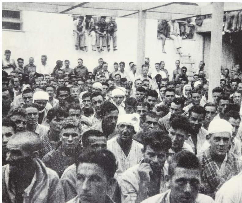
Раненые австралийцы и новозеландцы в госпитале для военнопленных близ Пирея

Королевские ВВС потеряли в Греции 72 самолета сбитыми в бою и 137 уничтоженными на земле. Флот потерял два эсминца, четыре транспорта и 21 судно. Сухопутные силы потеряли 104 танка, 400 орудий, 1 800 пулеметов и 8 000 автомашин.