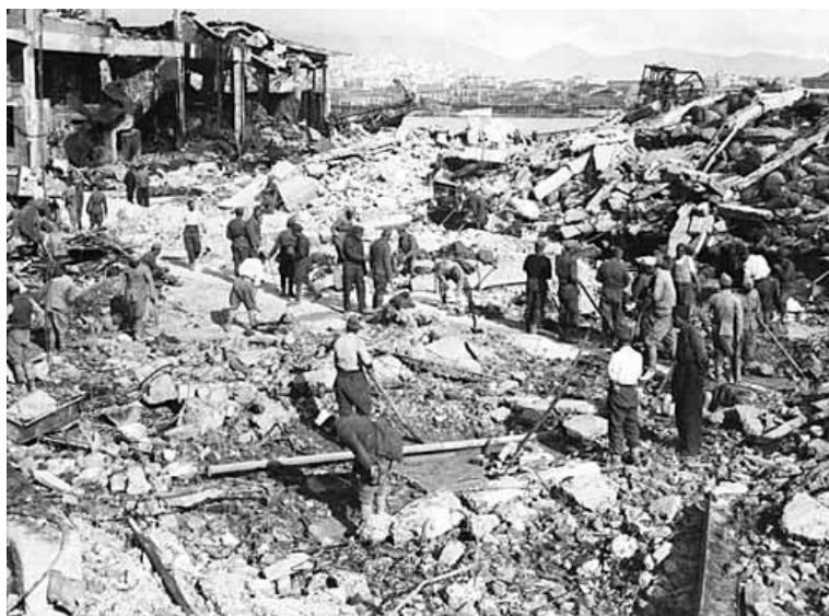
Порт Пирей после бомбардировки 6 апреля

Незадолго до 21.00 до порта донесся гул моторов немецких самолетов. Первая их волна сбросила в гавань магнитные мины на парашютах, чтобы воспрепятствовать буксировке судов из порта. Затем подошли бомбардировщики, выбравшие Clan Fraser в качестве цели. Несколько бомб попали в транспорт, и ночную темноту озарили красно-оранжевые языки огня... Потом судно взлетело на воздух, разбивая стекла и распахивая двери в афинских домах в семи милях от порта. Суда и причалы гавани Пирея, постройки и здания на ее берегах горели до утра. Погибло множество британских моряков и военнослужащих. Были уничтожены 11 судов общим водоизмещением 41 489 тонн, порт превратился в руины. Даже после ремонта стало возможным использованием лишь пяти из двенадцати пристаней. Адмирал Каннингем назвал это событие сокрушительным ударом по снабжению войск. Тогда успех авианалета был воспринят как результат деятельности немецких агентов, которые следили за перемещениями судов и знали характер груза, находившегося на транспорте Clan Fraser . Сейчас более известна другая версия событий – здесь проявил свое боевое мастерство ас бомбардировочной авиации Люфтваффе Ханс-Йоахим Херманн (Hans-Joachim Hermann), командир 7-й Эскадрильи 4-й Бомбардировочной Эскадры (KG 4).