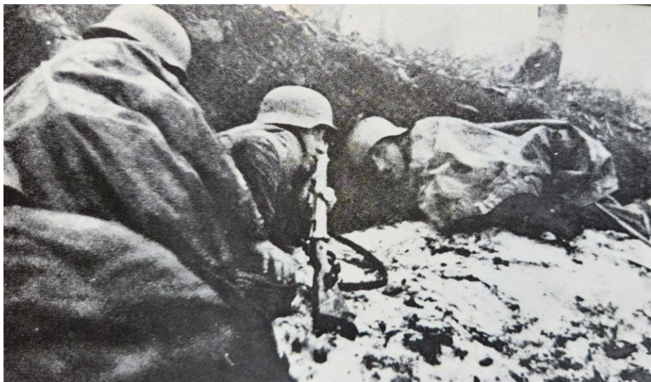
Немецкие солдаты на Линии Метаксаса. 6 апреля 1941 года

6 апреля 30-й Корпус немцев, в который входили 50-я и 164-я пехотные дивизии, вышел из долины реки Арда на территории Болгарии на равнину Комотины/Komotini в Западной Тракии. Здесь малочисленная и плохо вооруженная греческая Бригада Эврос не смогла оказать немцам эффективного сопротивления, но два форта в пунктах Нимфея/Nymphaea и Эхинос/Ekhinos продержались целый день, находясь в окружении и под сильным артогнем.