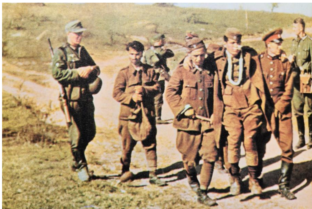
Пленные греки в сопровождении немецких конвоиров

События развивались быстро. Обход немецким 18-м Корпусом с фланга Линии Метаксаса привел к капитуляции греческих войск в восточной Македонии, и в 8 часов утра 9 апреля основная колонна панцеров вступила в Салоники. Протокол о капитуляции был согласован немецким командующим 2-й Танковой Дивизии и генералом Бакопулосом (Κωνσταντίνος Θ. Μπακόπουλος, 1889-1950, на фото слева), командующим греческими войсками в этом районе.