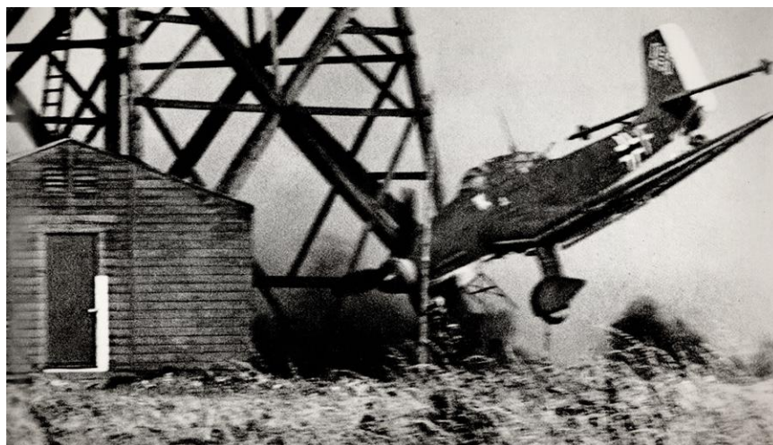
Сбитый пикирующий бомбардировщик Ju-87 через мгновение врежется в основание радиолокационной вышки...