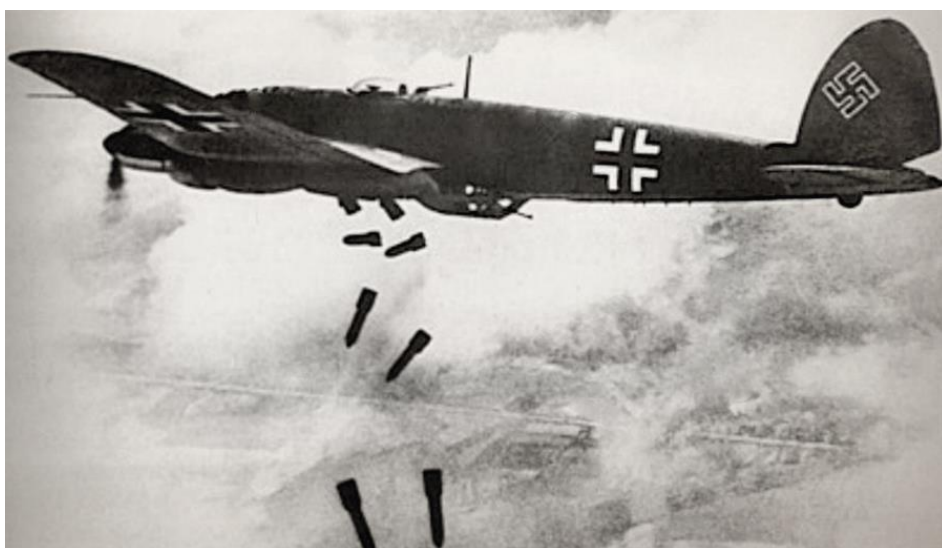
Хейнкель-111 сбрасывает свой смертоносный груз

1. Целью Гитлера, бросившего на Великобританию невиданные до тех пор массы бомбардировщиков и истребителей, было завоевание господства в воздухе перед планируемым летом 1940 г. вторжением на Британские острова – операцией Seelöwe . На позднем этапе сражения стало очевидным намерение нацистов подавить моральный дух британцев и склонить правительство страны к миру на условиях Германии.