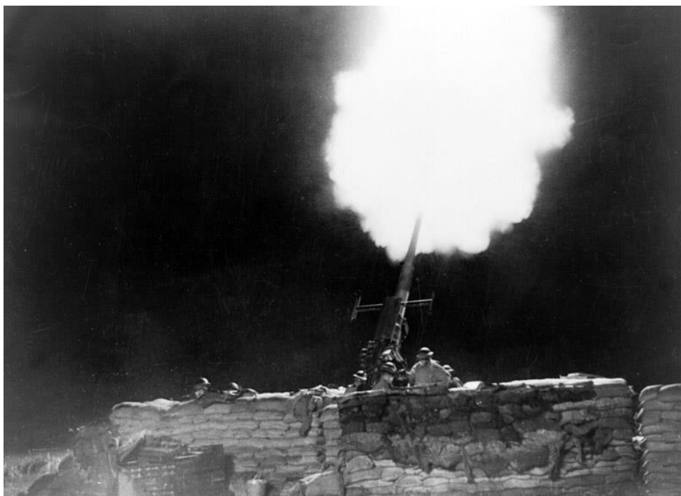
Британские зенитчики ведут огонь по противнику

7 сентября и далее – налеты на британские города