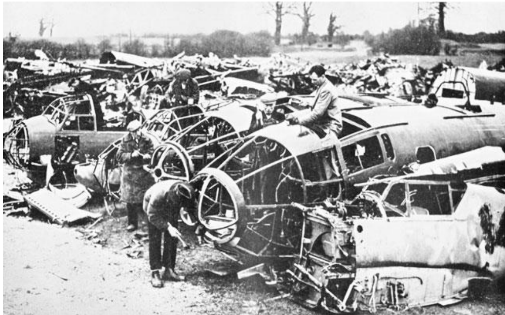
Кладбище сбитых немецких самолетов. Британские рабочие разбирают обломки на металлолом

9. 15 сентября два массированных налета Люфтваффе были успешно отражены истребителями RAF. В этот день немцы потеряли 60 машин, тогда как RAF – 26. Немцы просто не могли позволить себе такие потери, и два дня спустя Гитлер отдал приказ остановить подготовку к вторжению на Британские острова. Люфтваффе полностью переключилось на ночные атаки, и наиболее опасная для британцев фаза сражения осталась в прошлом. Этот день остался в истории Днем Битвы за Британию ( Battle of Britain Day ). Ни о каком вторжении с моря уже не могло идти и речи: наступила осень и сезон сильных штормов.