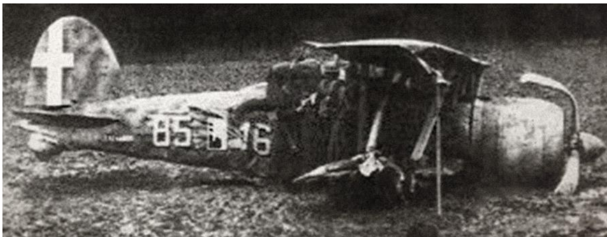
Сбитый 11.10.1940 над Великобританией итальянский Fiat CR.42

В налетах на Великобританию приняли ограниченное участие ВВС Италии