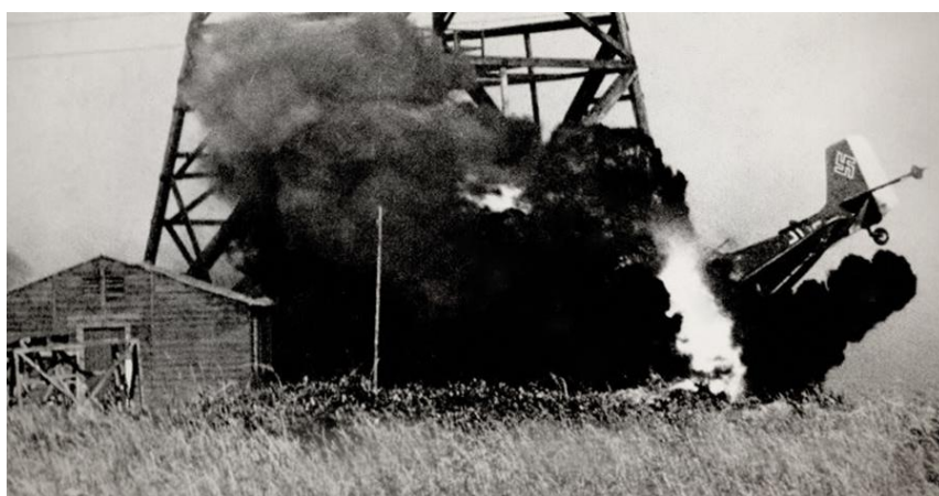
Ju-87 и его экипаж находят свою смерть на британской земле...