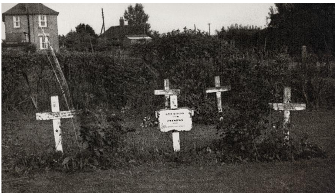
Одно из многих захоронений погибших немецких летчиков. Сердобольные британцы даже установили кресты над могилами своих врагов...

период сражения и убедившего президента в необходимости оказания традиционному союзнику всесторонней поддержки.