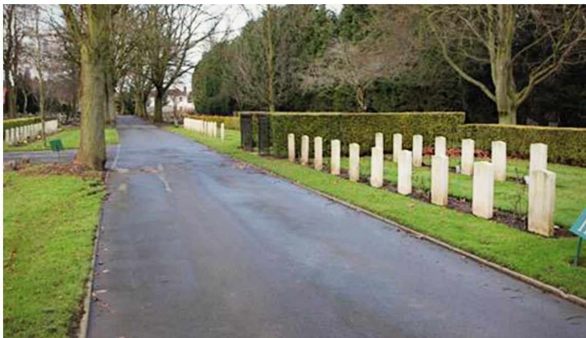
Одно из многих кладбищ, на которых похоронены защищавшие летом и осенью 1940 г. небо Великобритании летчики RAF