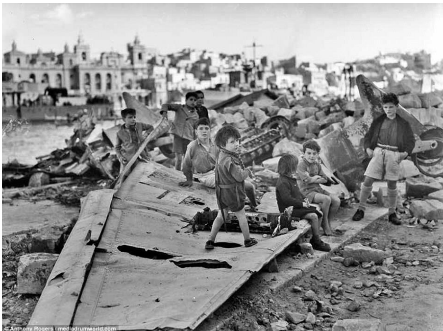
Мальтийские дети, играющие на обломках сбитой Шмуки

По очевидным причинам визит состоялся в обстановке строжайшей секретности, но в 5 часов утра мальтийцам объявили о предстоящем прибытии Его Величества. Времени оставалось предостаточно, и сады Бараккас вместе с другими местами с хорошим обзором были заполнены ликующими людьми, когда Aurora ... прошла между волноломами в 8 часов утра... Король стоял на специальной платформе, построенной перед командирским мостиком, чтобы все могли его видеть. Я видел много запоминающихся торжеств, но это произвело на меня самое большое впечатление. Толпы верных [Королю] ... мужчин, женщин и детей были полны энтузиазма. Я никогда не слышал столько радостных восклицаний, и все колокола во множестве церквей зазвонили, когда он сошел на берег... Король осуществил продолжительную поездку по острову, и мы были на ланче у губернатора, фельдмаршала висконта Горта (Gort) во дворце Вердала/Verdala. Это было первое посещение Мальты Сувереном с 1911 года, и его воздействие на жителей [острова] было колоссальным.