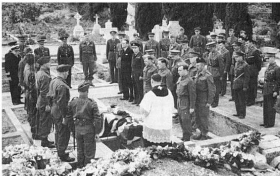
Похороны погибшего летчика