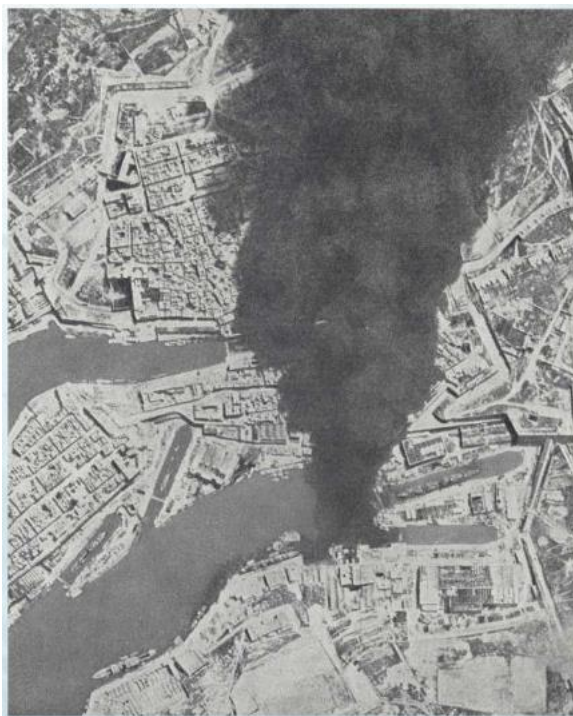
В гавани Валетты горит разбомбленный танкер. Снимок сделан с немецкого самолета-разведчика

http://cloudobservers.co.uk/wp-content/uploads/downloads/2015/02/The-Air-Battle-for-Malta.pdf