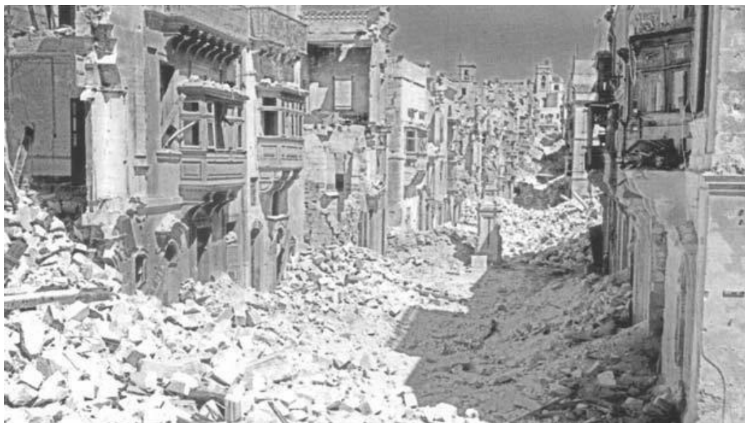
Развалины Валетты. Весна 1941 года