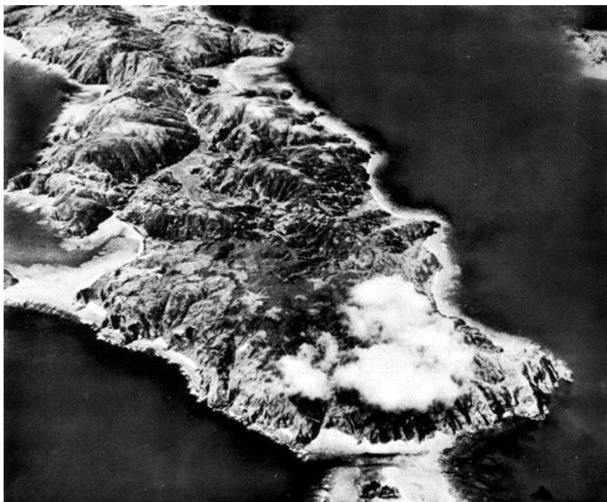
Вид на остров Токасики с воздуха

объявлен зоной безопасности. Позднее было заключено перемирие, когда командир японского гарнизона признал бесполезность дальнейшего сопротивления.