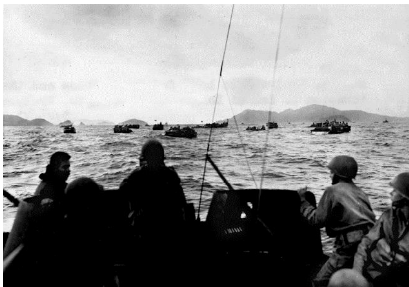
Амфибийные гусеничные транспортеры 1-го Батальона 305-го Полка 77-й Дивизии приближаются к участку высадки на острове Дзамами...