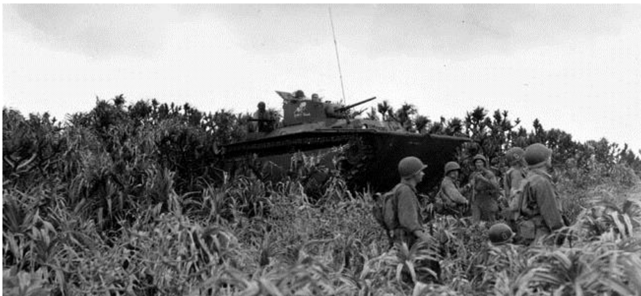
Американские пехотинцы на одном из островов архипелага Керама