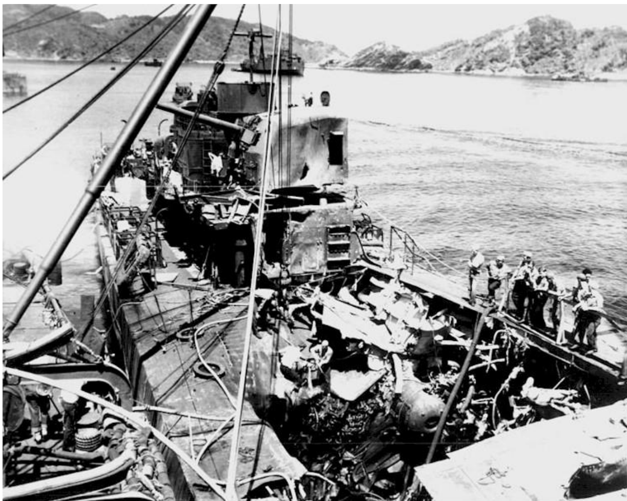
Эсминец Ньюком после ударов камикадзе у берегов архипелага Керама

Эсминец Newsom так и не был полностью возвращен в строй и был выведен из состава ВМФ в марте 1946 года.