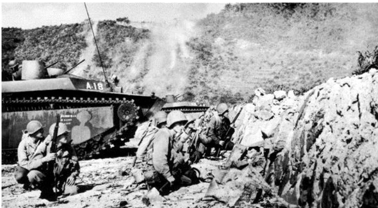
Первые минуты после высадки на остров Дзамами. Танки не в состоянии преодолеть волноприбойный уступ...