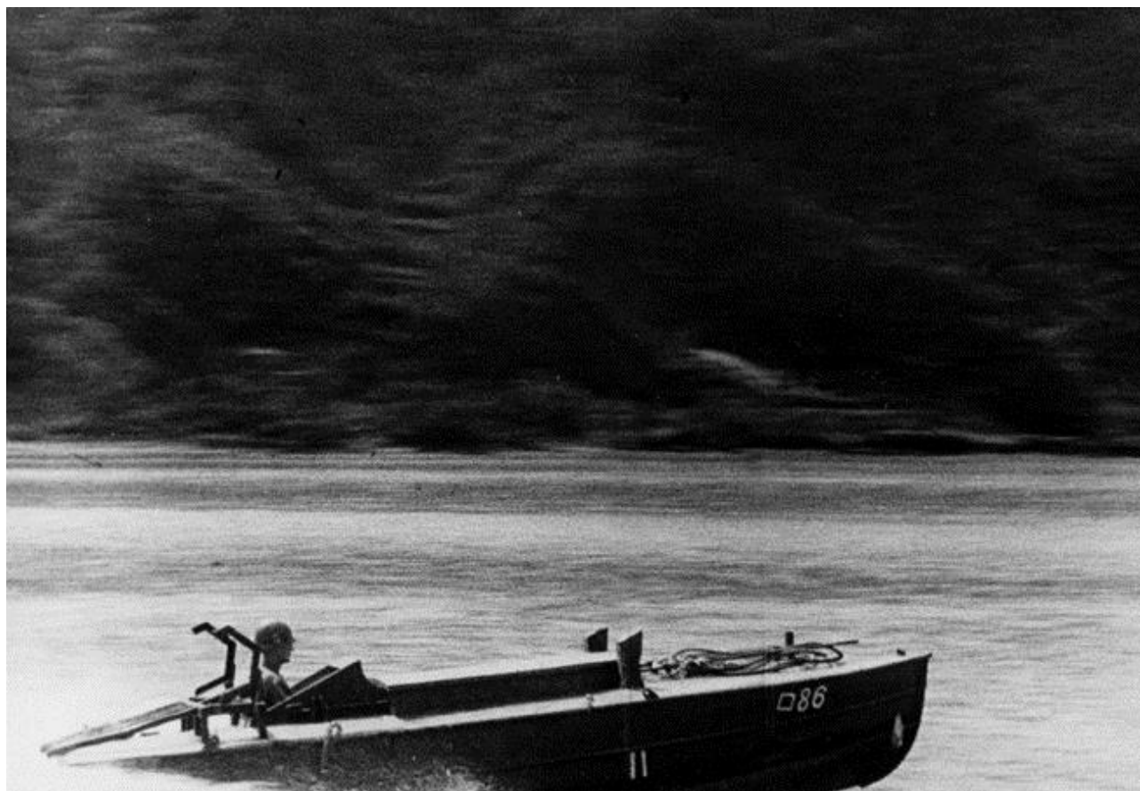
Американец на захваченном у японцев катере-самоубийце