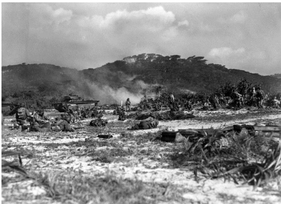
Солдаты 306-й Полковой Группы высаживаются на остров Герума в ходе операции Айсберг. 26 марта 1944 года.