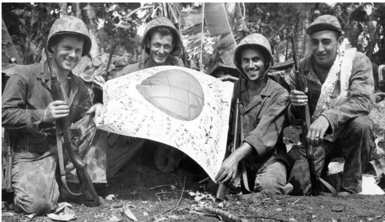
Американцы демонстрируют захваченный у противника флаг

его кабинет уйти в отставку. Император Хирохито и представители высшего командования были явно потрясены случившимся. Известно, что один из высокопоставленных японских офицеров, узнав о поражении, воскликнул: «На нас обрушился ад!» Это было правдой – по выражению одного из американских военных историков, «Сайпан стал началом конца Японской Империи.»