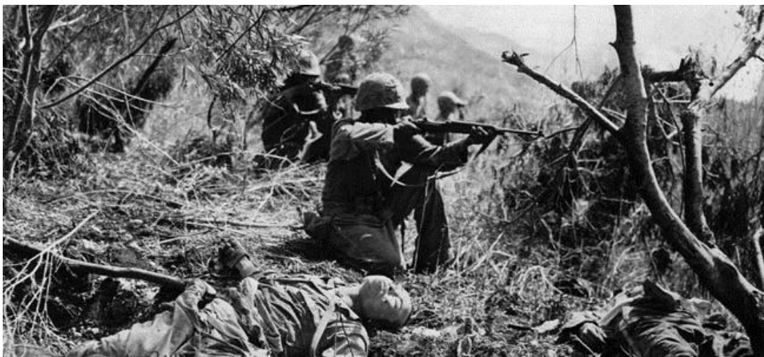
Последние бои в районе пункта Марпи...

Из-за узости острова в его северной части командование американцев уже не могло использовать все три дивизии, и 2-я Дивизия КМП была оставлена в тылу для отдыха и подготовки к вторжению на остров Тиниан.