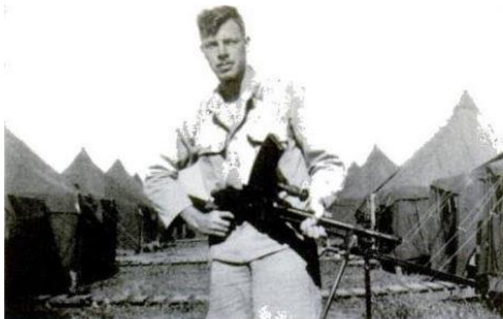
Ли Марвин в период службы в морской пехоте