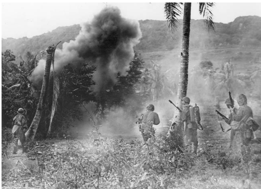
Американцы продвигаются вперед...