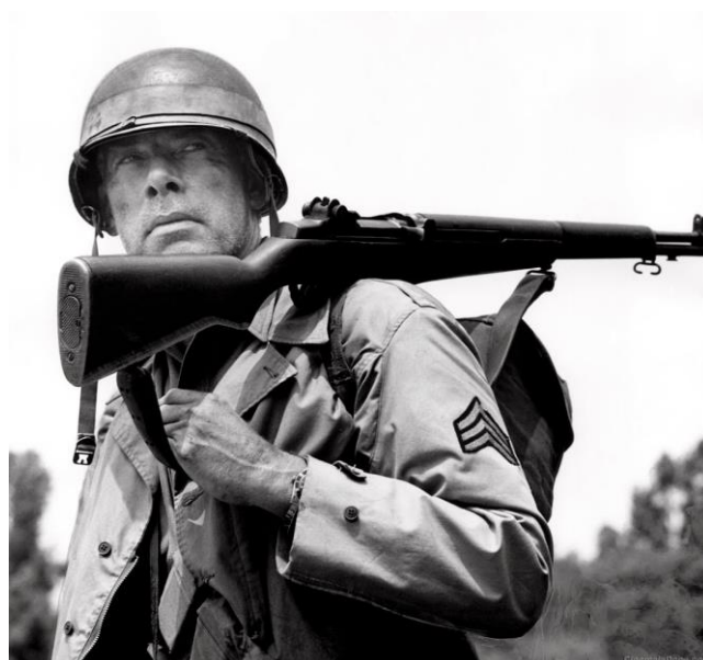
Ли Марвин в культовом фильме The Big Red One