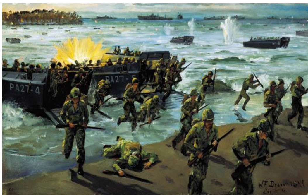
Американцы высаживаются под огнем противника...