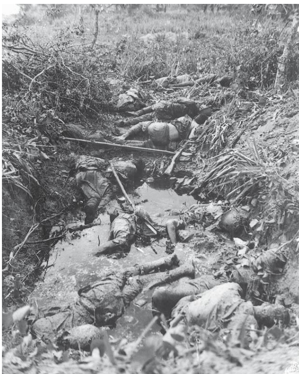
Судьба большинства японцев, оборонявших остров...