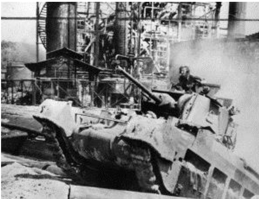
Танк из состава австралийской 7-й Дивизии продвигается по труднопроходимой местности на острове Борнео. На заднем плане – разрушенные сооружения нефтеперегонного завода...

В преддверии вторжения на Борнео, в начале 1945 года, агенты A/B и сил специального назначения ( Z Special Force ) проводили операции на острове, сообщая о наблюдаемых морских перевозках противника, развивая разведывательную сеть и намечая цели для воздушных атак. Их активность была интенсифицирована. Пять групп A/B/Z были высажены на побережье острова в разных пунктах и еще три группы сброшены на парашютах в районе города Саравак для сбора информации о дислоцированных на острове силах японцев и вооружения и обучения партизан. Некоторые из агентов A/B/Z были присланы из Великобритании, первоначально – для прохождения подготовки к ведению разведывательно-диверсионной работы в джунглях, некоторые группы получили подкрепления за счет австралийских коммандос, которые были сброшены на остров на парашютах.