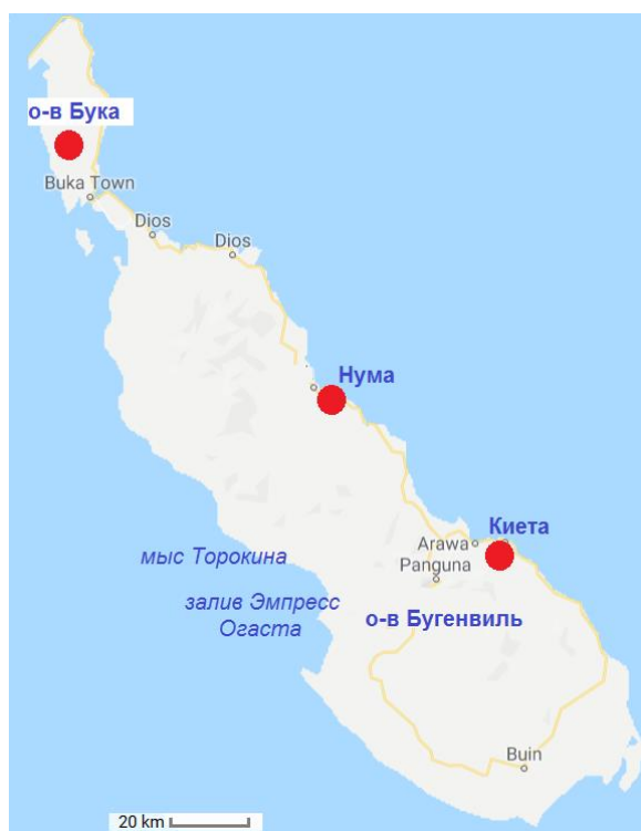
Карта о-ва Бугенвиль. Красными кружками показаны участки дислокации японцев

Остров Бугенвиль, вытянутый на 125 миль в длину и имеющий максимальную ширину в 40 миль, представляет из себя горную цепь вулканического происхождения, ограниченную прибрежной равниной, иногда достигающей в ширину 10 миль. Равнина покрыта джунглями, только небольшие участки земли обрабатываются людьми. Местный климат характеризуется исключительно сильными ливнями, с гор стекает множество полноводных рек. Численность японских гарнизонов было точно неизвестна союзникам, на самом деле, она была близка к 40 000 человек. Они были дислоцированы на трех участках: к северу от узкого пролива Бука/Buka, на востоке в районе пунктов Нума Нума/Numa Numa и Киета/Kieta и на юге в районе пунктов Буин/Buin и Мосигетта/Mosigetta.