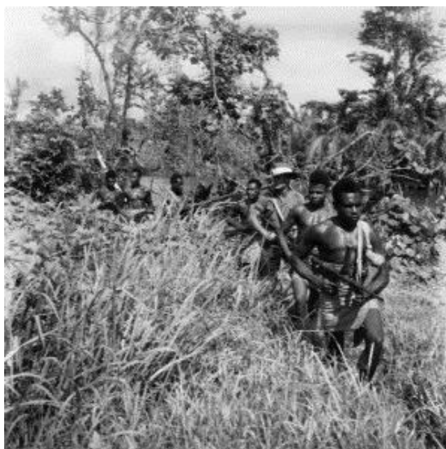
Солдаты 1-го Папуасского Пехотного Батальона (1st Papuan Infantry Battalion) с австралийским сержантом в патруле. Джунгли Новой Гвинеи, июль 1944 года