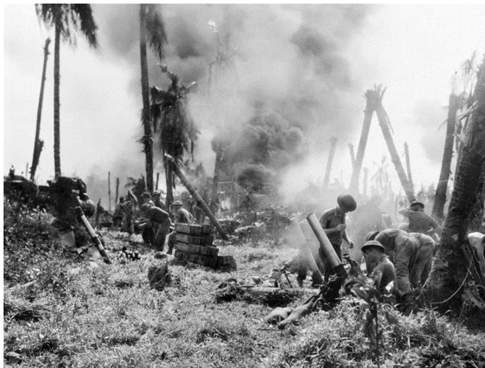
Австралийцы ведут минометный огонь по позициям японцев в районе Баликпапана

Местность вокруг Баликпапана была довольно открытой, но при продвижении вглубь острова она сменилась густыми джунглями со множеством укреплений на буграх, холмах и грядах. Как это случалось очень часто, японцы вырыли здесь многочисленные тоннели. На оборонительных позициях было много морских и полевых орудий. Оборонительные позиции были подвергнуты бомбежке и обстрелам, но это имело незначительный эффект. Как обычно, преодоление обороны японцев перешло в бои на уровне рот, взводов и действий отдельных солдат, которым приходилось отбивать контратаки и рейды противника.