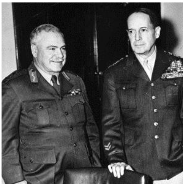
Генералы Томас Блэйми и Дуглас Макартур

В то время звучали и другие комментарии: «Это должно было стать чисто американским шоу,» и «Это в большей степени связано с престижем американцев и с немалым тщеславием Макартура.»