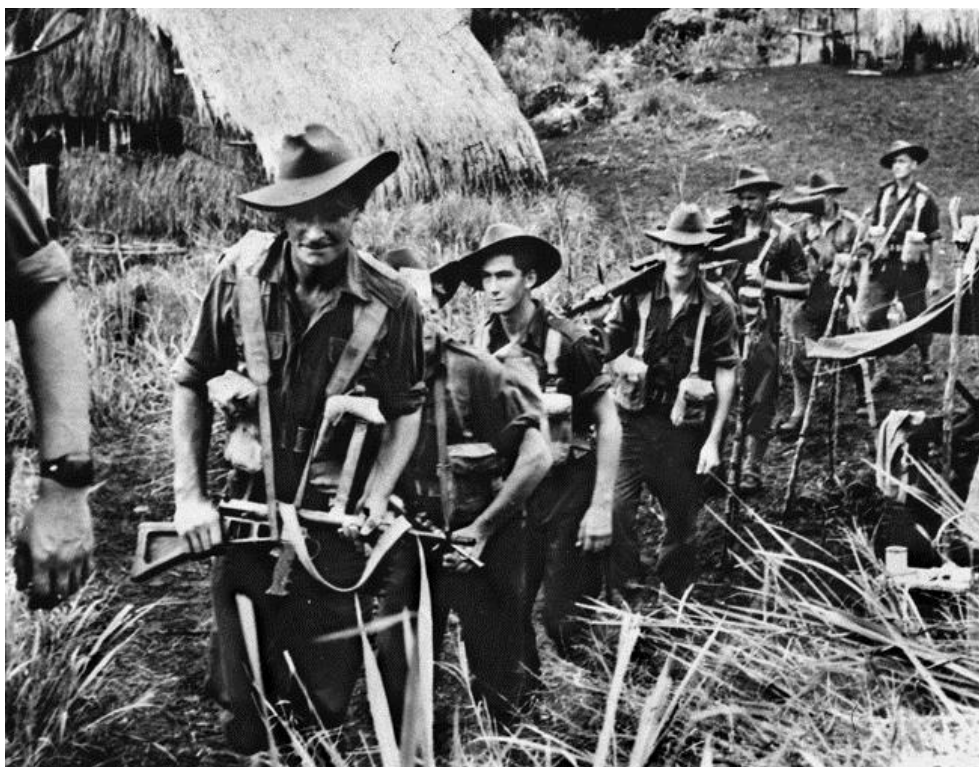
Австралийский патруль уходит в джунгли Новой Гвинее на поиски продолжающих оказывать сопротивление японцев...

Во время кампаний на Новой Гвинее и Бугенвиле в Австралии звучали возражения против отправки австралийских солдат на зачистку обойденных и оставленных в глубоком тылу территорий, в то время как американские союзники пробиваются к Японским островам, восхваляемые общественностью и покрытые славой. По мере того, как потери австралийцев росли, эта критика становилась все более резкой, и стали звучать обвинения в том, что солдаты умирают безо всякой пользы в ходе лишенных смысла атак на ставших «стратегически бессильными» японцев. Противоречия, возникшие в общественном восприятии Войны на Заднем Дворе , стали обсуждаться в прессе и в парламенте, и генерал Блэйми был вызван «на ковер» для того, чтобы объяснить правительству, как проводятся военные операции. Он заявил, что его цель – разгром противника там, где это достижимо, с относительно небольшими потерями, с попутным освобождением территорий и коренного населения, а там, где условия для разгрома противника неблагоприятны, – для удержания противника на ограниченных по размеру участках путем использования значительно меньших сил. Объяснения Блэйми были приняты парламентом Австралии.