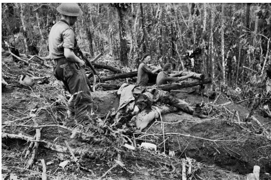
Бугенвиль, ноябрь 1944 года. Австралиец рассматривает труп японца