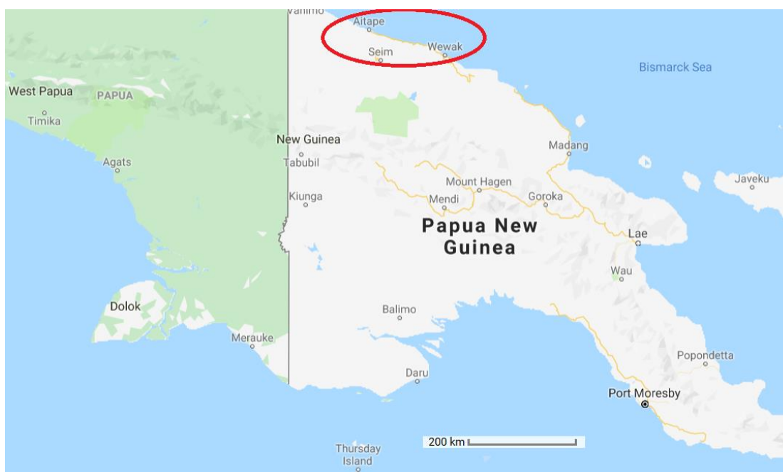
Участок боев на северном побережье Новой Гвинеи