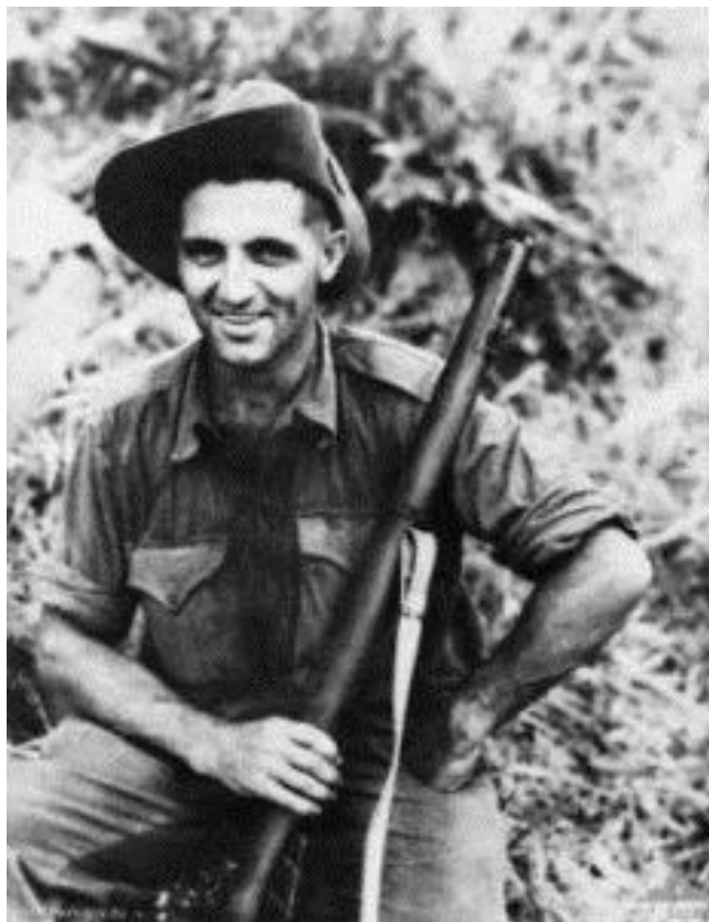
Лейтенант Том Деррик (Thomas Currie "Diver" Derrick - 20 марта 1914 – 24 мая 1945)