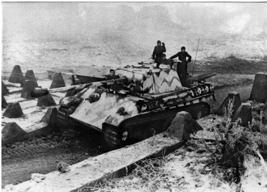
Танк Пантера продвигается к границе Рейха. Несколько недель до начала операции Veritable

Это оказалось мудрым решением, поскольку на этом участке немцы бросили вперед большие силы. Британцы окопались на ночь, при этом паводковые воды поступили к самой высокой точке участка, где они расположились. 15-я Дивизия использовала Террапины для переброски грузов частям, находившимся на передовой.