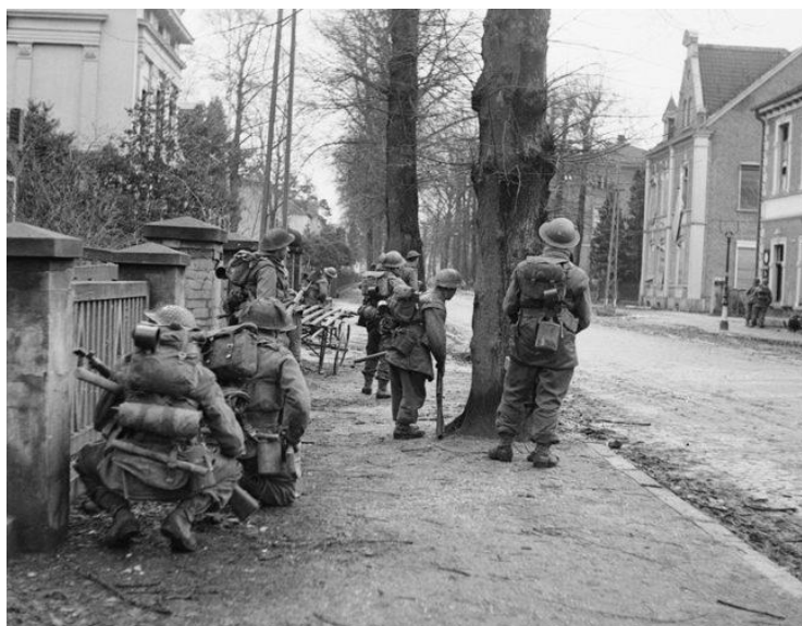
Гордонские Горцы медленно продвигаются по улицам Клеве, зачищая город от снайперов и прикрывающих отход основных сил немцев. 11 февраля 1945 года

На рассвете 11 февраля британцы возобновили атаки с частями 3-й Канадской, 15-й Шотландской и 43-й Уэссекской дивизий на их острие. Канадцы пробившись к каналу Spoey и к полуночи заняли позиции на его западном берегу от старого русла Рейна/ Alter Rhine на юге до окраин Клеве на севере.