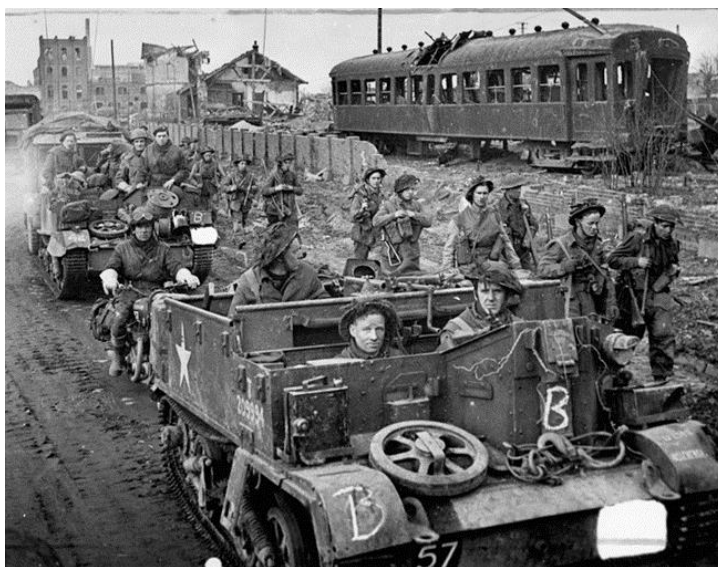
Британские легкие бронетранспортеры продвигаются по улице города Гох. 25 февраля 1945 года