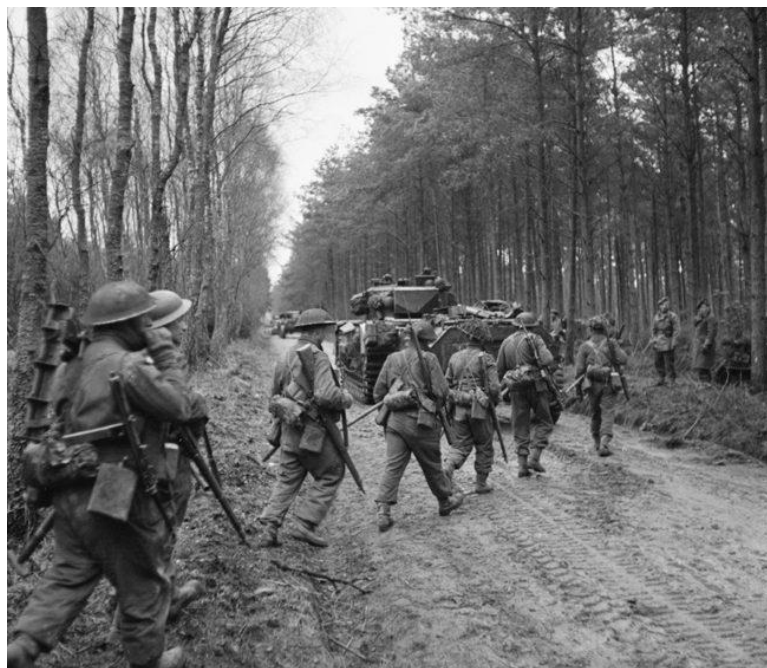
10 февраля 1945 года. Солдаты 2-го Батальона Сифортских Горцев/2 nd Seaforth Highlanders вступают в Райхсвальд

К рассвету 9 февраля 3-я Канадская Дивизия вышла на все намеченные рубежи первого дня и продолжила наступление, зачищая пойму реки Ваал и, тем самым, консолидируя левый фланг британцев.