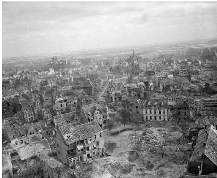
Руины города Клеве после налетов бомбардировщиков союзников...

превратили стоявшие на их пути города Клеве/Kleve и Гох/Goch в руины, сбросив на них 1 400 тонн бомб... Историк 4-го Батальона 7-го Полка Королевских Драгун (Royal Dragoons) писал: «Это была фантастическая сцена, которая не будет забыта теми, кто там был: мгновение тишины, затем рвущий уши грохот... Ночь осветили вспышки всех цветов, а трассы снарядов, выпущенных Бофорсами , сплелись в какие-то сказочные узоры в небе, устремляясь к целям.»