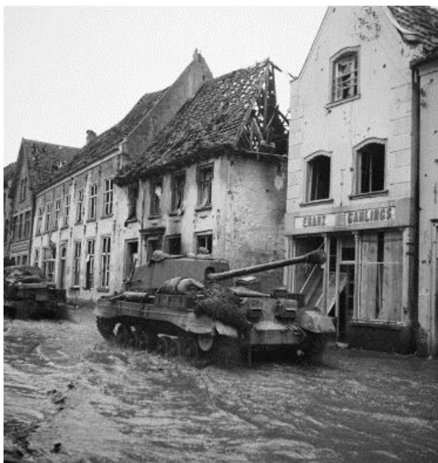
Британский истребитель танков Арчер/Archer продвигается по залитой паводковыми водами улице города Краненбург. 11 февраля 1945 года

Солдаты 1-го Полка Гордонских Горцев на окраине города Геннеп столкнулись с противником, закрепившимся в домах и встретивших их огнем. Используя уже наработанную тактику, шотландцы обрушили на дома огонь минометов и пулеметов, после чего солдаты приступили к зачистке домов одного за другим, атакуя их с тыла, со стороны задних дворов с их садовыми посадками. Зачистив одну сторону улицы, они точно так же зачищали другую.