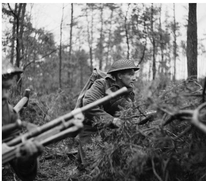
Солдаты 5-го Батальона 7-го Полка Гордонских горцев в атаке, второй день операции Veritable

В тот же день 7-я Канадская Бригада перешла в наступление восточнее Бедбурга при поддержке танков Шотландских Гвардейцев , Реджинских Стрелков/Regina Rifle Regiment и Королевских Виннипегских Стрелков/Royal Winnipeg Rifles . Эта боевая группа 3-й Канадской Дивизии получила приказ зачистить от противника высоты в районе городка Луизендорф. Немцы из 346-го Батальона Фузилеров и 60-го Механизированного Полка организованно отступили, после чего остановили пулеметным огнем Реджинских Стрелков , не дав им пересечь дорогу, получение контроля над которой было целью канадцев. Виннипегские Стрелки на бронетранспортерах Кенгуру двинулись вперед под огнем артиллерии прибывших в этот сектор боев немецких подкреплений. Артогонь замедлил продвижение этих машин, и первыми к Луизендорфу пробились танки Черчилль Шотландских Гвардейцев . Приблизившиеся канадские пехотинцы не проявили желания выбраться из своих бронетранспортеров и продолжить атаку, но капитан Шотландских Гвардейцев , продемонстрировав им свое презрение к опасности, покинул свой танк и стал прохаживаться между машинами, подбадривая их и призывая идти в атаку.