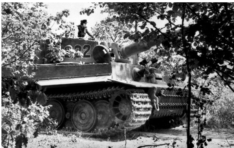
Северная Франция, лето 1944 года. Танк Тигр из состава 1-й Танковой Дивизии СС Leibstandarte Adolf Hitler, – одной из тех, которые приняли участие в атаке на Мортен