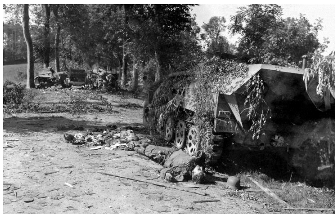
7 августа 1944 года. Немецкая колонна в начале наступления после атаки британских штурмовиков Тайфун. Видны трупы немецких солдат рядом с поврежденным полуусеничным бронетранспортером SdKfz 251

командование] никогда не придавало важного значения положению в воздухе, что поставило под сомнение наши возможности перемещаться и снабжать [войска].»