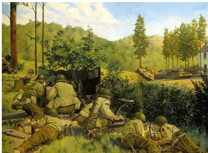
Американцы в обороне. Мортен, август 1944. Картина художника Кита Рокко (Keith Rocco)