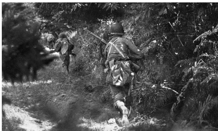
Момент боя за Высоту 314. Американцы перемещаются вдоль живой изгороди...