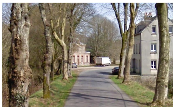
Снимок слева: на подступах к Мортену после завершения боев, участок разгрома с воздуха механизированной колонны. Среди немецких машин виден, по-видимому, ранее захваченный немцами американский джип; справа: тот же участок в наши дни...