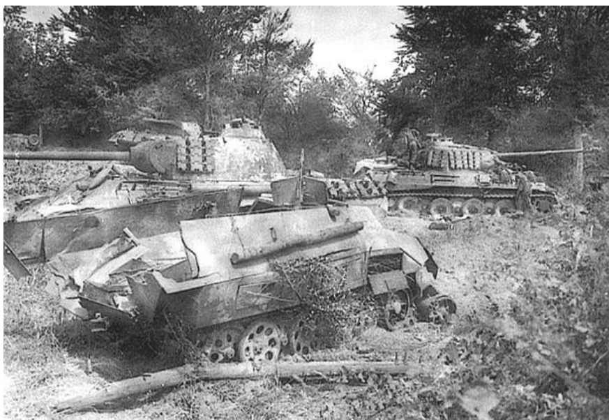
Уничтоженная немецкая бронетехника в районе деревни Сент-Бартлеми

После завершения боев американцы оценили степень воздействия авиации на бронетехнику противника и пришли к выводу, что большая часть последней была уничтожена действиями артиллерии и пехоты. Наибольший ущерб атаки с воздуха на механизированные колонны нанесли перемещавшейся на грузовиках пехоте, кроме того, они оказали значительное деморализующее и дезорганизирующее воздействие на противника.