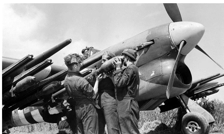
Нормандия, лето 1944 года. Оружейники подвешивают к крыльям Тайфуна Королевских ВВС 3-хдюймовые ракеты, готовя машину к атаке на бронетехнику немцев...