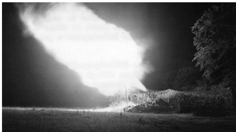
Ночь с 7 на 8 августа. Американская артиллерия ведет огонь по немцам, атакующим Высоту 314