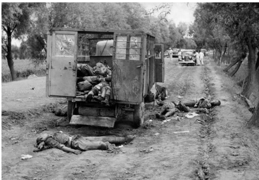
Убитые в ходе отступления китайские солдаты на одной из дорог, ведущих из Пекина

Так или иначе, с потерей узла обороны Наньюань и двух лучших генералов Чан Кайши был вынужден признать, что сражение за Пекин проиграно и дальнейшее сопротивление бесполезно. Генералиссимус отдал Суну приказ к отступлению. К вечеру генерал Сун оставил Пекин и вывел основную часть своих войск к городу Баодин/Baoding, расположенному примерно в 150 км к юго-западу.