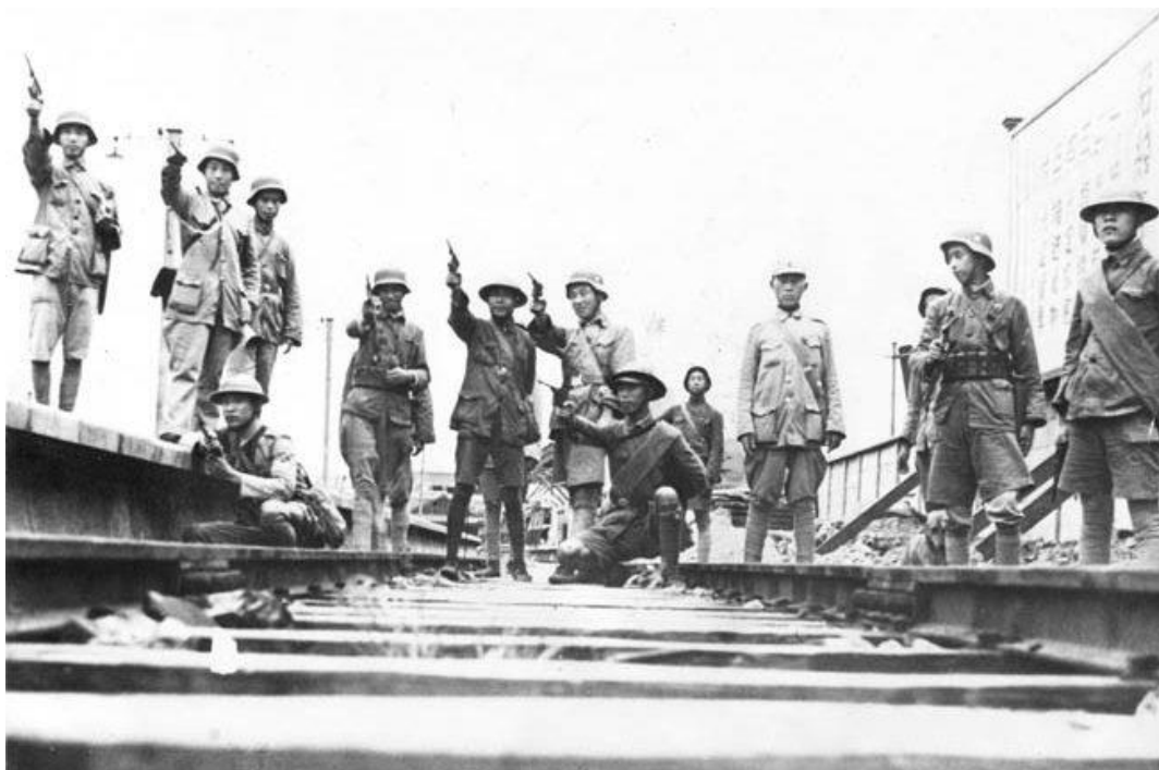
Китайские солдаты и офицеры позируют фотографу. На них можно видеть каски как немецкого, так и британского производства

Когда японцы вторглись в Манчжурию в 1931 году, сопротивление китайских вооруженных сил оказалось совершенно незначительным. Местные провинциальные военачальники получили от находившегося в Нанкине центрального правительства не допускать перерастания конфликта в масштабную войну. Обращения Китая в Лигу Наций и к США с призывами наложить санкции на Японию остались без ответа. Политика уступок в отношении Японии со стороны центрального китайского правительства, возглавляемого лидером Гоминьдана – партии китайских националистов - Чан Кайши , была сформулирована следующим образом: «Сначала внутреннее умиротворение, потом сопротивление угрозе извне.» Националисты уделяли первостепенное внимание борьбе против коммунистов, возглавляемых Мао Цзэдуном , которого они считали большей угрозой, чем японцев. По словам Чан Кайши, «японцы были кожным заболеванием, коммунисты – сердечным.»