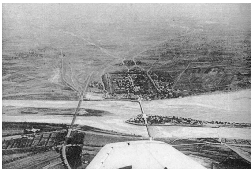
Вид с самолета на мост Марко Поло

в поддержке со стороны армий бывших местных военачальников. Вероятным было то, что ему предстояло сражаться против японцев собственными силами.