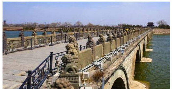
Мост Марко Поло в 1937 году и в наши дни

Быстро преодолев малоэффективное сопротивление китайцев, 6-я и 8-я роты 1-го Полка японцев прорвали оборону противника вдоль восточного берега реки Юндин севернее Ваньпина . Японцы переправились через реку и продолжили продвижение вперед на западном берегу, осуществляя обходной маневр на юго-западе, чтобы окружить крепость. Успешно обойдя Ваньпин и мост Марко Поло , японцы атаковали мост с тыла. Полковник Дзи Синьвен возглавил оборонительные усилия китайцев со 100 солдатами и офицерами и получил приказ удерживать мост до последнего человека. К удивлению японцев, китайцы сражались с исключительным упорством. К полудню японцы смогли занять только южный конец моста, а утром 9 июля получившие подкрепления китайцы отбили мост, атаковав в тумане и под дождем.