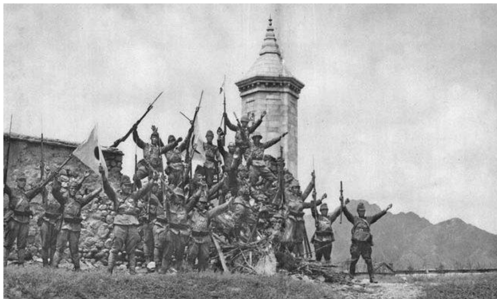
Японские солдаты позируют перед фотографом, празднуя падение Пекина

На рассвете 29 июля 5-я Дивизия Императорской Армии и части военно-морского спецназа атаковали Тяньцзинь и порт Танггу/Tanggu, которые обороняли части 38-й Дивизии НРА . Китайские солдаты и офицеры и пришедшие им на помощь добровольцы храбро сражались и даже сумели отбить у японцев ранее захваченный ими железнодорожный вокзал Тяньцзина. Дивизия несколько раз атаковала расположение японского штаба в районе станции Хайгуан/Haiguan и аэропорт Донгджузи/Dongjuzi, однако, японцы отбили атаки противника с помощью артиллерии и авиации. 30 июля, после ожесточенных боев, Тяньцзинь перешел под их контроль.