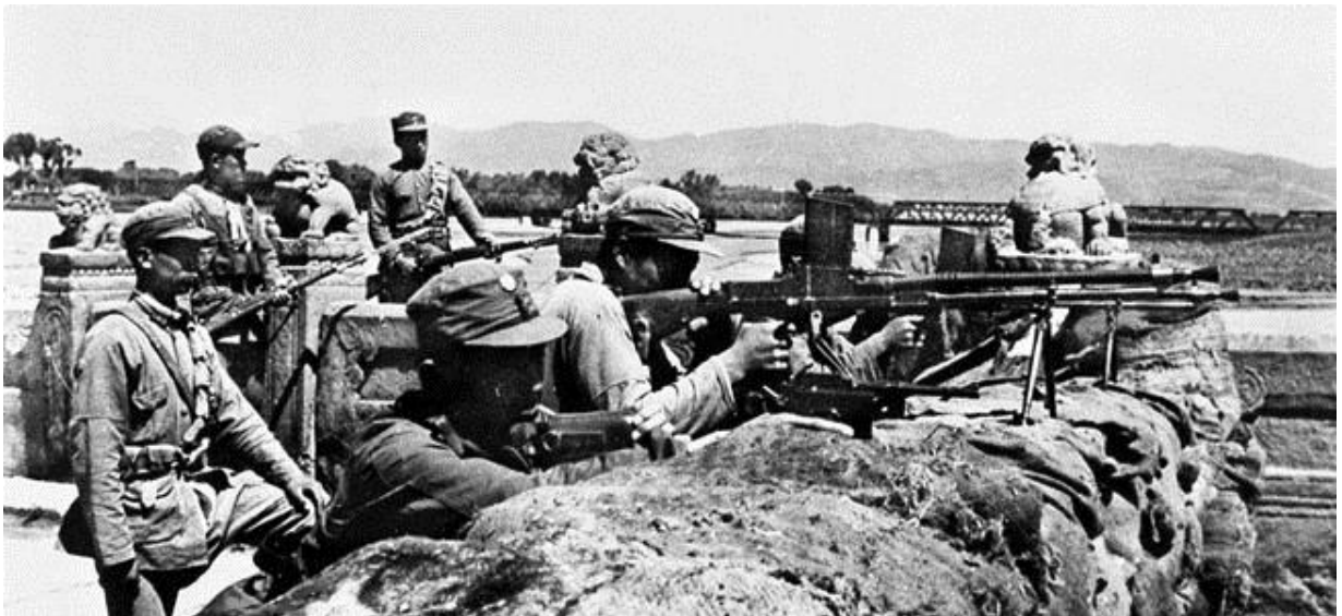
Китайские оборонительные позиции близ моста Марко Поло 8 июля 1937 года. На заднем плане – стратегический железнодорожный мост

Хотя дискуссии о причинах инцидента у моста Марко Поло продолжают, история последовавших за этим событий известна. В 23.40 7 июля, сразу после того, как полковник Дзи отказался выполнить требования японцев открыть им доступ в крепость Ваньпин , генерал-лейтенант Цинь Дэчунь (Dechun Qin), и.о. командующего 29-й Армией, мэр Пекина и председатель Хэбейско-Чахарского Политического Совета , получил от японцев те же требования, что и раньше. Цинь отказался пойти японцам навстречу, но согласился отдать приказ китайским частям, находившимся в крепости, осуществить поисковые мероприятия вместе с японскими офицерами. Японцы выразили удовлетворение этим ответом, но напряжение не спадало: время от времени звучали выстрелы, и обе стороны спешно перебрасывали подкрепления к месту событий. На следующий день, около 5 утра, японский 1-й Пехотный Полк перешел в атаку на позиции китайцев в окрестностях крепости Ваньпин и моста Марко Поло , нарушив заключенное ранее соглашение.