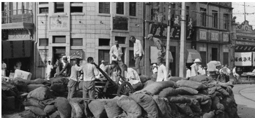
После боев у моста Марко Поло китайские солдаты строят оборонительные укрепления на улицах Пекина, но они не помогут отстоять город...

Правда, в этот же день одна из бригад 38-й Дивизии НРА отбросила японцев от Ланфана (15 км к юго-востоку от Тунчжоу). Части 37-й Дивизии НРА также контратаковали противника в районе дальнего западного пригорода Пекина Фэнтай/Fengtai, но были отброшены японцами.