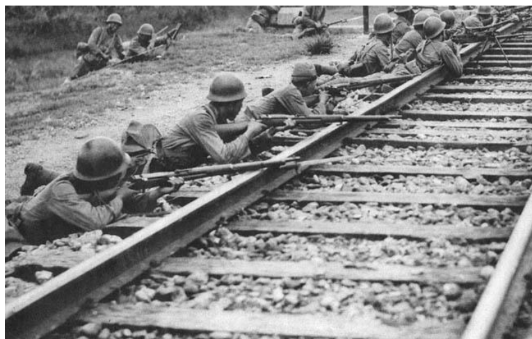
Японские солдаты в бою у железной дороги близ Пекина в августе 1937 года