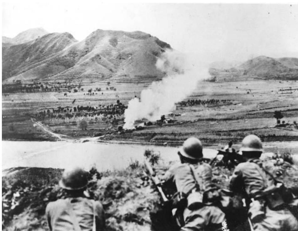
Японские солдаты на к северу от Пекина наблюдают за обстрелом китайских позиций в расположенной ниже долине

панику. Кроме того, полковник Дзи никогда не доверял японцам и знал, что они подстроили несколько подобных инцидентов, чтобы занять еще один кусок китайских территорий. Около 05.30 8 июля японцы начали артиллерийский обстрел моста и крепости Ваньпин , после чего перешли в атаку на китайские позиции в окрестностях крепости.