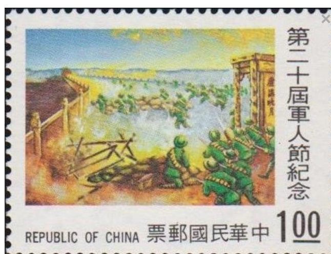
Выпущенная на Тайване почтовая марка, посвященная событиям на мосту Марко Поло