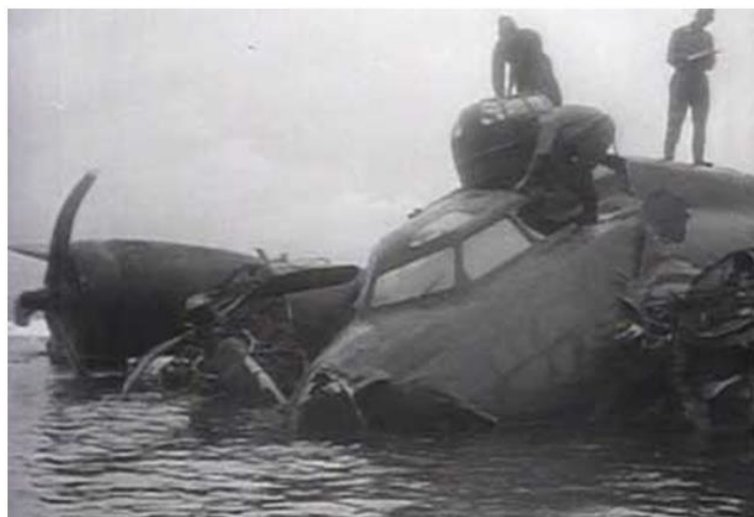
Японцы осматривают B-17, сбитый близ плантации Комалу