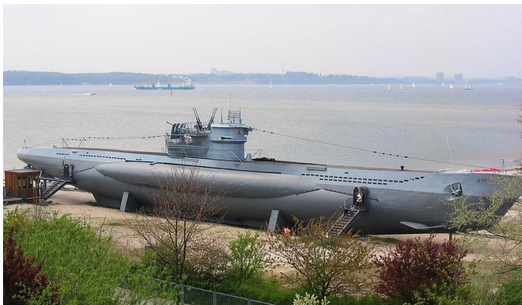
Лодка U-995, однотипная с U-1271, Военно-Морской Мемориал Лабё/Laboe, Германия

В свой последний, седьмой патруль U-242 отправится уже без Юхtritца, переведенного на другой корабль. 5 апреля 1945 года лодка подорвалась на mine и затонула между юго-восточной Ирландией и Уэльсом со всем экипажем из 44 человек. Так смерть обошла стороной австралийца, ставшего немецким моряком... К тому времени он уже служил на лодке U-1271 , которая, вероятно, по счастью для него, так и не осуществила ни одного боевого похода. 9 мая 1945 года лодка сдалась британцам, а 8 декабря 1945 года была затоплена вместе со 116 другими.