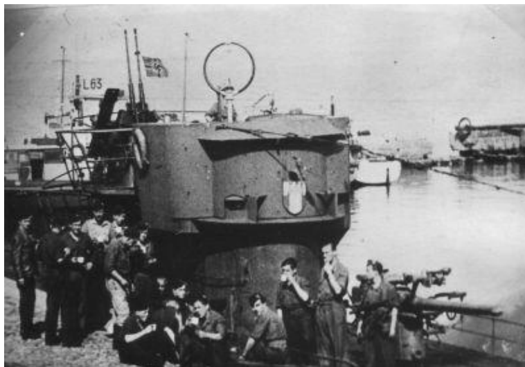
U-242 на базе, 1943 год

Вернемся к судьбе Эвальда Юхритца. Первоначально он прошел соответствующую подготовку и уже в чине лейтенанта цур зее служил на патрульных кораблях. Позднее был отправлен на курсы подготовки офицеров подводного флота и в дальнейшем служил на двух лодках: U-242 и U-1271 .