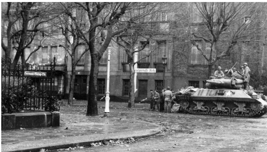
Мец, 21 ноября 1944 года. Французские гражданские лица (слева от истребителя танков М-10) получают продовольственные рационы у членов экипажа

Противник закрепился в городских зданиях, используя мешки с песком и колючую проволоку. Американцы продвигались от дома к дому, часто зачищая комнату за комнатой в каждом из них. Для этого они часто применяли 5-галонные (примерно 20-литровые) канистры, которые сначала набивали тряпками, а потом поджигали и швыряли в занимаемые немцами комнаты. Это импровизированное оружие действовало эффективно... В центре города немцы превратили прочное здание мэрии в небольшую крепость, которую не брали снаряды легких и противотанковых пушек. 20 октября американцы подключили к обстрелу здания 150-мм гаубицу. Бои в окрестностях мэрии продолжались неделю. Когда 26 октября американцы, в итоге, ворвались в здание, они были отброшены немецкими огнеметчиками.