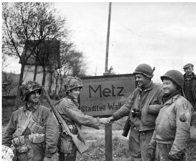
Военнослужащие 5-й и 95-й пехотных дивизий пожимают друг другу руки после того, как был заблокирован последний путь к отступлению противника из Меца. 22 ноября 1944 года