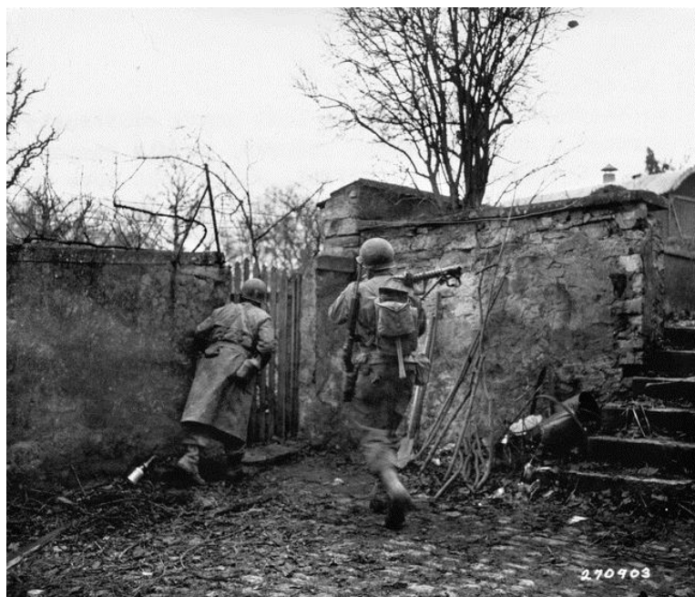
Город Сарре-Юнион/Sarre-Union восточнее Меца. Офицер 26-й Дивизии осторожно выглядывает из-за каменной стены. Справа от него солдат с пулеметом калибра .30 на плече