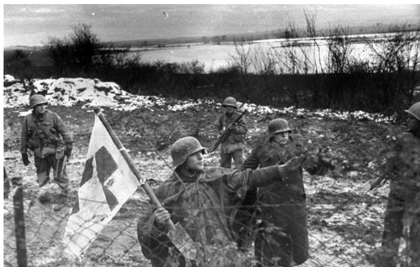
Немецкие санитары с флагом Красного Креста на черенке лопаты сдаются американцам на окраине Меца. 22 ноября 1944 года

приступила к осаде форта Сен-Жульен/St. Julien , систематически ведя огонь по нему из 150-мм самоходных орудий.