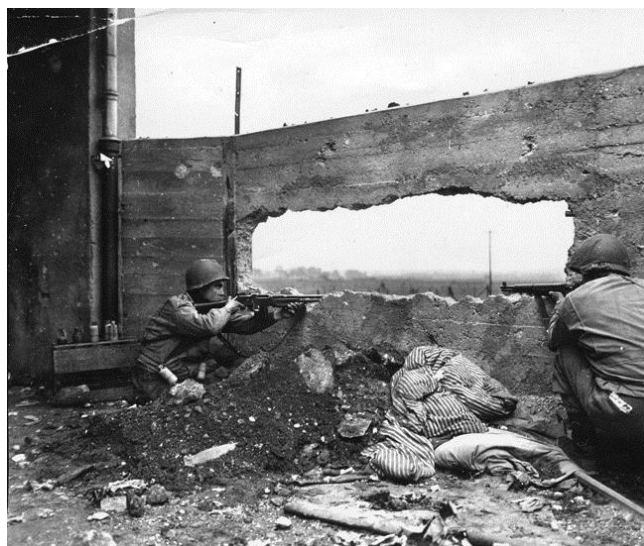
Солдат 90-й Дивизии с ручным пулеметом Браунина/Browning Automatic Rifle – BAR и его товарищ внимательно наблюдают за противником в районе городка Мезьер-ле-Мец. Октябрь 1944 года

Главкомандующий Экспедиционным Корпусом Союзников/Allied Expeditionary Force Эйзенхауэр и его штаб запланировали на конец 1944-го наступление по двум направлениям с целью захвата промышленных районов Рура и Саара, снабжавших вооруженные силы Рейха техникой и боеприпасами. 1-я Армия генерала Ходжеса (Courtney Hodges) и 9-я Армия генерала Симпсона должны были находиться на острие атаки, нацеленной на более крупный по площади Рур на севере, тогда как на юге 3-я Армия Паттона должна была наступать на менее значительный по площади Саар. Хотя точной даты начала наступления обозначено пока не было, Брэдли поручил своим подчиненным разработку детального плана операций в их секторах. Он организовал передачу в подчинение Паттона трех свежих, необстрелянных дивизий для участия в наступлении. Первой из них в сектор 3-й Армии прибыла 26-я Пехотная Дивизия генерал-майора Пола (Willard Paul), которая заняла позиции на правом фланге генерала Эдди 12 октября. Две другие дивизии прибыли в сектор 20-го Корпуса: 95-я Чтобы компенсировать произошедшую недавно переброску 7-й Танковой Дивизии в подчинение 9-й Армии, Уокеру передали 10-ю Танковую Дивизию генерал-майора Морриса (William Morris), которая займет позиции на левом фланге Уокера только ко 2 ноября.