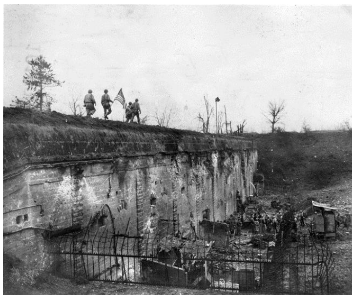
Солдаты 26-й Пехотной Дивизии несут флаг США, чтобы водрузить его над фортом Жанна д'Арк/Jeanne d'Arc – последним взятым фортом Меца перед капитуляцией гарнизона города