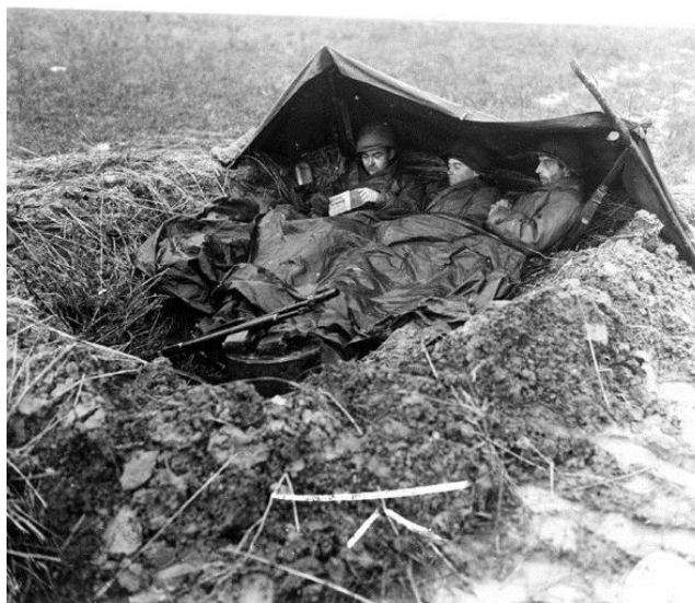
Солдаты Паттона укрываются от осеннего дождя

Людям генерала Эдди приходилось бороться не только с противником, но и с погодой. На второй день наступления сильно похолодало. Всю последующую неделю шли дожди, перемежаясь со снегом. Американцы, все еще одетые в летнюю форму, были постоянно мокрыми до нитки и по щиколотку, а нередко и по колено в грязи. В результате только в 26-й Дивизии около 3 000 человек за время ноябрьского наступления столкнулись с такой проблемой, как траншейная стопа .