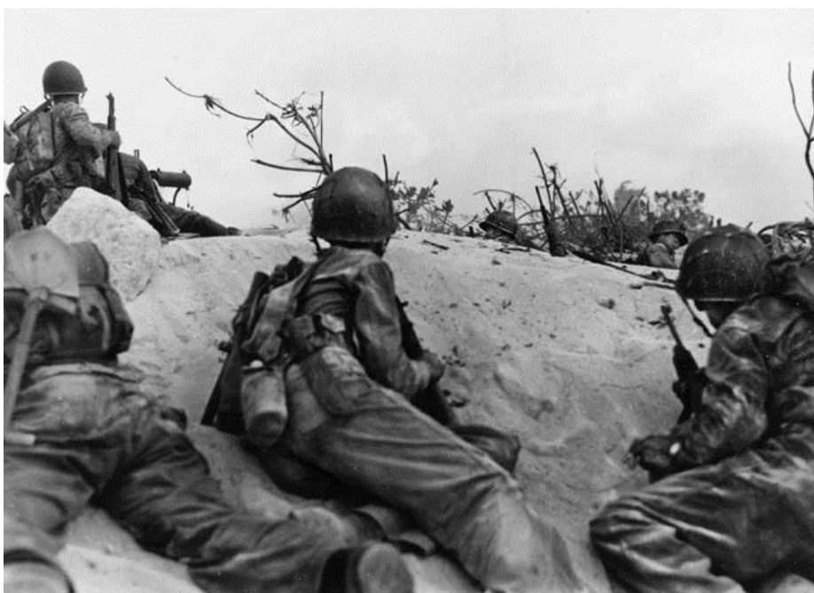
Морпехи из 22-го Полка, поддержанные пулеметом калибра .30, готовятся к атаке на позиции японцев.