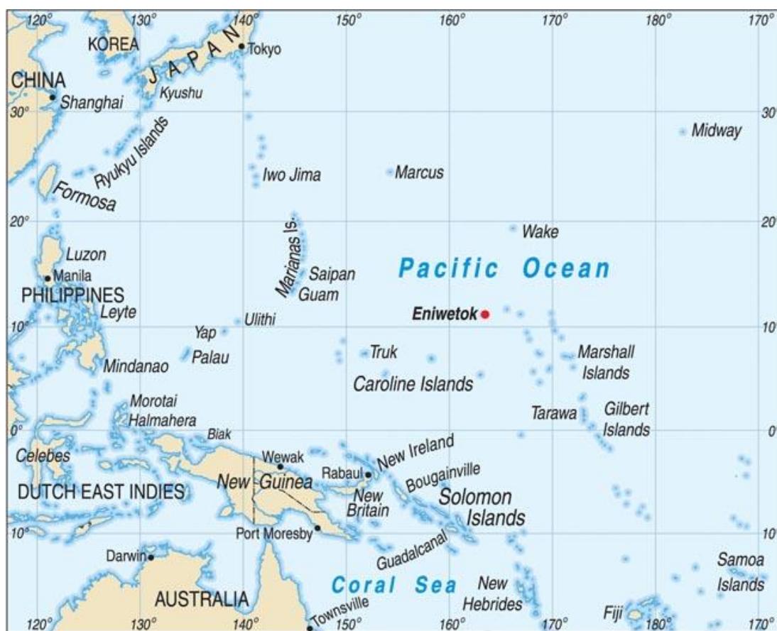
Схематическая карта центральной части Тихоокеанского ТВД

Американское командование уже долгое время планировало начать наступление в центральной части Тихого Океана с захвата Маршалловых островов – архипелага, включающего в себя, по меньшей мере, 32 острова и множество атоллов и занимающего площадь более чем в 400 000 квадратных миль на полпути между Японией и США.