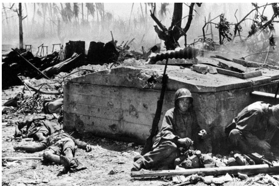
Американский солдат присел, чтобы перекусить, рядом с бетонным бункером противника. Слева – убитые японцы. 20 февраля 1944 года