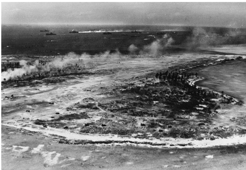
Танки Шерман (ближе к нижнему краю снимка) продвигаются через изрытый воронками остров Энгеби на последней стадии боев за него. На аэродроме видны уничтоженные японские самолеты.