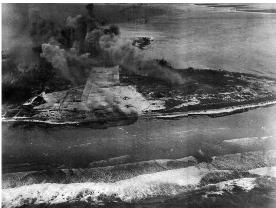
Энвиеок после атак палубной авиации. 3 февраля 1945 года