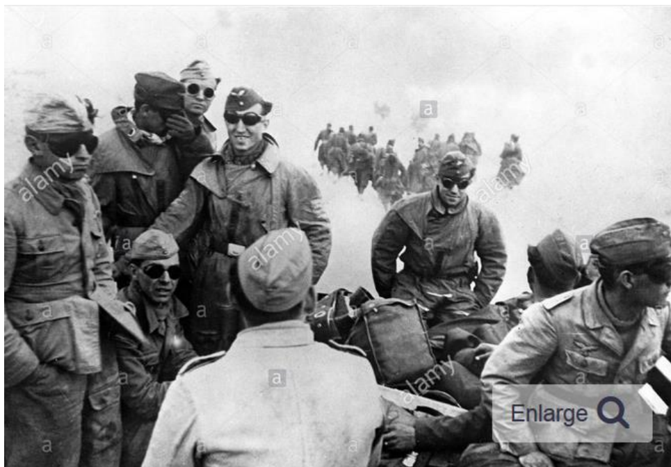
Февраль 1942 года. Немецкие солдаты в отличном расположении духа...

Итак, в течение двух недель британцы потеряли всю территорию, захваченную в упорных боях в 1941 году. Роммель нанес им концентрированный удар в тот момент, когда они медлили с консолидацией сил на достигнутом рубеже максимального продвижения, когда их коммуникации были растянуты на огромное расстояние, что затруднило снабжение войск, и когда их группировка войск лишилась нескольких опытных, обстрелянных в боях бронетанковых и пехотных частей. Бронетехника британцев оказалась заметно слабее немецкой по многим показателям. Наступательная тактика Роммеля, заключающаяся в максимальной концентрации сил на нескольких узких направлениях, обходных маневрах и мастерском взаимодействии танков и артиллерии, уничтожении рассредоточенного противника по частям, снова принесла ему оглушительный успех.