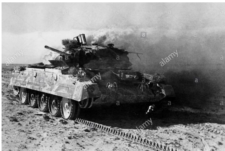
Горящий Крусейдер. Район Агедабии

Наступление войск Оси явно застало британцев врасплох, и их командование пока не среагировало на эти события сколь-нибудь заметно. В 11.00 22 января боевая группа Оси захватила Агедабию, которую обороняли довольно незначительные силы, и Роммель, который лично руководил атакой, отдал приказал немедленно возобновить преследование противника через Антелат в направлении Саунну. Войска оси вышли к Антелату в 15.30, Саунну был взят в 19.30 после кратковременного боя. Те части DAK, которые к вечеру дошли до Агедабии, также были направлены в сторону Антелата с приказом остановить к югу от него попытки британцев пробиться из окружения в северном направлении.