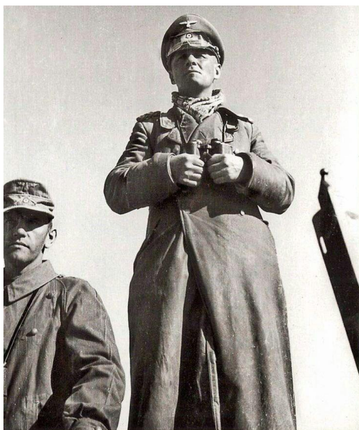
Альфред Гаузе и Эрвин Роммель