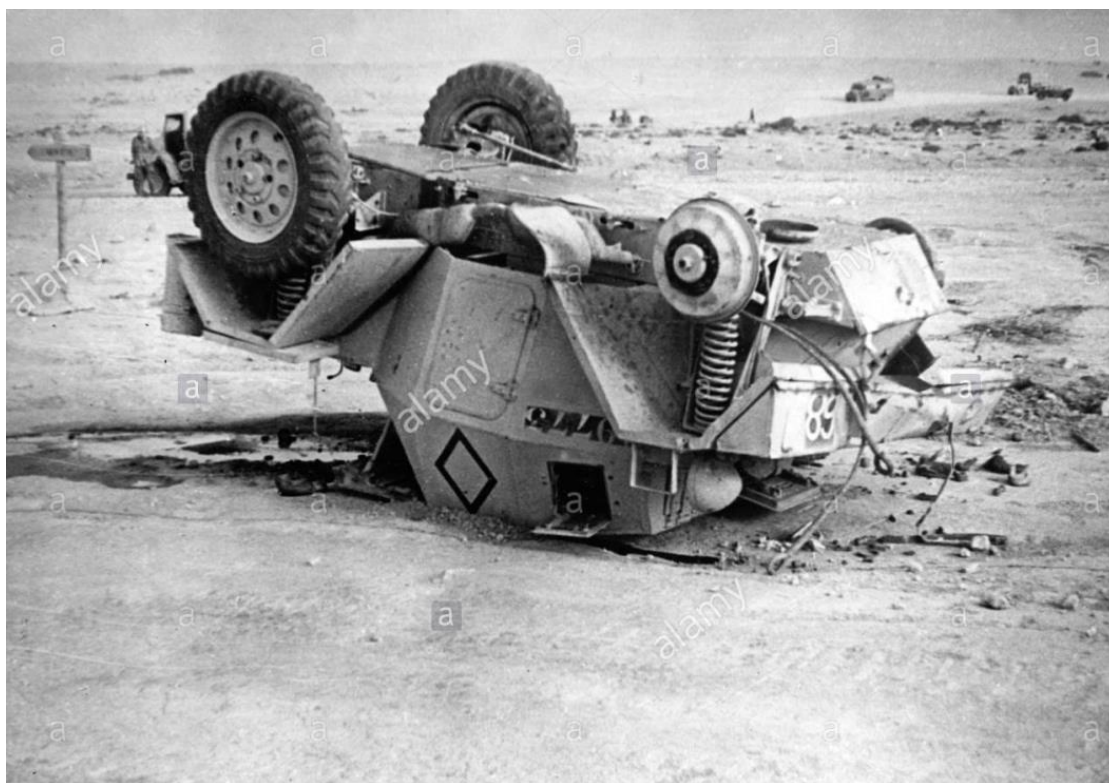
Перевернутый британский броневедомитель на немецком фотоснимке. 13 февраля 1942

Судя по всему, войска Оси также понесли ощутимые потери и были утомлены. Когда Роммель отбыл в Берлин, в журнале боевых действий 90-й Дивизии Легкой Пехоты появилась следующая запись: «Главкомандующий отбыл в отпуск на 3-4 недели. Все вздохнули с облегчением и с нетерпением ждут предстоящие спокойные дни.»