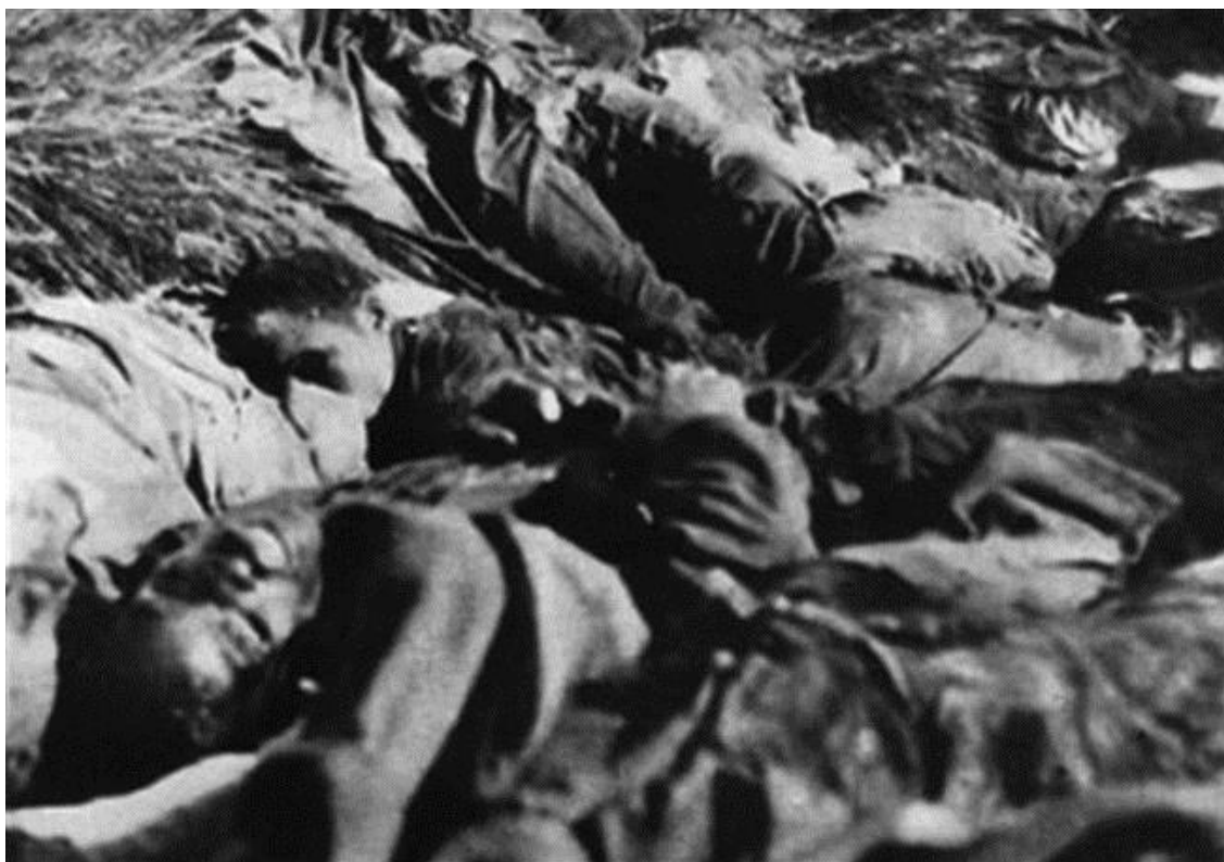
Тела солдат 333-го Дивизиона, расстрелянных у деревни Верет