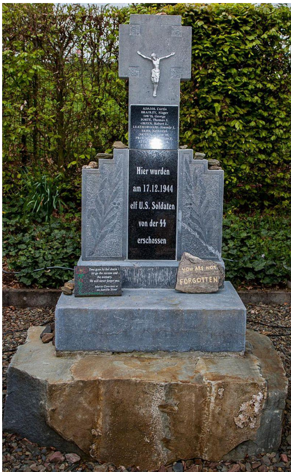
Памятник 11 погибшим артиллеристам, воздвигнутый в 1994 году https://www.fold3.com/page/653591967-wereth-11-massacre