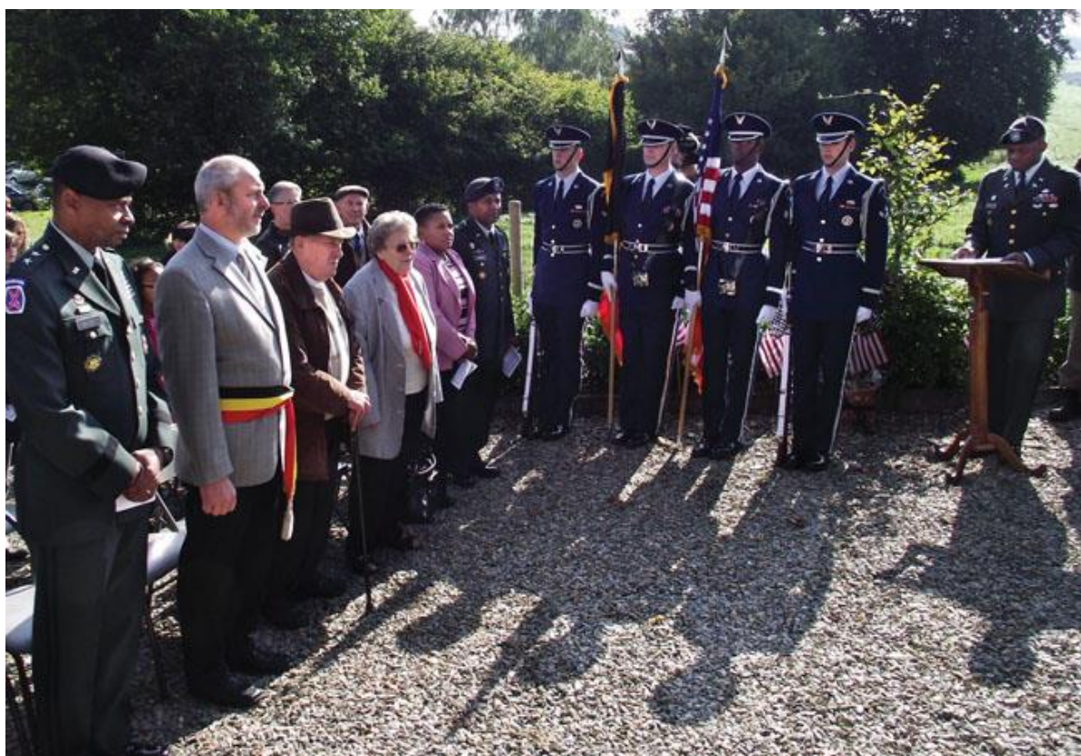
Мемориальная церемония близ деревни Верет 23 июня 2004 года в память от тех, кто был убит в этих местах в 1944 году...

Вообще, в плен попало больше половины солдат Дивизиона, и они пережили войну в лагерях для военнопленных. 11 их товарищей, к собственному несчастью, оказались сами по себе и попали в плен вдали от глаз возможных свидетелей. Так или иначе, в феврале 1947 года дело было закрыто. Возможно, никто и никогда уже не узнает правды о том, кто совершил это преступление.