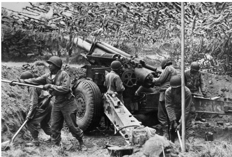
Артиллеристы 333-го Дивизиона устанавливают 155-мм гаубицу на огневую позицию. Нормандия, июнь 1944 года

Затем наступило время очередной переброски, на этот раз, в район расположенного на побережье острова Бретань города Сен-Мало/Saint-Malo с его 2 000-летней крепостью. К этому времени 83-я Пехотная Дивизия, известная под прозвищем Thunderbolt , уже потеряла один батальон в попытке взять город фронтальной атакой. 13 августа 1944 года в этот сектор боевых действий прибыл 333-й Дивизион и разместил свои пушки в 10 000 ярдов от массивных стен города.