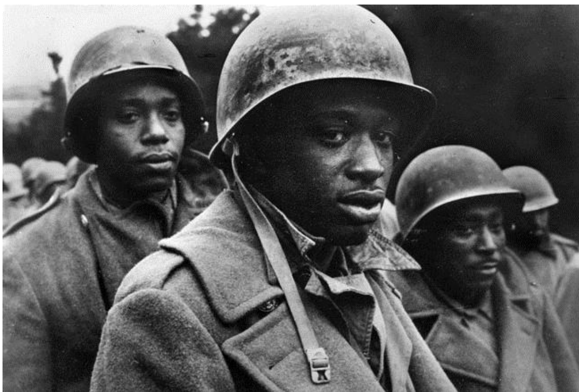
Кадр из немецких киноновостей, показывающий солдат 333-го Дивизиона, оказавшихся в немецком плену в Арденнах