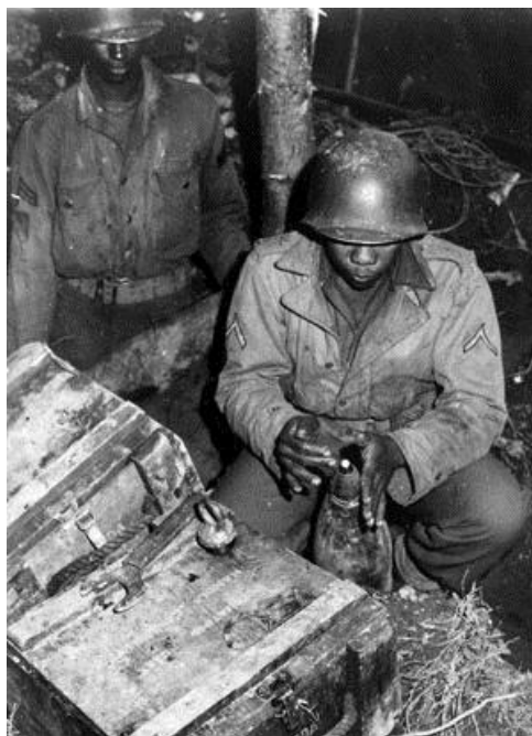
Артиллерист 333-го Дивизиона выставляет взрыватель на 155-мм снаряде. Район города Шлаузенбах/Schlaussenbach, Германия, октябрь 1944 года