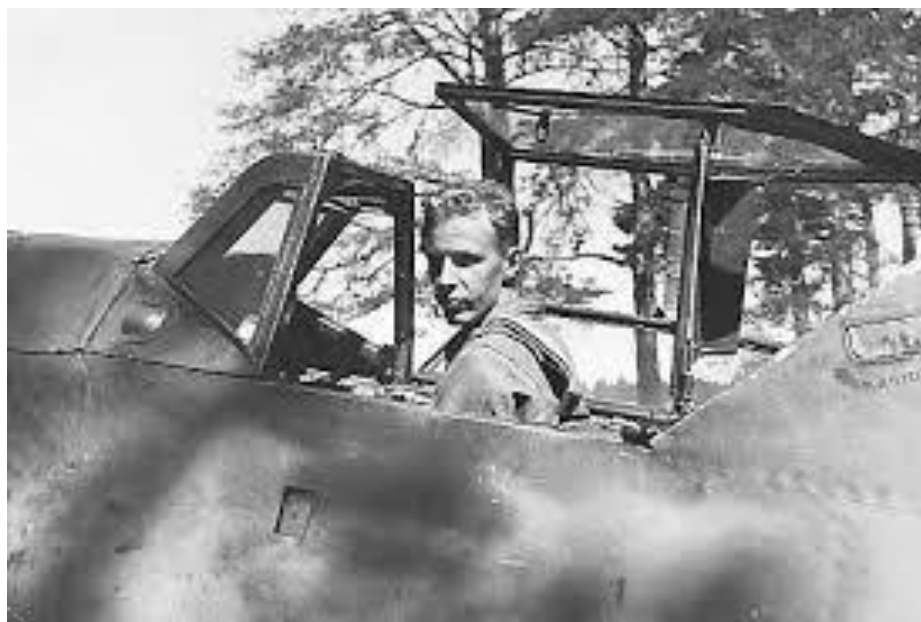
Кархила в кабине истребителя