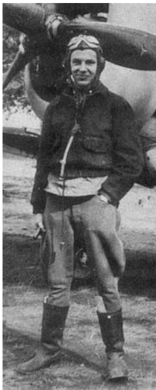
Фотография, сделанная после первой победы

и выпустил очередь с большого расстояния, пытаюсь отогнать его от FK . Затем я вновь открыл огонь, и И-16 загорелся. Летчик выпрыгнул и исчез в лесной чаще – его парашют не раскрылся. Его истребитель упал на окраину болота и взорвался.