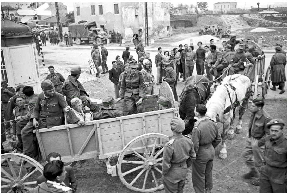
Итальянские партизаны передают новозеландцам сдавшихся им в плен немцев. Северная Италия, 29 апреля 1945 года

После войны первоначально нас удерживали в ..., а потом отправили в Анкону/Ancona, где разместили на макушке какого-то грязного песчаного холма. Дважды я испытал дурное обращение со стороны британцев. Еды нам давали совсем мало. Некоторые из нас не выдерживали жары и падали в обмороки, и тогда британцы били их прикладами своих винтовок. Это был первый раз. Второй раз это случилось тогда, когда я оказался в лагере для военнопленных в одном из городков, и обращались с нами очень плохо: там мы пробирались через проволочное ограждение и воровали виноград. В январе 1946-го я оказался в Таранто... Потом было еще одно место - там нас заставляли таскать ведра с фекалиями и выливать и в яму в центре городка. Это было унижительно, а местные жители аплодировали. Думаю, там немцев ненавидели. Дело было где-то близ Неаполя, название городка я не помню.