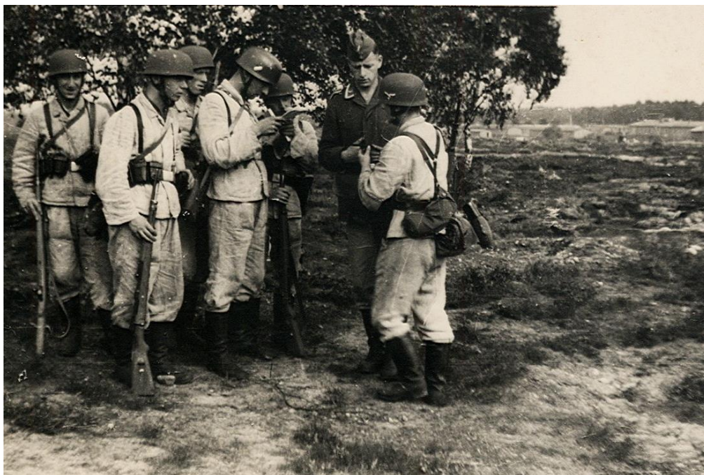
Обучение немецких парашютистов. 1939 год

Да. Так и было, а мой отец при этом думал, что я записался в ВВС.