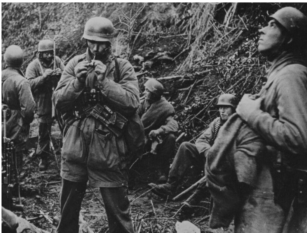
Немецкие парашютисты на привале. Италия, 1944 год

У нас были хорошие отношения с местными. Многие подходили к нам, особенно молодые женщины и девушки – они подходили и говорили: «Заберите нас с собой, потому что придут американцы и изнасилуют нас.»