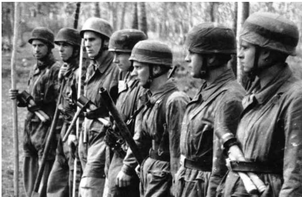
Немецкие парашютисты в Италии

Удача была со мной: я и мой друг успели забежать на один из последних паромов, на котором перебрались на другой берег. Там мы снова собрались вместе. Дело было весной, где-то в апреле. Когда мы переправлялись через По, было 10 или 11 апреля 45-го. Точно не скажу. С того момента мы отступали. Спустились в какую-то долину, после чего 1-я Дивизия направилась в сторону Триеста, а наша, 4-я, пошла на север. Противник, его пехота, больше не вступал с нами в бой, по большей части, нас атаковали с воздуха. Самолеты нас бомбили и обстреливали, передвигаться было трудно. Верона была старинной крепостью, там было много подземелий. Как-то бомба упала рядом с входом в одно из них, и началась паника – не среди нас, из 4-й Дивизии, а других – там были и солдаты, и гражданские... После этого мы стали подниматься вверх по долине одной из рек и заняли позиции, на которых раньше находились части СС: они отступили в горы. Мы пробыли там дней 10, после чего пошли в сторону Роверетто/Roveretto (60-65 км к северу от Вероны – ВК).