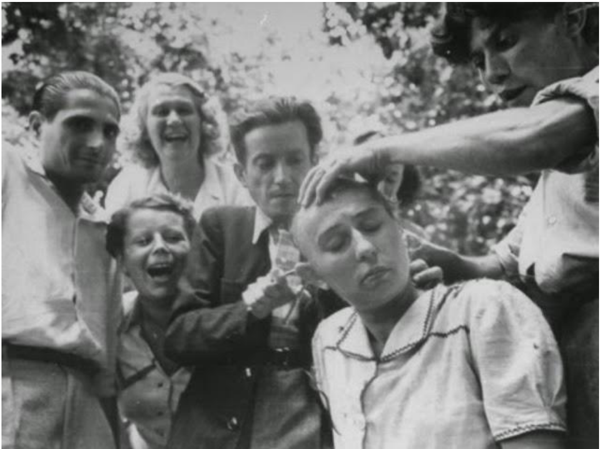
Сразу после освобождения на улицах Марселя: женщину, обвиненную в «горизонтальном» коллаборационизме, стригут наголо. Зрители ликуют... http://www.vintag.es/2015/07/pictures-of-collaborator-girls-in-world.html

Наша Дивизия переместилась на новые позиции в долине реки Ду. Сектор фронта, удерживаемый нашим Корпусом, протягивался от Шалон-на-Соне до города Безансон/Besanson. К 8 сентября линию фронта пришлось спрямить и укоротить из-за многочисленных прорывов американских танков. На следующее утро наша оборонительная линия уже протягивалась вдоль притока Соны - реки Оньон/Ognon и отстояла от реки Ду на расстояние от 5 до 20 км. 8 или 9 сентября мой коллега, майор Майер, вместе со своим адъютантом был ранен огнем американского танка и попал в плен. Позднее, когда он вернулся в свой родной Штутгарт, Майер рассказал мне, что американские медсестры позаботились о нем выше всяких похвал. Без пенициллина, которого в то время у нас просто еще не было, он, скорее всего, просто умер бы от полученных ранений.