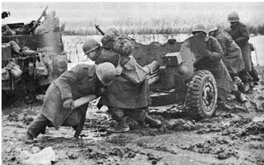
Американские артиллеристы пытаются управиться со своим 57-мм противотанковым орудием (вес – 1140 кг)