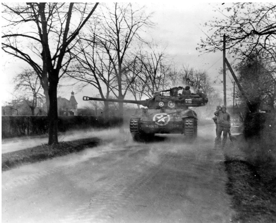
Солдаты 397-го Полка наблюдают за тем, как истребитель танков М18 ведет огонь по противнику в ходе атаки на город Вислох/Wiesloch 1 апреля 1945 года