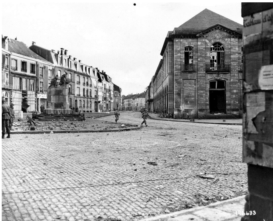
Солдаты 397-го Полка перебегают через уличный перекресток в Рао-ле-Этапе

7 ноября 397-й Полк выдвинулся вперед, впервые столкнулся с немцами и понес первые потери. Дивизия получила приказ взять Рао-ле-Этап/Raon l'Étape – хорошо укрепленный