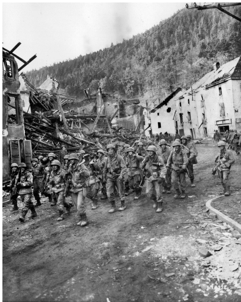
Солдаты 397-го Полка проходят через Рао-ле-Этап 18 ноября 1944 года

18 ноября 100-я Дивизия взяла Рао-ле-Этап. «Когда мы вышли на окраину города, - вспоминал Ринкер, - какие-то французы стали раздавать нам выпивку в благодарность за то, что мы освободили их от немцев. До чего же они были счастливы!» Американец сделал добрый глоток, который обжег его изнутри и едва не свалил с ног: «Я-то ожидал, что это будет хорошее вино, но француз дал мне выпить свой лучший коньяк. После этого я больше ни разу не принял предложение выпить от благодарных французов.»