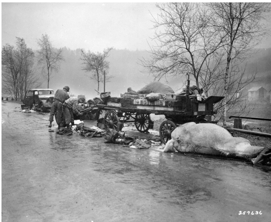
GI осматривают брошенную немецкую повозку...