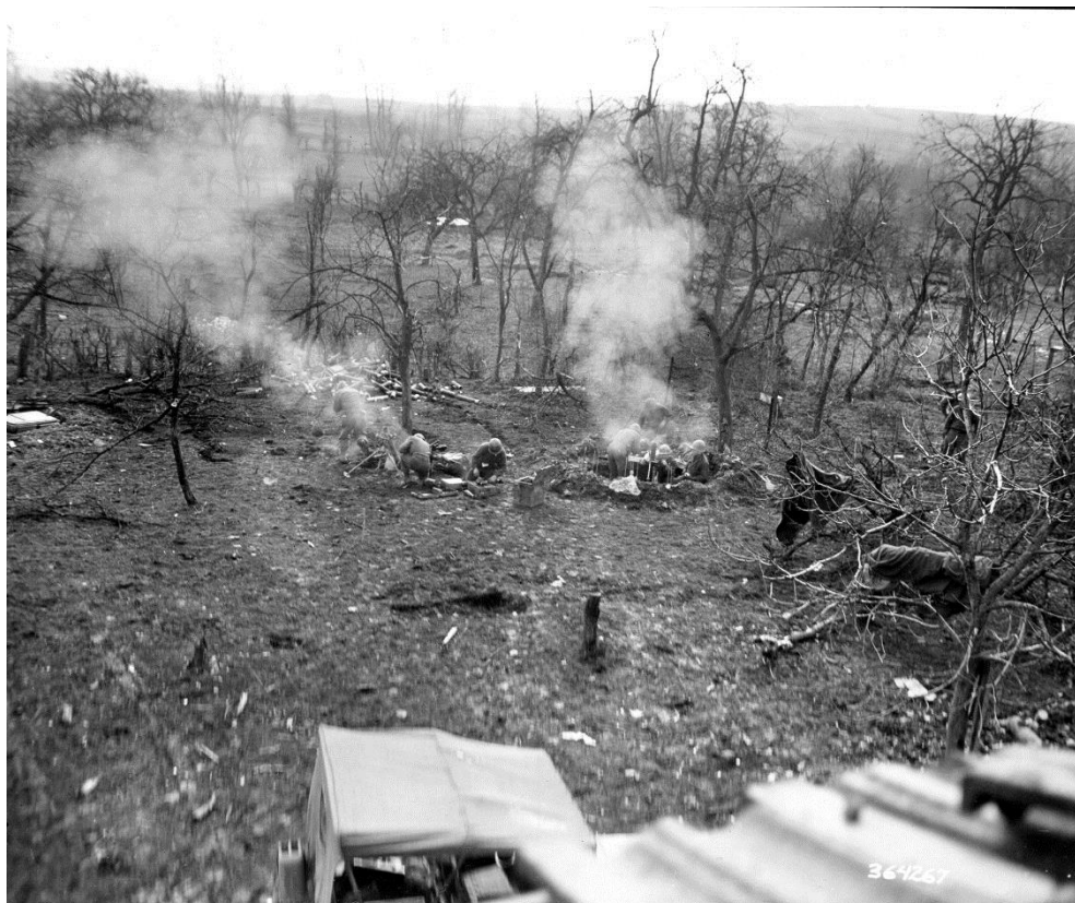
Минометчики 44-й Пехотной Дивизии, занимавшей позиции рядом с 397-м Полком близ Римлина, ведут огонь из нескольких стволов, в том числе, из трофейного немецкого миномета.

Когда уставшие G/ устраивались на ночлег, на передовую была переброшена инженерная рота, оснащенная кувалдами, предназначенными для того, чтобы разбить промерзшую почву и дать солдатам 2-го Батальона окопаться.