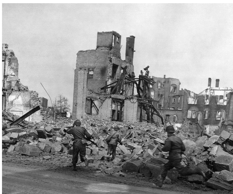
Солдаты 100-й Дивизии перебегают под огнем через руины Хайльбронна

Фабричные здания были окружены каменной стеной высотой примерно футов пять, которая была для нас и укрытием, и проблемой, потому что перелезть через нее предстояло под вражеским огнем. Примерно в 100 футах от стены я нашел кучу гравия высотой около трех футов. Рация была тяжелой, и я остановился за этой кучей, чтобы перевести дух, прежде чем перебраться через стену. Я пробыл там около минуты, когда мимо моей головы пролетела снайперская пуля с таким громким треском, что я инстинктивно дернул головой, от чего она едва не слетела с плеч. Эта пуля, должно быть, прошла впритирку с моей каской. Я немедленно рванулся вперед и без усилий перескочил через эту стену одним прыжком.