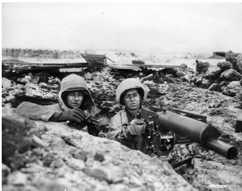
Эти два пулеметчика из Роты М 397-го Полка помогли отбить вражескую атаку на Римлин/Rimling. Согласно рапортам об этом бое, они убили при этом, по меньшей мере, 100 немцев в рождественский день 1944 года