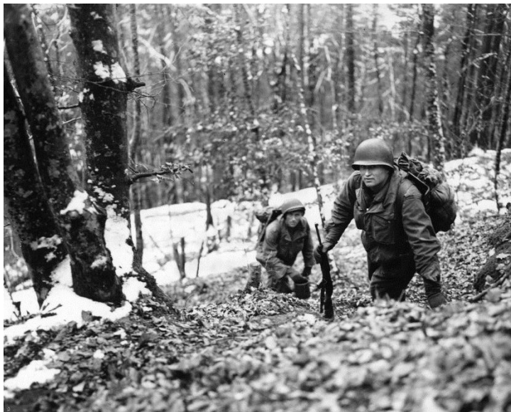
Солдаты 45-й Пехотной Дивизии забираются вверх по склону где-то в Вогезах

Офицеров и сержантов стало невозможно отличить от рядовых. Это было сделано для того, чтобы лишить вражеских снайперов возможности концентрировать огонь на старших по званию, а противника в целом возможности идентифицировать, к какому соединению мы принадлежим, в случае попадания в плен.»