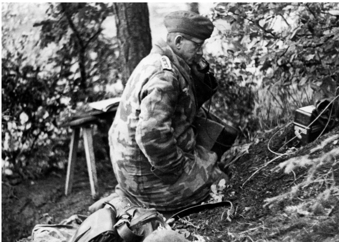
Немецкий наблюдатель наводит по телефону артиллерийский огонь. Вогезские горы

Хотя немцы и откатились 8 января, они не теряли инициативу и продолжали держать американцев под артиллерийским и ракетным огнем. Они перерезали дорогу Римлин – Гизин/Guising, заняли Высоту 370 к югу от Римлина и западную часть этого городка. Американские танки попытались сбить немцев с Высоты 370 , но безуспешно.