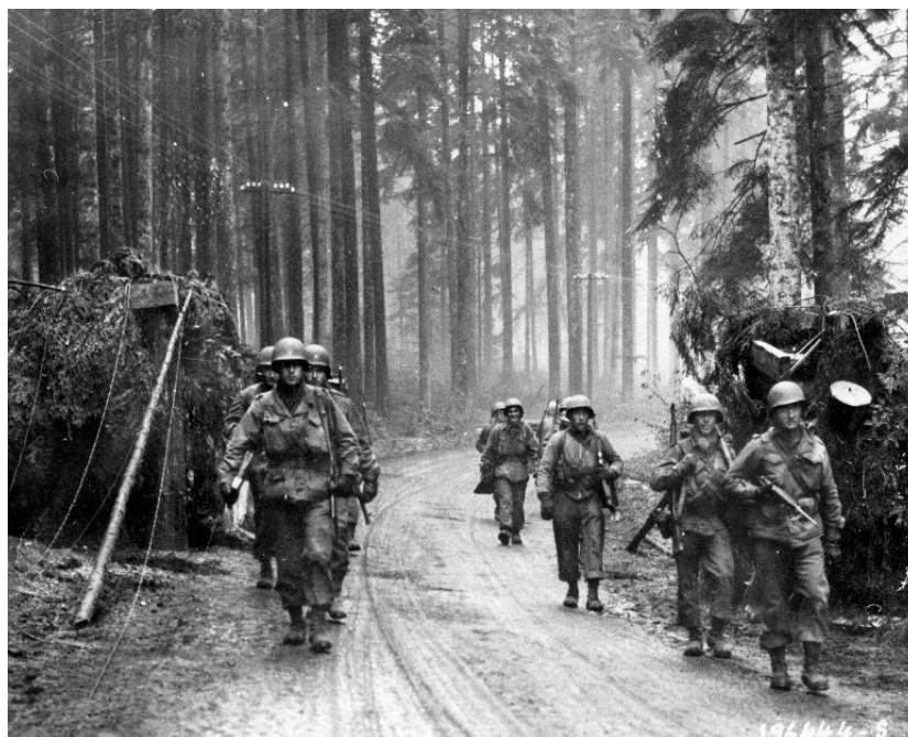
Солдаты 100-й Дивизии проходят через расчищенный завал, оставленный немцами на дороге. 19 ноября 1944 года

Становилось довольно очевидно, что мы вступили в полосу обороны немцев и углубились далеко за передовую линию. Позднее мы узнали, что зашли за нее аж на 17 миль! Вскоре мы заняли городок Сен-Блез/Saint-Blaise. Оставшуюся часть ночи и весь следующий день мы брали в плен все больше и больше немцев, которые входили в него, не зная, что он захвачен нами. Стрельбы было мало или вообще обходилось без нее, так как мы сидели в домах с оружием наготове и просто давали немцам возможность подойти к нам вплотную. Как только они сдавались, мы загоняли их в подвал и ждали следующих.