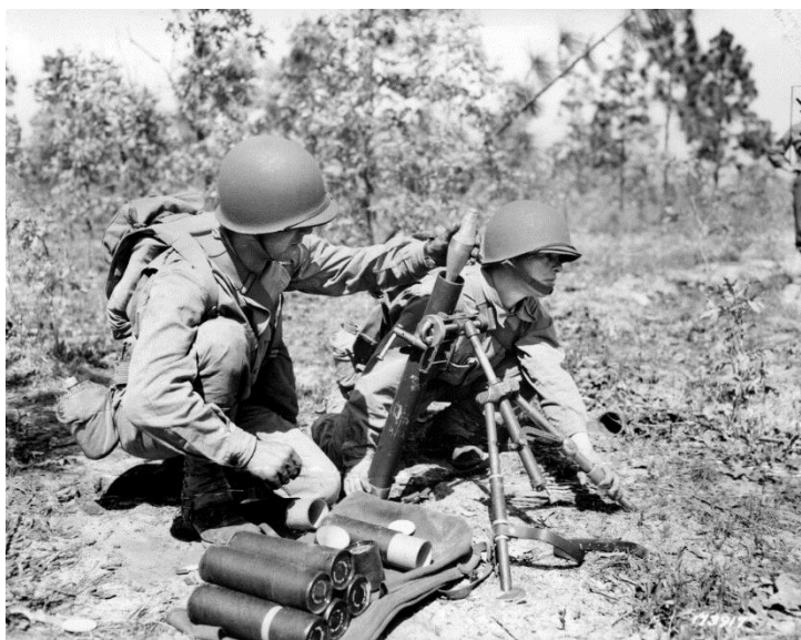
Двое военнослужащих 397-го Пехотного Полка 100-й Дивизии вдут огонь из 60-мм миномета типа M2 в период обучения в лагере Fort Jackson, штат Южная Каролина, в апреле 1943 года

Наше судно было самым крупным – почти 1 000 футов в длину и водоизмещением 26 000 тонн.»