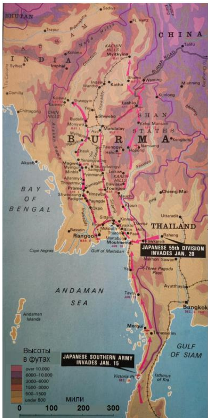
Карта боевых действий в Бирме в первой половине 1942 года