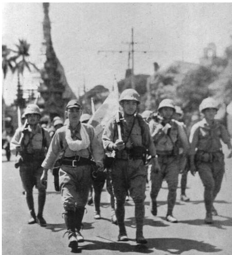
Японцы вступают в Рангун...

Генерал Слим был назначен командующим так называемым Бирманским Корпусом , состоявшим из 7-й Бронетанковой Бригады, 1-й Бирманской Дивизии, 17-й Индийской Дивизии, (которая теперь включала в себя 63-ю Индийскую Бригаду) и большого числа армейских и транспортных частей и частей снабжения. Это давало генералу Александеру возможность руководить операциями британских и китайских войск как единой группировкой.