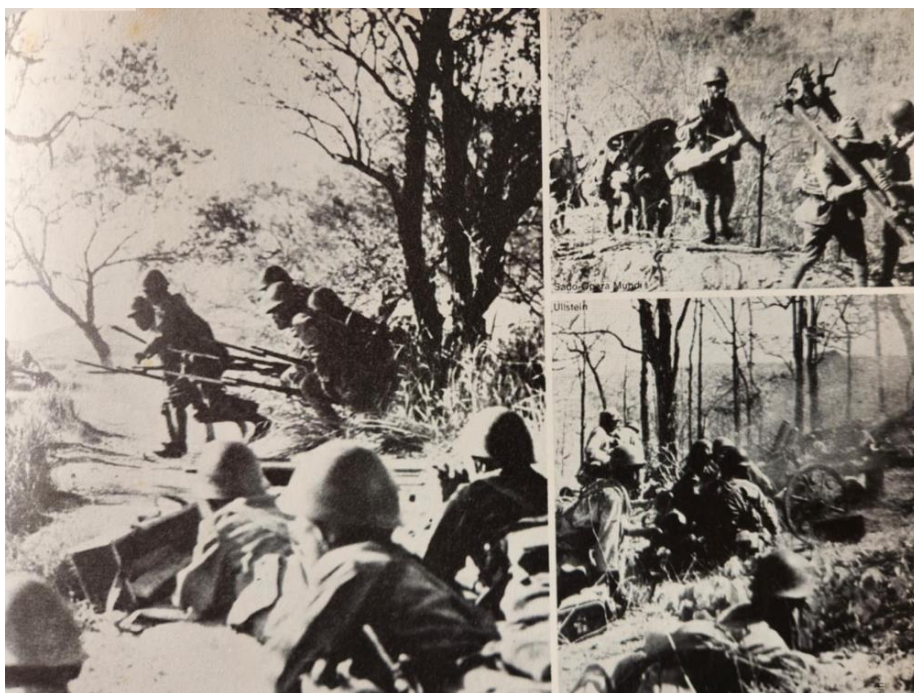
Слева: японцы поднимаются в атаку при поддержке пулеметного огня, справа сверху: японские солдаты несут 70-мм гаубицу в разобранном состоянии, справа внизу – 70-мм гаубицы в бою

Наступивший сезон дождей стал для Бирманского Корпуса и облегчением, и испытанием. Дожди принесли людям сильный дискомфорт и сделали дороги куда более труднопроходимыми, но они же полностью остановили японских преследователей. Вспоминает Слим: «В последний день отступления я наблюдал за арьергардом, марширующим в Индию. Все они, британцы, индийцы и гуркхи, были истощены и стали выглядеть словно огородные пугала. Однако, тащась за уцелевшими офицерами ничтожно малыми группами, они несли на себе оружие и сохраняли дисциплину. Может, они и смотрелись пугалами, но было видно, что это солдаты.»