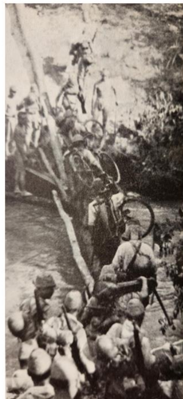
Слева: японцы продвигаются по грунтовой дороге, справа – японцы перебираются через ручей по импровизированной переправе...

Мощь наносимого японцами удара и скорость их продвижения снова застала нас врасплох, поскольку потеря Монивы превратила организованный и укладывающийся в график отход в поспешное бегство, которое легко могло обернуться катастрофой. Пока Бирманский Корпус с трудом откатывался к индийской границе, остатки 5-й Китайской Армии отступили на север от Швебо. Штаб 5-й Армии вместе с частями 22-й и 96-й дивизий, преодолевая большие лишения, отошел по долине реки Хукаванг/Hukawang. Генерал Стилвелл оставался в Швебо до 1 мая, после чего был вынужден совершить пеший переход в Чиндуин/Chindwin и далее через горы в Импхал. 15 мая он и его отряд добрались до Ассама/Assam.