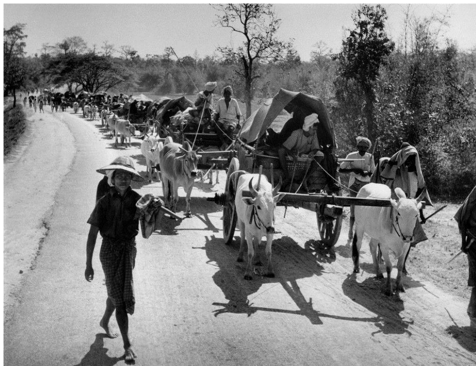
Индийские беженцы покидают Бирму...

23 декабря имел место первый авианалет на Рангун, второй произошел в день Рождества. Истребители RAF и Летающие Тигры , потеряв 10 и 2 самолета соответственно, уничтожили около 50 бомбардировщиков и истребителей противника, но не смогли предотвратить прорыв японцев к городу. Эффект, который бомбардировка произвела на индийских рабочих, был катастрофическим, и после этого становилось все труднее управлять работой порта и поддерживать жизнь в городе.