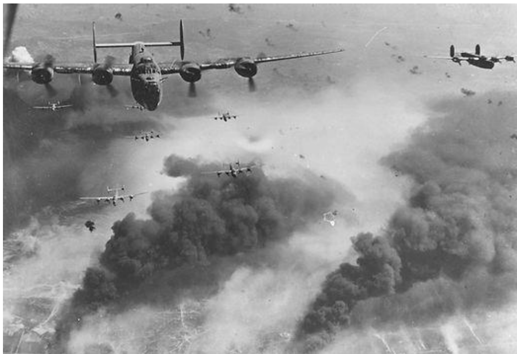
Либерейторы над Плоешти...