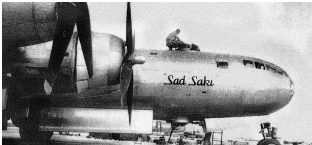
B-29, на котором летал Бен Куроки