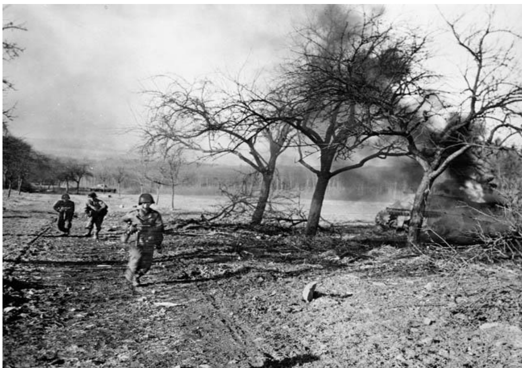
Американцы продвигаются вперед под огнем в направлении реки Саар

становилась длиннее, чем могло показаться необходимым на первый взгляд, кроме того, растянулся отрезок времени, на протяжении которого батальон мог быть замечен немцами.