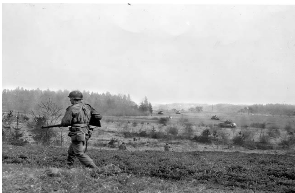
Американские пехотинцы и взвод Шерманов/Sherman Боевого Отряда В 10-й Танковой Дивизии продвигаются вперед