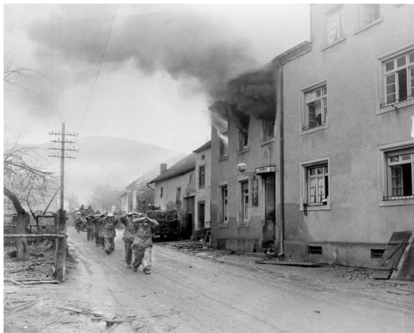
27 февраля. Пленные немцы маршируют через Ирш...

Для рейнджеров это случилось в поздние часы 26 февраля, когда немцы поняли, что их главный коммуникационный путь перерезала значительная по силам группа противника, и решили уничтожить ее.