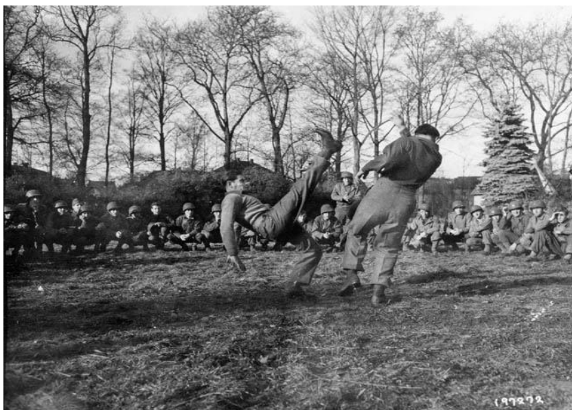
Британский коммандо демонстрирует американцам приемы рукопашного боя в лагере Ахнакарри

Рейнджеры впервые вступили в бой в составе Дьеппского десанта 1 августа 1942 года, где они были представлены шестью офицерами и 45 прочими чинами. Двое офицеров и четверо рейнджеров были убиты, четверо попали в плен. Два месяца спустя, в ноябре 1942 года, 1-й Батальон вступил в бой под алжирским городом Арзев. Позднее рейнджеры проведут успешный рейд на позиции итальянцев на станции Де Сенед/de Sened в Тунисе. В ходе Кассеринского сражения они обороняли деревню Бу Шебка/Bou Chebka и осуществляли боевое патрулирование. Позднее они приняли участие в штурме вражеских позиций в районе города Гафса/Gafsa, где им удалось просочиться через оборонительные линии противника и нанести ему удар с тыла.