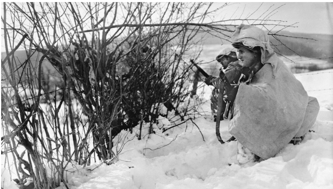
Двое солдат 2-й Пехотной Дивизии на передовой позиции. Бельгия, 1944 год

Разведчики также разглядели на противоположной стороне просеки 24 ДОТа с перекрывающимися секторами обстрела. Некоторые были не более чем в 20-30 ярдах друг от друга и превосходно замаскированы. От одного к другому проходили зигзагообразные траншеи, в то время как в дополнительных окопах располагались минометные и пулеметные точки. Четыре ДОТа и шесть бункеров были сконцентрированы собственно у перекрестка, где дом лесника и таможня также представляли собой солидные укрепления. Глубины полосе обороны добавляли четыре пристрелянные артиллерийские батареи.