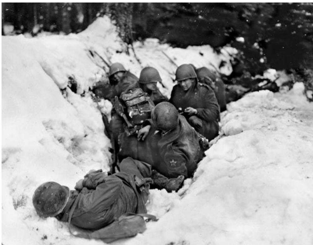
Вторая половина дня 14 декабря 1944 года - солдаты 9-го Полка 2-й Дивизии укрываются в канаве...