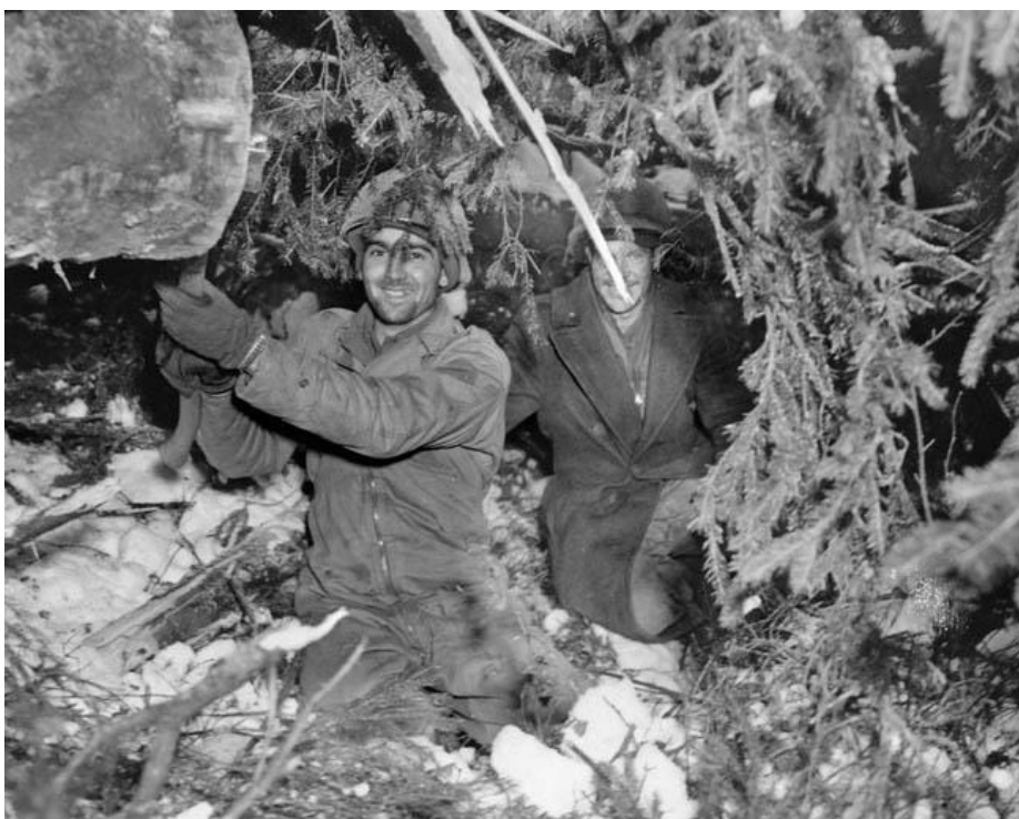
Двое солдат 28-го Полка 2-й Дивизии улыбаются на камеру и одновременно готовят позицию для базуки, закрепляясь на оборонительной позиции у перекрестка Wahlersheid