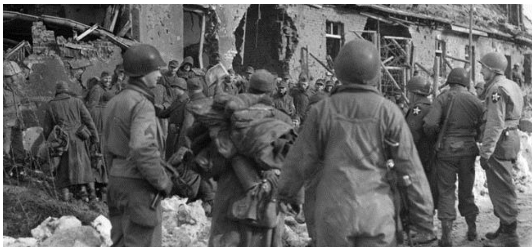
Солдаты 164-го и 183-го полков загоняют пленных немцев в дом лесника близ перекрестка Валершайд. Солдаты 9-го Полка 2-й Дивизии берут их под охрану...

которые выбрались из одного из ДОТов справа от них. В хаотичной схватке американцы затащили в траншею одного из немцев, когда огонь стих. На ломаном английском он убедил Дюгана в том, что, если его отпустят, он сможет уговорить своих товарищей сдаться в плен. Взвесив все за и против, Дюган неохотно дал немцу уйти.