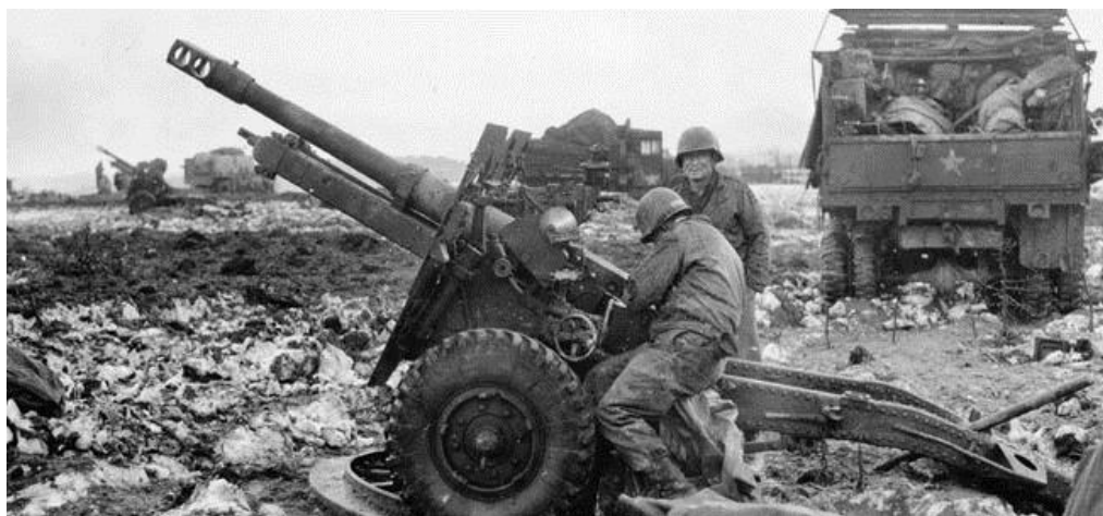
Артиллеристы 2-й Пехотной Дивизии ведут огонь из 25-фунтовой пушки британского производства по противнику, обороняющему перекресток Валершайд