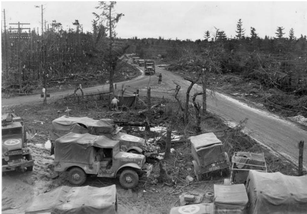
Перекресток Валершайд 13 февраля 1945 года, после того как он был отбит у немцев