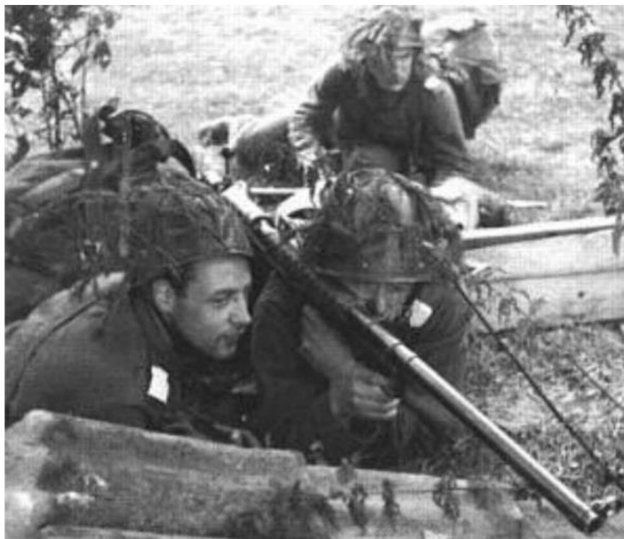
Шведские солдаты на учениях, 1942 год