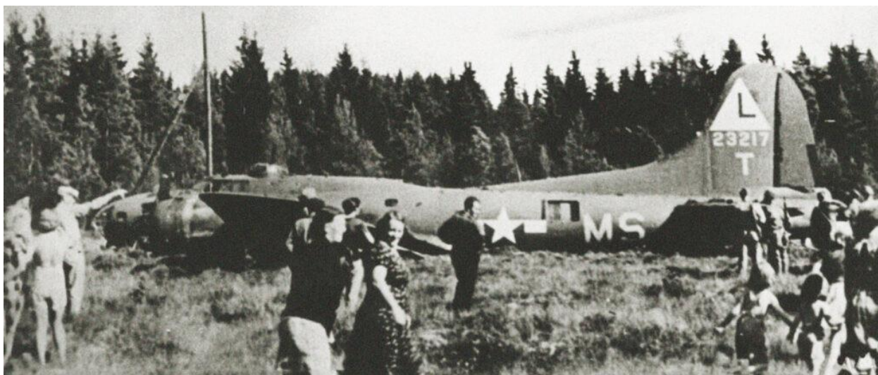
Шведы разглядывают первый американский самолет В-17 (Georgia Rebel), совершивший аварийную посадку на территории их страны 24 июля 1943 года после бомбардировки объектов в Норвегии

Германию. Союзники пытались перекупить поставки, чтобы лишить Германию этого ресурса, однако SKF увеличила производство и тем самым сорвала этот план. В мае американские и британские представители прибыли в Стокгольм, чтобы убедить компанию прекратить экспорт в Германию. Переговоры длились с 13 мая по 8 июня. В этот период поставки в Германию были временно приостановлены. Компания неохотно шла на уступки, но союзники оказали серьёзное давление. Высадка союзников в Нормандии, произошедшая во время переговоров, также повлияла на позицию шведов. Союзники закупили подшипники примерно на 6 млн долларов, а SKF согласилась существенно сократить экспорт в Германию. Компания придерживалась этого соглашения, постепенно снижая поставки, пока 19 октября полностью не прекратила экспорт в Германию.