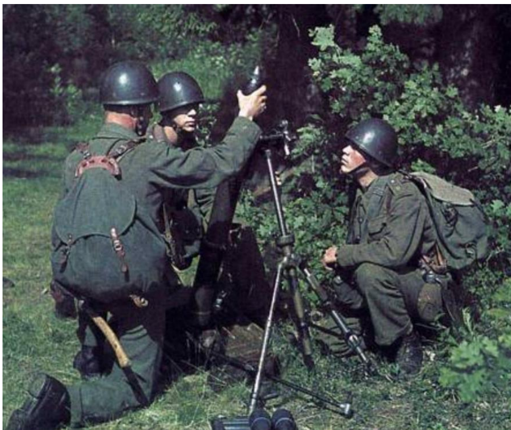
Шведские солдаты на учениях, 1943 год

медикаменты - поставлялись как во время войны, так и после неё таким странам, как Норвегия, Дания и Нидерланды.