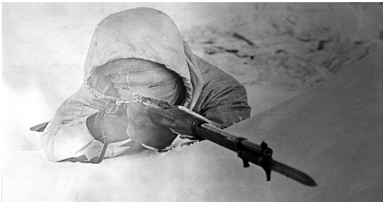
Шведский доброволец на Советско-Финском фронте. Февраль 1940 года

возможность установить контроль над шведскими рудными районами и прекратить поставки железной руды в Германию. Уже в середине декабря британское правительство рассматривало план высадки экспедиционного корпуса в Нарвике с целью поддержки финнов и захвата северных рудников. Уинстон Черчилль, занимавший тогда пост первого лорда Адмиралтейства, активно поддерживал этот план и даже предлагал расширить его, включив минирование норвежских вод. Он писал: «Если Нарвик станет своего рода союзной базой для снабжения финнов, будет нетрудно помешать германским судам загружать там руду и безопасно следовать вдоль шхерного пути в Германию».