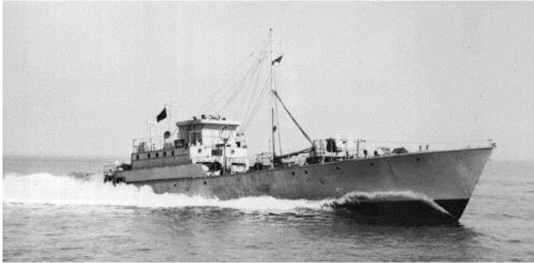
Блокадопрорыватель Gay Wiking – один из нескольких катеров, изначально построенных в качестве торпедных, но использовавшихся британцами для доставки подшипников из Швеции

С 1943 года и до конца войны Швеция также всё более открыто противостояла Гитлеру, оказывая помощь другим скандинавским странам. Швеция на протяжении всей войны сохраняла дипломатические отношения с норвежским правительством в изгнании (в Лондоне) и позволяла ему иметь представительство в Стокгольме. В ноябре 1943 года в Университете Осло вспыхнули антигерманские беспорядки, после чего ряд студенческих лидеров был депортирован в Германию. Швеция решительно протестовала, и в следующем году часть студентов была возвращена на родину. Одним из наиболее смелых шагов шведского правительства стала организация весной 1943 года учебного центра для норвежского полицейского формирования, создаваемого из беженцев в Швеции. Эта структура должна была стать ядром сил, готовых вернуться в Норвегию и восстановить порядок после ухода немцев. Сначала она насчитывала около 1 500 человек и считалась гражданской, хотя обучение включало использование газа, дымовых шашек и взрывчатки, подготовку к диверсиям и противодействию диверсиям. Позже численность выросла, подготовка приобрела более военный характер, а занятия проводились под руководством офицеров шведской армии. К концу 1944 года этот резерв насчитывал уже 12 000 человек, обученных и оснащённых Швецией, но подчинённых норвежскому правительству в Лондоне.