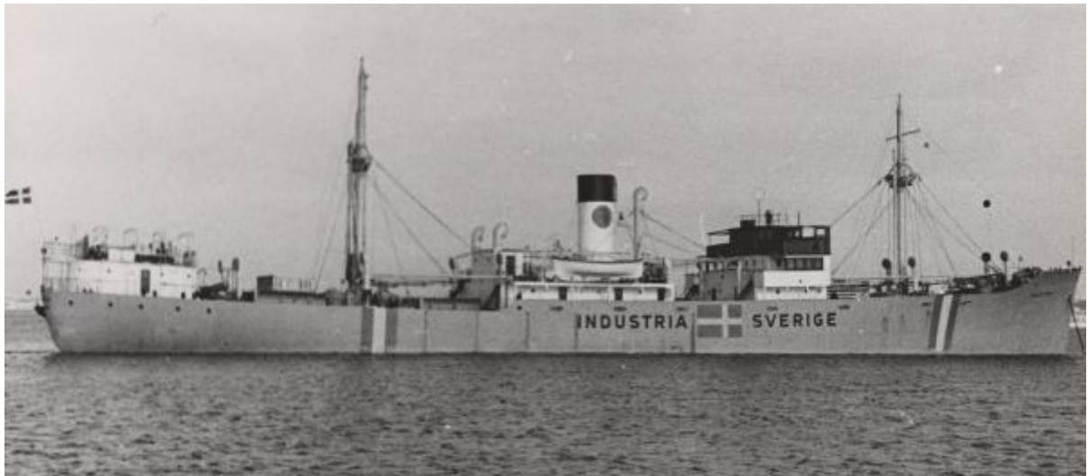
Шведское грузовое судно Industria, совершавшее рейс между Филадельфией и Рио-де-Жанейро и потопленное немецкой подводной лодкой U-518 25 марта 1943 года

В ответ Германия прибегла к репрессиям: в августе 1943 года были обстреляны и потоплены два шведских рыболовных судна, а также сбиты несколько шведских курьерских самолётов. Осенью 1943 года движение по гётеборгскому маршруту было временно прекращено — Германия отказалась гарантировать безопасность шведских судов в зоне блокады. Эти действия вызвали сильное недовольство в Швеции, чем воспользовались союзники, стремясь ослабить её экономические связи с Германией. 23 сентября 1943 года Швеция подписала соглашение с Великобританией и США, которое предусматривало значительное сокращение экспорта в Германию. Швеция обязалась: