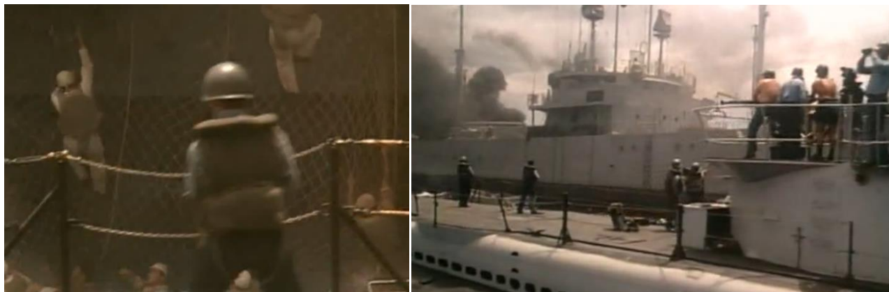
Сцены из сериала War and Remembrance (1978 г., ч. 7) – американские подводники расстреливают японских солдат...

Как обычно, имеется несколько версий случившегося. Некоторые свидетели говорили, что Мортон приказал открыть огонь в ответ на ружейную стрельбу с борта поврежденного транспорта, другие говорили, что он приказал стрелять только по шлюпкам, чтобы вынудить японцев покинуть их. В довершение всего, американцы не обратили внимания на то, что большая часть людей на борту транспорта была представлена военнопленными индийцами. Из 1126 человек, первоначально находившихся на борту, было убито 195 индийцев и 87 японцев, включая погибших при взрыве торпеды. Так или иначе, вода стала красной от крови и в дополнение ко всему привлекла множество акул... Мортон не стал делать секрета из случившегося, но это не помешало командованию наградить его за этот поход Военно-Морским Крестом.