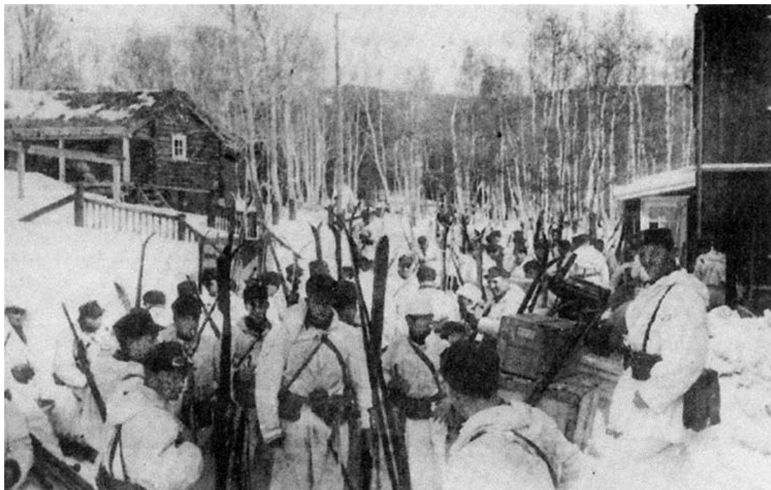
6-я Рота 11-го Пехотного Полка норвежцев готовится к продвижению в район высадки немецких парашютистов близ Домбаса

Немецкие летчики столкнулись с трудностями в поисках подходящих участков сброса десантников в районе Домбаса, так как на тот момент под ними было лишь несколько разрывов в облачности. При этом они оказались под сильным огнем противника с земли. Более того, самолеты должны были, не теряя времени, возвращаться в Осло из-за недостатка горючего в баках и приближающейся темноты. Согласно норвежским источникам, высадка произошла вскоре после 18.00, тогда как немецкие источники утверждают, что она продолжалась от 19.45 до 22.00. Парашютисты высадились на различные участки местности, вытянувшейся на более чем 20 миль (30 км) от Лоры/Lora (16 миль/25 км к западу от Домбаса) до Фолкстуга/Folkstua (5 миль/8 км к северо-востоку от него). Ни один из взводов не сумел полностью собраться после приземления. Лейтенант Шмидт и 12 парашютистов из его самолета высадились в 3.5 милях к югу от Домбаса в полосе, идущей вдоль железной и шоссейной дорог, часть контейнеров с оружием после этого найти так и не удалось.