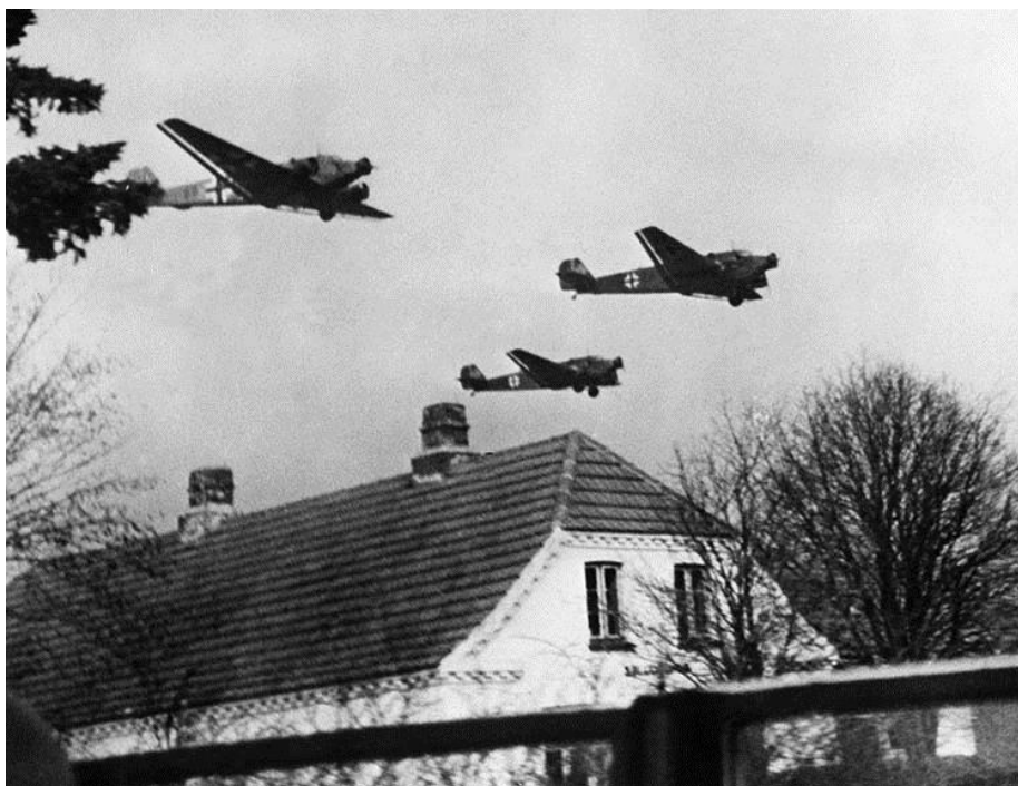
Немецкие транспортные самолеты в небе Дании. 10 апреля 1940 года