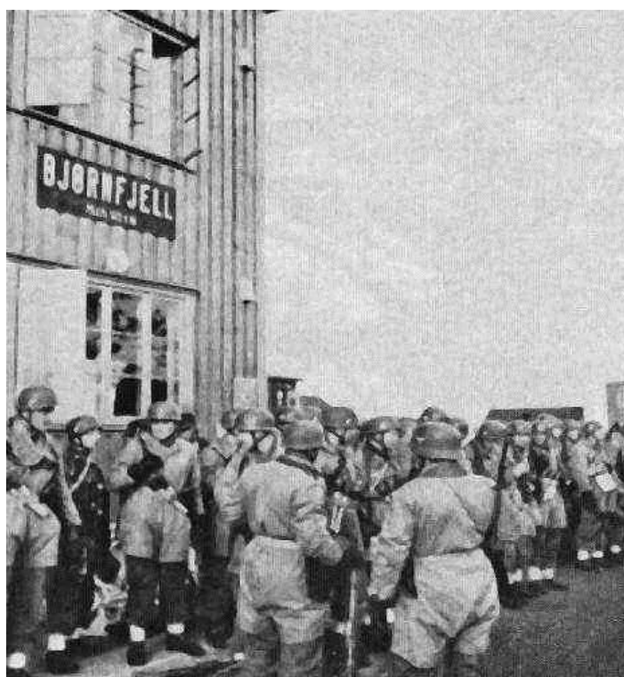
Парашютисты в Бьорнефьелле. Обратите внимание на то, что на головах у некоторых стандартные каски Люфтваффе

Тем временем офицеры Фалькенхорста провели ускоренный и сокращенный курс обучения частей горных стрелков прыжкам с парашютом. Первая группа из их состава – 65 человек из 2-й Роты 137-го Горнострелкового Полка десантировалась с воздуха на участке, прилегающем к деревне Бьорнефьелл/Bjørnefjell и шведской границе, где с 23 мая располагался штаб Дитля. Немцы ожидали, что потери в ходе этой высадки составят 10%, но лишь двое солдат получили небольшие травмы. На следующий день была высажена еще одна группа горных стрелков – на этот раз это были 55 человек из 1-й Роты 137-го Полка. Еще 54 человека из 1-й Роты высадились 25 мая, как и 44 человека из 2-й Роты 138-го Полка. Их спешно перебросили в Нарвик до 28 мая, до того, как высадившиеся с моря батальоны союзников и норвежцев выбили немцев из города.