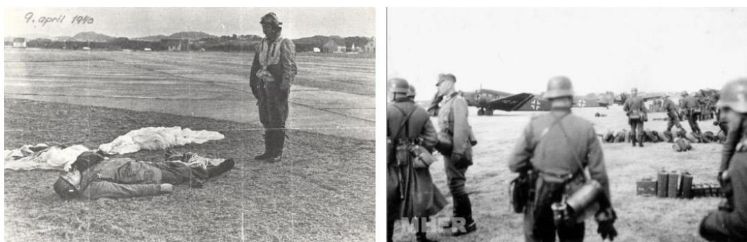
Слева, аэродром Sola. Немецкий парашютист у трупа погибшего товарища; справа – немцы после взятия аэродрома Sola под контроль

Тем временем, вскоре после 9 утра, началась третья стадия операции. Приблизительно 200 самолетов за день перебросили на аэродром два пехотных батальона. Город Ставангер был занят немцами без боя во второй половине дня.