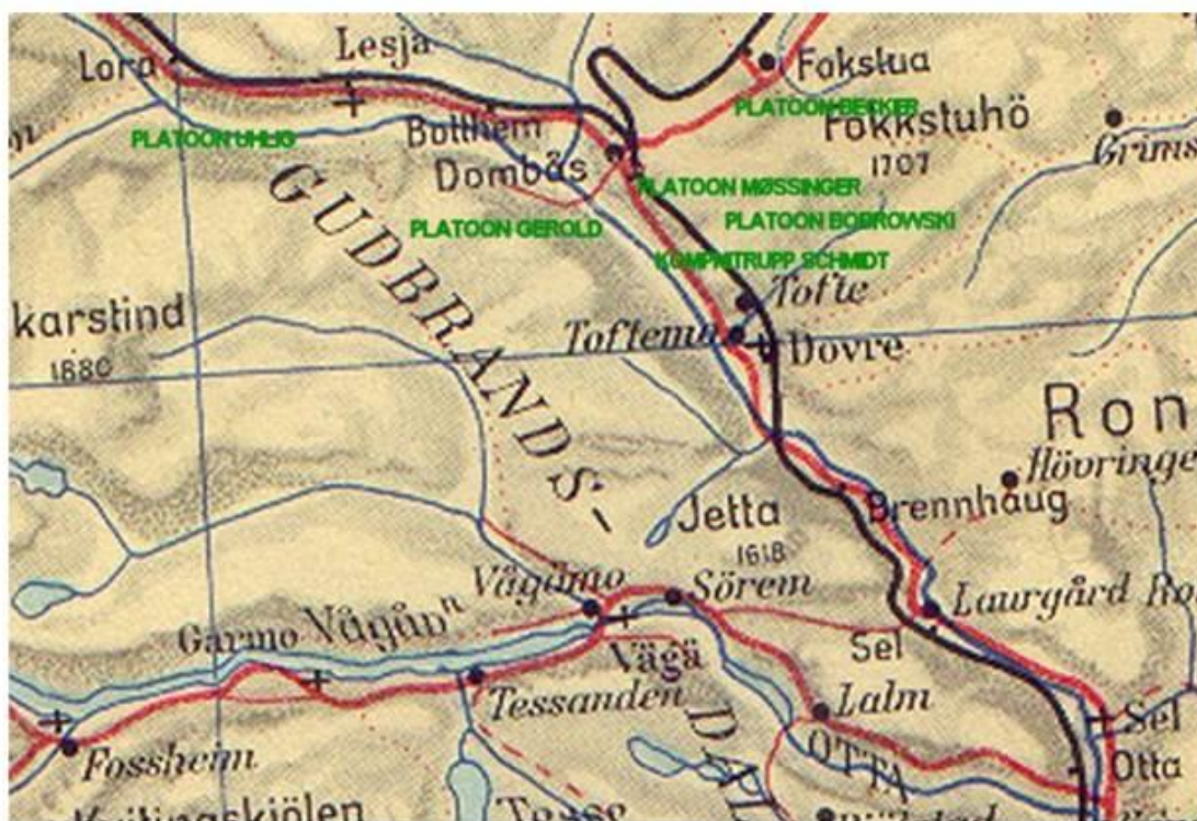
Участки высадки взводов роты оберлейтенанта Шмидта