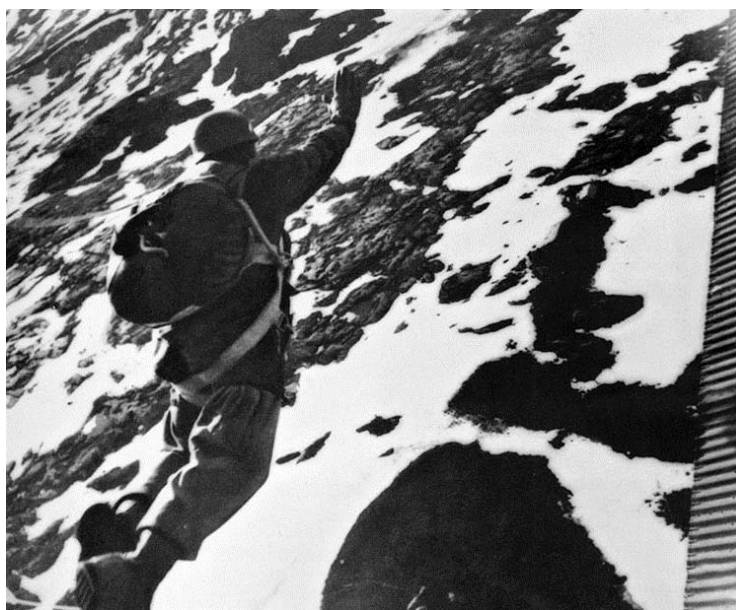
Немецкий парашютист покидает самолет. 9 апреля 1940 года

Приблизившиеся к аэродрому немецкие самолеты попали под огонь норвежских пулеметов, но из-за малого калибра последних эффект от этого был незначительным. Это были пулеметы с водяным охлаждением: они быстро перегревались, что вызывало их заклинивание, после которого оставалось вести огонь только одиночными выстрелами. Бомбардировка, обстрелы с воздуха и отсутствие возможности нанести ущерб немецким самолетам быстро подорвали боевой дух защитников аэродрома и вынудили их покинуть боевые позиции.