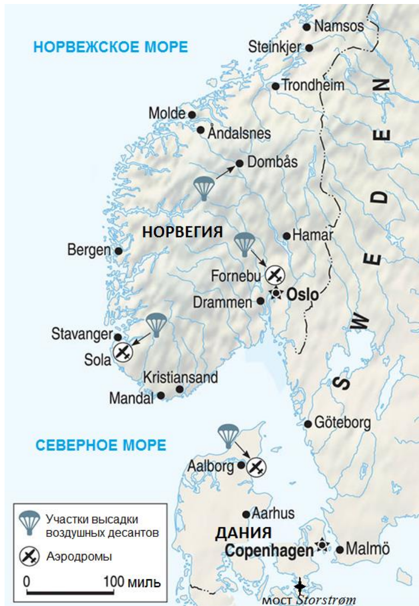
Участки высадки немецких воздушных десантов в Дании и южной Норвегии

Остальная часть 4-й Роты должна была захватить мост Storstrøm , достигающий в длину 3 200 метров и соединяющий острова Фальстер/Falster и Зеландия/Sjælland, и удерживать его до прибытия боевой группы (БГ) Buck (старший офицер – командир 305-го Пехотного Полка полковник Альберт Бак, 1895 - погиб под Новороссийском 06.09.1942). Мост состоял из двух пролетов, более длинный из них соединял острова Маснедо/Masnedø и Фальстер. Значительно более короткий пролет располагался между Маснедо и Зеландией. На острове Маснедо находился старый форт, который немцы считали действующим укреплением и планировали захватить, чтобы взять под контроль мост.