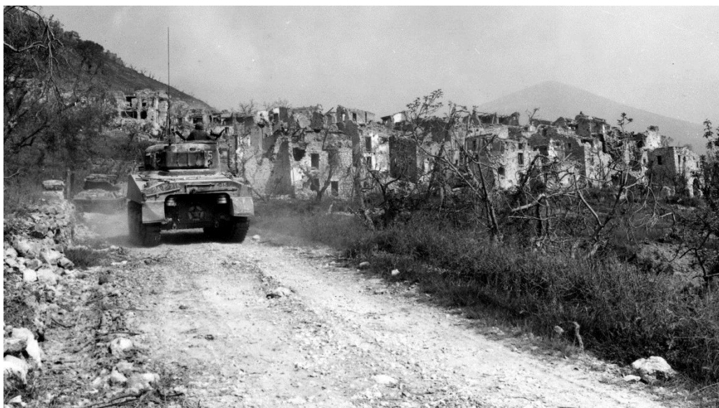
Танки союзников продвигаются через руины города Кастельфорте/Castelforte (15 миль к югу от Кассино). 13 мая 1944 года

В секторе американского 2-го Корпуса продвижение было также незначительным. Даже с учетом занятия британцами плацдарма на северном берегу Рапидо первые 24 часа операции Diadem были малорезультативными.