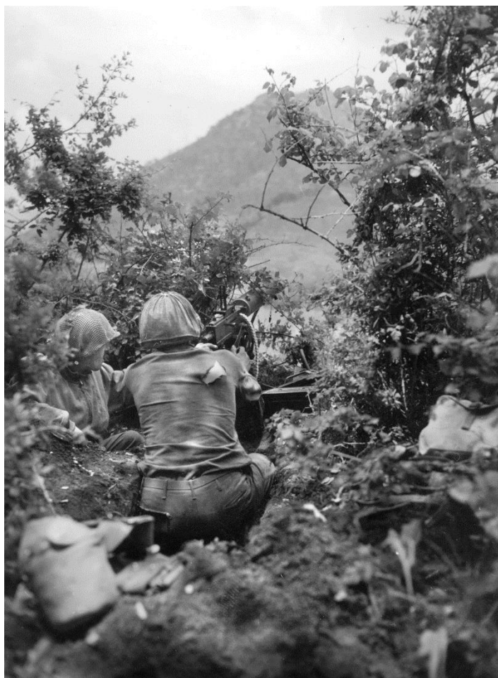
Американцы ведут огонь из пулемета калибра .30 по немецкому патрулю, замеченному на холме к западу от города Фонди/Fondi (западный фланг Линии Густава). 24 мая 1944 года