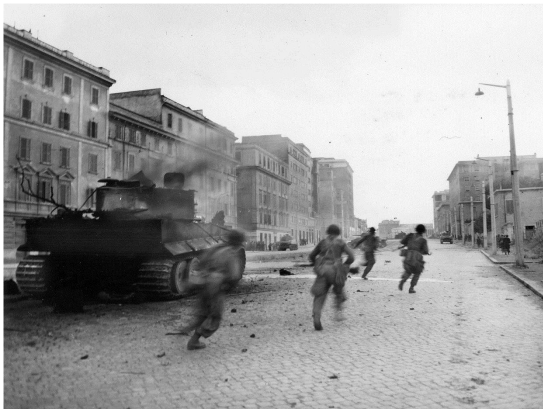
Американские солдаты, вступившие в Рим, пробегают мимо горящего немецкого танка. На заднем плане видны американские танки, оказывающий поддержку пехоте, зачищающей дома...

Кларк на тот момент был больше всего озабочен тем, как захватить в целости и сохранности мосты через Тибр, воспользовавшись которыми наступающие дивизии могли бы приступить к преследованию отступающих немцев севернее Рима. Не зная о том, что немцы получили инструкцию не взрывать мосты, он приказал мобильным частям побыстрее проникнуть в город и захватить их. Части 1-го Отряда Специального Назначения и 3-й и 88-й дивизий 2-го Корпуса вступили в Рим 4 июня. Несколько собранных на скорую руку боевых групп столкнулись с сопротивлением, попав под огонь замаскированных противотанковых пушек и даже нескольких панцеров , но к 23.00 все мосты через Тибр в секторе 2-го Корпуса были взяты под контроль американцами.