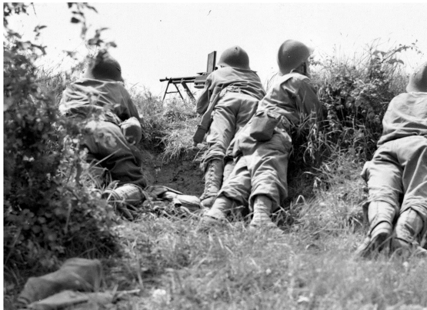
Алжирские солдаты Французского Экспедиционного Корпуса ведут огонь из легкого пулемета Model 1924 M29 по позициям немцев в районе Кастельнуово/Castelnuovo. 16 мая 1944 года