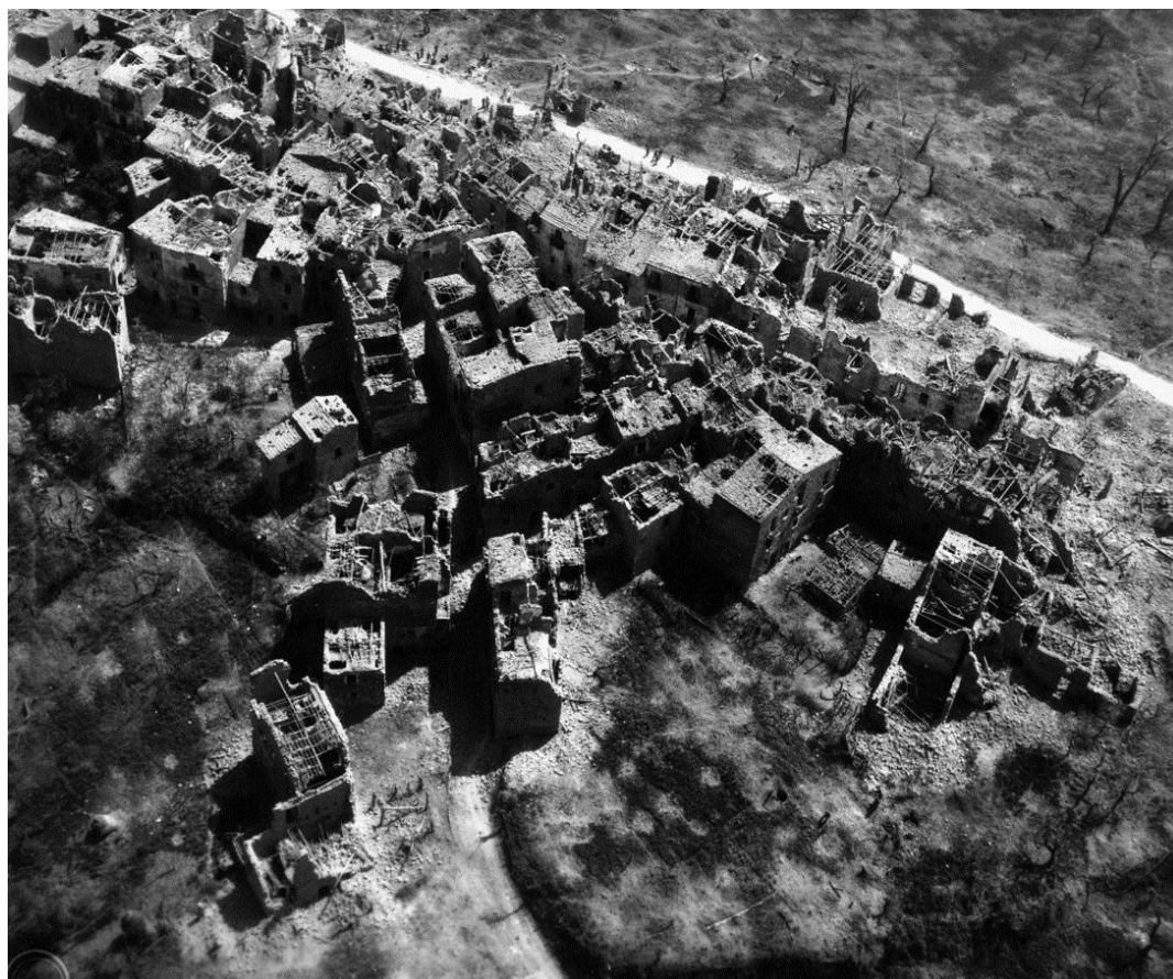
Городок Санта Мария Инфанте была разрушена в ходе ожесточенного боя 17 мая 1944 года

Тем временем французы начали продвижение в направлении долины реки Лири. В воздухе господствовали самолеты союзников, непрерывно атакующие линии коммуникаций противника и этим серьезно препятствовавшие попыткам немцев стабилизировать оборону. Город Санта Мария Инфанте был занят американцами во второй половине дня 14 мая.