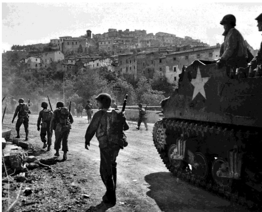
САУ М7, прозванная Priest/Священник, и американские солдаты на шоссе близ города Кори/Cori к югу от Рима

Огонь американской артиллерии, корректируемый расположившимися на горе Артемизо наблюдателями, превратил ведущий к Вальмонтоне отрезок Шоссе 6 буквально в тир. Немцы были вынуждены оставить этот город, который был занят американской 3-й Дивизией 2 июня. Кессельринг ранее намеревался преградить путь союзникам силами 14-го Танкового Корпуса, но невозможность дальнейшего удержания Вальмонтоне поставила под сомнение такую возможность. В ночь со 2 на 3 мая Фитингхоф приказал своей 10-й Армии оторваться от 8-й Армии, которая возобновила атаки в районе Фрозиноне. Кессельринг пришел к заключению, что Рим будет потерян. 10-я Армия начала отход в организованном порядке, опровергнув утверждения Кларка о том, что, заняв Вальмонтоне и перерезав Шоссе 6 , он загонит большое количество немецких войск в ловушку.