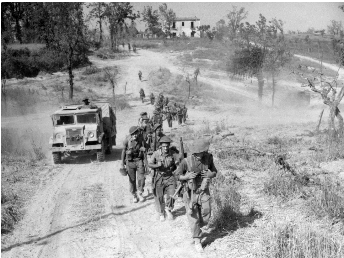
Канадские солдаты на марше к новым позициям в долине реки Лири

1-я Канадская Дивизия перешла в наступление (операция Chesterfield ) 23 мая, атаковав Понтекорво в 08.10. Они добились успеха после занявшего целый день ожесточенного боя в условиях дождя и тумана, прорвав Линию Гитлера к северо-востоку от города. Одновременно с этим немцы устояли под Аквино и продолжили удерживать Шоссе 6 , которое было наиболее удобной дорогой в долине реки Лири. Взяв в плен 540 немцев, канадцы под Понтекорво сами понесли ощутимые потери – более 500 человек убитыми и ранеными. 24 мая они навели мост через реку Мельфи/Melfi, подойдя на пять миль к своей общей с французами цели – городу Чепрано. 25-го мая немцы оставили Аквино.