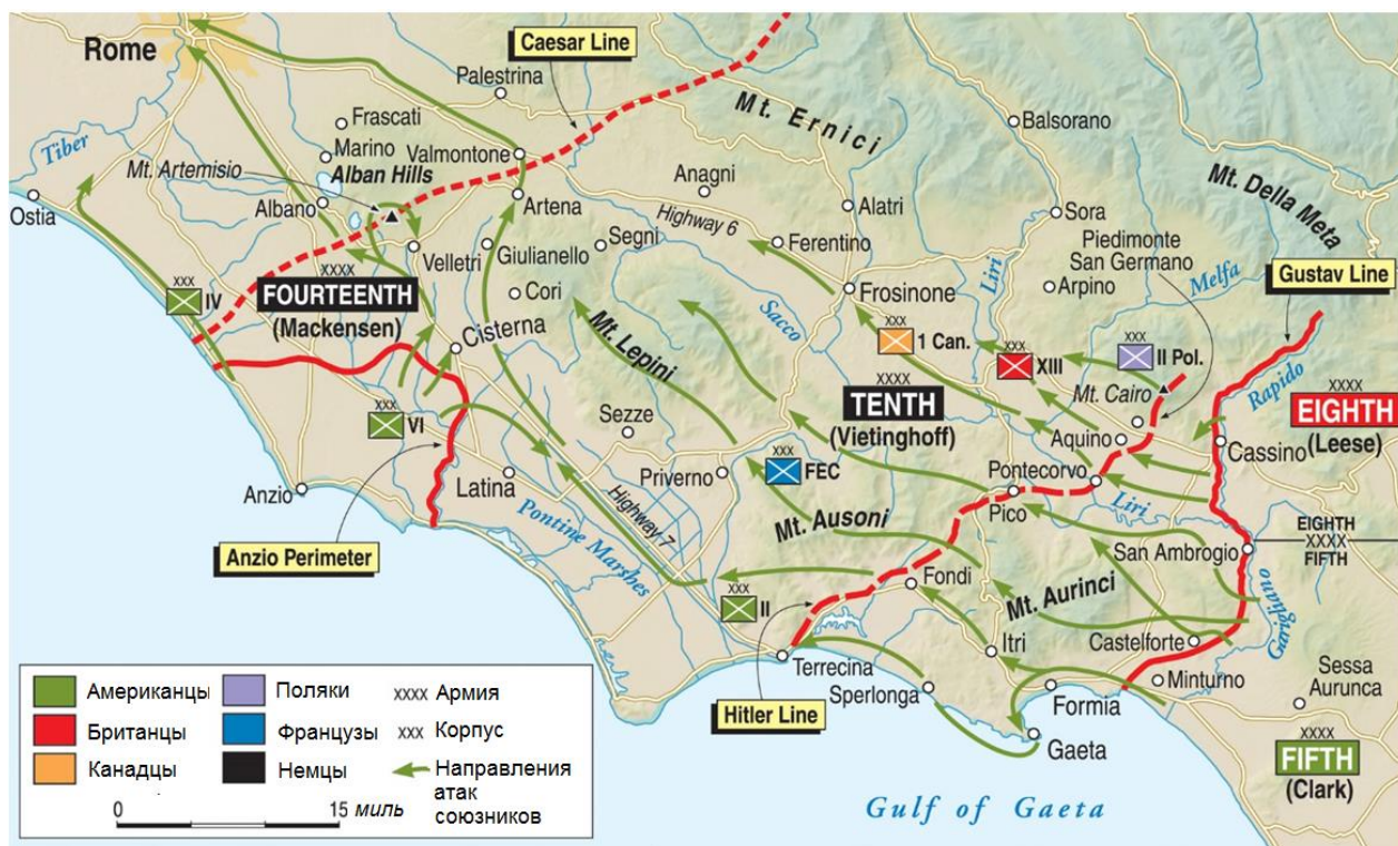
Операция Diadem - карта боевых действий

Немцы продолжали оказывать сопротивление, нанося союзникам потери и замедляя продвижение Кларка к Риму. Вечером 29 мая скоординированная атака танков и пехоты 5-й Армии привела к занятию американцами железнодорожной станции города Камполеоне/Campoleone, но бронетехника начала обгонять пехоту, оставляя позади неподдающимися многочисленными пулеметными гнезда и очаги сопротивления, уничтожение которых легло на плечи последней. Продвинувшись вперед на ограниченное расстояние, 1-я Танковая Дивизия потеряла 21 человека убитым, 107 ранеными и пятерых пропавшими без вести. 37 танков подорвались на минах и были подбиты противотанковыми пушками и группами солдат, вооруженных панцерфаустами .