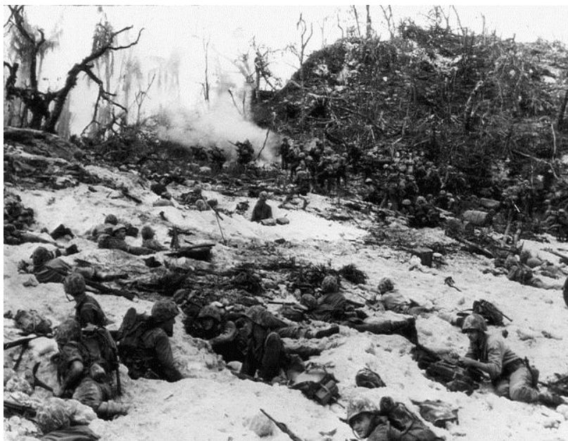
Морпехи из 1-й Дивизии окопываются под огнем противника