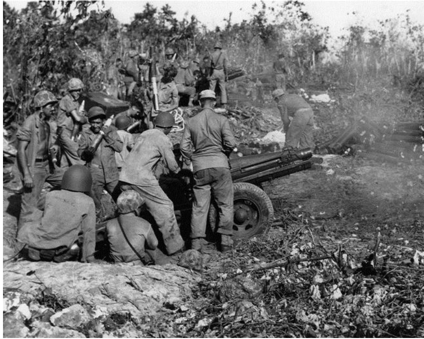
Артиллерия морпехов обстреливает позиции противника. Окраина взлетного поля на Пелелиу