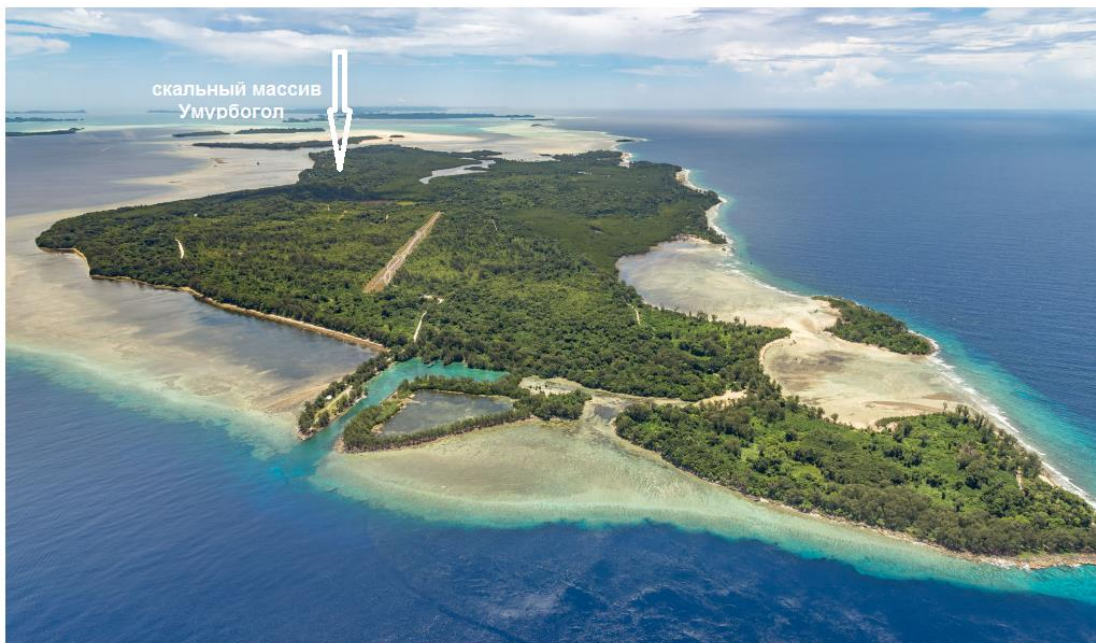
Современная фотография Пелелиу. Скальный выступ Умурбогол зарос джунглями. Вдоль побережья хорошо просматривается широкая полоса мелководья, занятая рифовыми постройками. Взлетная полоса использовалась малой авиацией до 2005 г.

находилось в процессе строительства, и его было невозможно расширить. Кроме того, остров отличался довольно контрастным рельефом, и оборонял его сильный гарнизон. Положение американцев осложнилось еще и тем, что 77-я Дивизия, которую планировали привлечь к операции, была переброшена на Гуам .