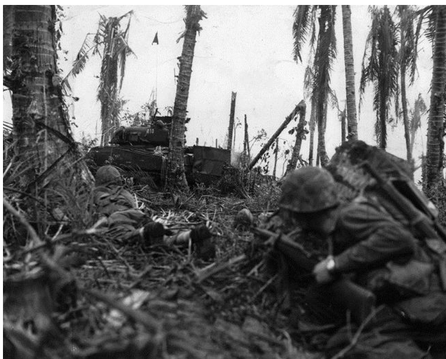
Морпехи ползком продвигаются в направлении японских позиций

Инуэ также откомандировал на остров генерал-майора Кендзио Мураи (Kenjiro Murai). Каким образом на острове оказался генерал, когда гарнизоном командовал полковник? Годы спустя после войны, когда подполковник Уэйт Уорден (Waite W. Worden), участник десанта на Пелелиу, спросил об этом Инуэ, когда тот уже находился в тюрьме ВМФ на Гуаме. Японец ответил, что Мураи был прислан на остров для «подстраховки», потому что это был важнейший объект и, сверх этого, потому что, что было необходимо «поддерживать баланс с флотскими». На острове также находился старший офицер ВМФ ( flag officer ) вице-адмирал Ито (Itou), то есть, Мураи был с ним равным по званию. Инуэ понимал, что армия и флот находится в состоянии серьезной вражды, и предполагал, что присутствие генерала станет буфером между моряками и Накагавой.