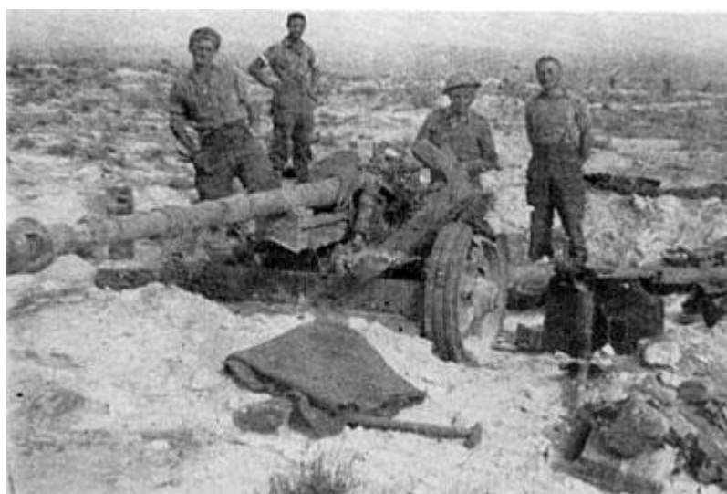
Новозеландцы из 24-го (Оклендского) Батальона рядом с захваченной с 75-мм немецкой пушкой