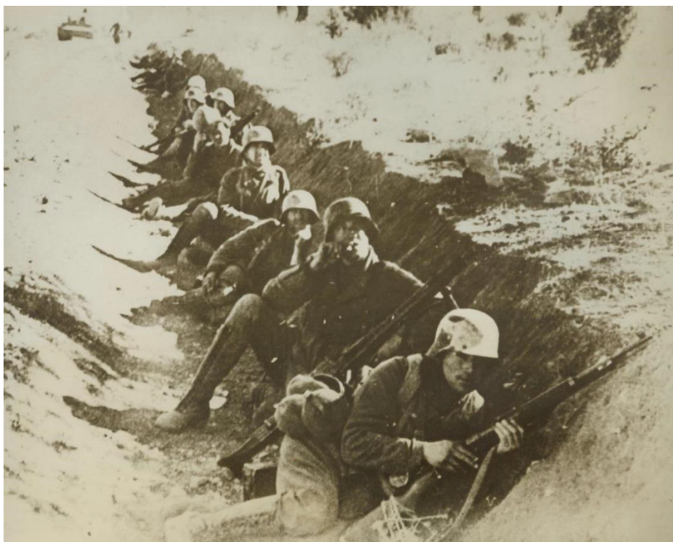
Немецкие солдаты на Линии Марет

После штормов и дождей вернулась ясная погода. В ночные часы 24-25 и 25-26 марта бомбардировщики союзников осуществили 322 боевых вылета в районе Эль-Хаммы, атаковав линии связи и транспортные пути противника. Одновременно с этим стратегическая авиация нанесла удар по порту Сусс и аэродрому близ Джебель Тебага Фатнасса к СЗ от Габеса.