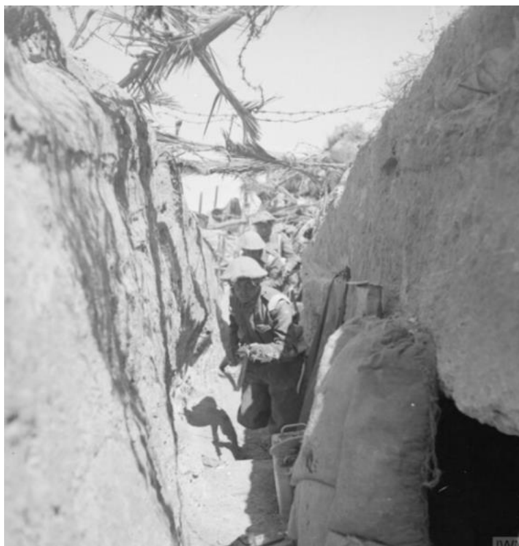
Британцы продвигаются по вражеской траншее на Линии Марет

Боевая Группа von Liebenstein оставила свои позиции на высотах до рассвета и перешла к мобильной обороне на рубеже между высотами Джебель Халуга и Эль-Хамма. Британская 1-я Танковая Дивизия была остановлена на северном направлении и попала под контрудар, нанесенный частями 15-й и 21-й танковых дивизий на своем восточном фланге. Такое положение сохранялось весь день 28 марта, в то время как в ночь с 26-го на 27-е последние немоторизованные части итальянского 20-Корпуса покинули прибрежный сектор фронта и переместились на позицию Chott . 21-й Корпус и БГ von Liebenstein прикрывали отход итальянцев, находясь на временной позиции Эль-Хамма – Габес 27 марта. В ночь с 28 на 29 марта британские танки, атакующие с юга, стали угрожать окружением БГ von Liebenstein , оттеснив на одном из флангов 15-ю Танковую Дивизию немцев и получив доступ к участку местности к востоку от высот Джебель Халуга. В ночное время находившиеся в обороне войска Оси , оказавшиеся под сильной бомбежкой с воздуха при лунном свете, отошли на рубеж севернее Эль-Хаммы и Габеса. Таким образом, сражение за Линию Марет было выиграно союзниками.