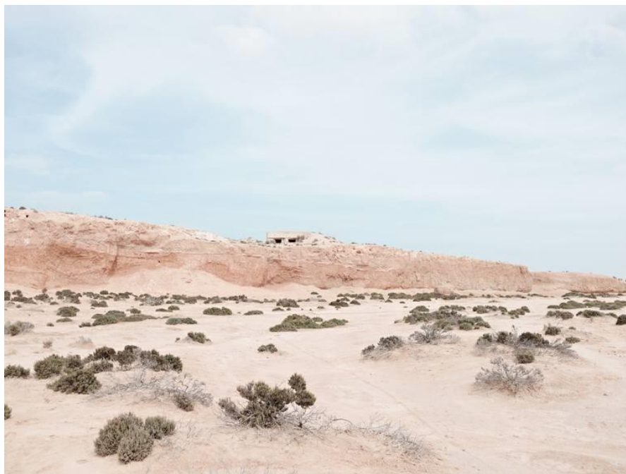
Вади Зигзау/Zigzaou. На переднем плане – сухое русло, заполненное зыбучими песками, над крутым бортом – ДОТ

другая на юг вдоль уступа в рельефе восточнее Шегуими. Каждый укрепленный пункт имел несколько бетонных блиндажей, пулеметные гнезда или укрытия. Перед линией обороны были уложены минные поля, создававшие полосу шириной от 4 до 6 миль, в целом параллельно вади Зигзау на стороне, открытой к Меденину, обходя по кругу деревню Аррам/Arram. На передовой линии, в секторе, протягивавшемся от высот Джебель Саикра/Djebel Saikra (302 м) до северо-западного окончания группы соленых озер, немецко-итальянское командование разместило артиллерийские орудия и пулеметы, рассчитывая удерживать здесь противника как можно дольше.