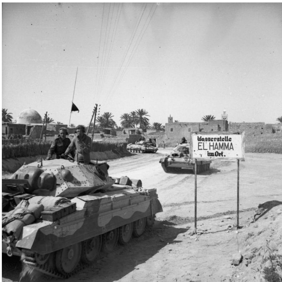
Крусейдеры/Crusaders 1-й Танковой Дивизии вступают в Эль-Хамму

29 марта Эль-Хамма и Габес были под контролем союзников. Вечером следующего дня их передовые части приблизились к позиции Chott . В ходе наступления британцы взяли около 7 000 пленных, что стало существенной потерей для Оси , и сильно потеснили противника на северо-востоке Туниса. Однако удерживавшие статичную линию обороны силы противника снова сумели избежать окружения и отступили по приказу своего командования.