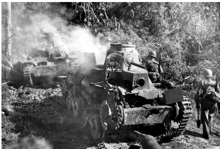
Горящие японские танки на одной из дорог Гуама