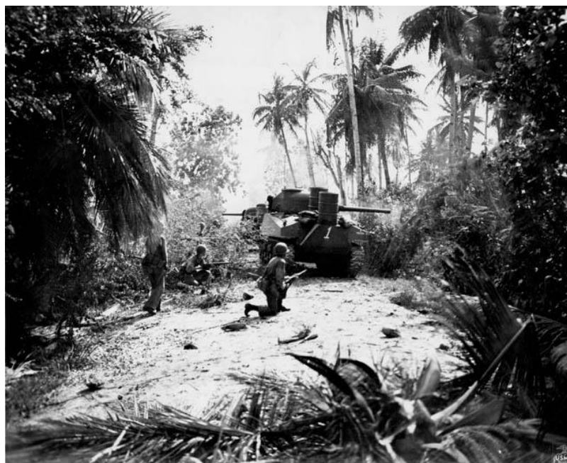
Укрываясь за танком, морпехи осторожно продвигаются через джунгли Гуама

позиции американцев японцы попытались вклиниться в стык между 3-м и 21-м Полками морпехов, но эта попытка была пресечена.