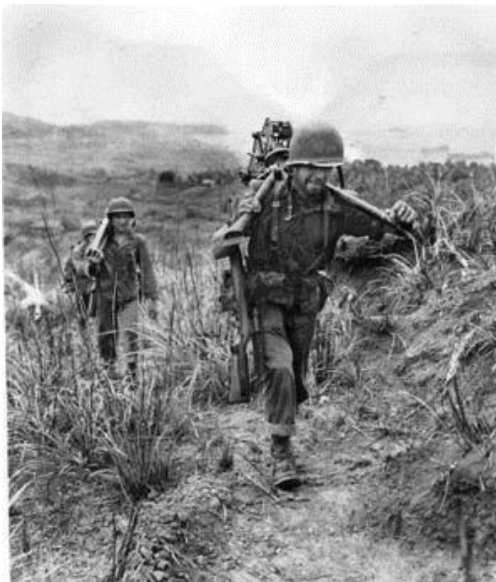
Гуам. Расчет американцев несет свой разобранный пулемет, поднимаясь вверх по склону. На переднем плане – солдат, несущий треногу. За ним идут его товарищи, у одного из которых на плече сам пулемет калибра .30.

Преимущества, которые давала атака в ночное время с господствующих высот в просветы между частями американцев, так и не предоставили им решающего преимущества: бронетехника японцев заблудилась в темноте и так и вступила в бой. Более того, поскольку японцы поднимали боевой дух большими порциями пива, саке и вина, алкоголь внес разброд в их действия. Так или иначе, к рассвету 90% японских офицеров, которые повели солдат в ночную атаку были убиты или смертельно ранены.