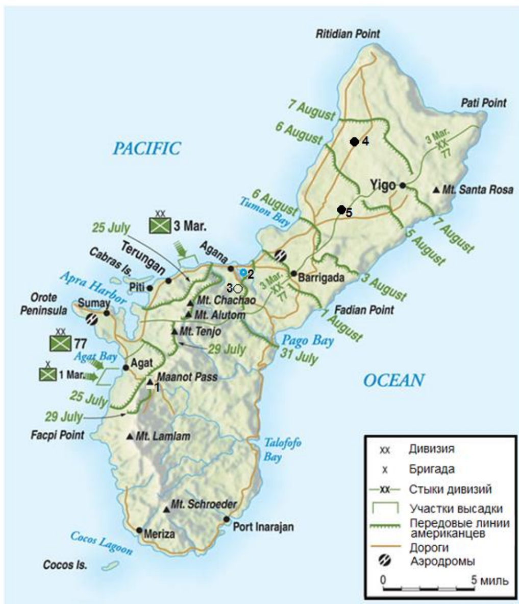
Схема продвижения американцев по острову Гуам в ходе его освобождения. Добавленные пункты и природные объекты: 1 – гора Алифан/Alifan; 2 – река Агана/Agana; 3 – плато Фонте/Fonte; 4 – Финегайан/Finegayan; 5 – Ипапао/Ирапао;

Основная атака морпехов нацеливалась на участки пляжа протяженностью 2 000 ярдов между пунктами Асан/Asan Point и Аделап/Adelup Point. 3-й Полк должен был высадиться на пляже Red 1 , 21-й – на пляже Green в центре, 9-й – на пляже Blue . Южнее полуострова Ороте 4-й Полк морпехов должен был высадиться на пляжах Yellow 1 и 2 , 22-й – на пляжах White 1 и 2 . Американцы не рассчитывали встретить серьезное сопротивление в пункте Асан. Однако, когда артподготовка здесь закончилась, японцы вернулись на свои позиции и открыли огонь по морпехам 1-й Временной Бригады, но, в целом, высадка прошла успешно, и через 40 минут морпехи начали продвижение вглубь острова. В ходе высадки 3-й Полк потерял 231 человека убитыми и ранеными. Танки Шерман/Sherman 3-го Танкового Батальона Морской Пехоты также выбрались на берег и вступили в бой. Уже вскоре обрывистый участок побережья, известный под названием Клифф Чонито/Chonito Cliff , был занят американцами.