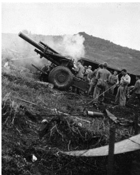
Гаубица одной из батарей морпехов обстреливает скопления сил и огневые позиции японцев. Гуам, июль 1944 года