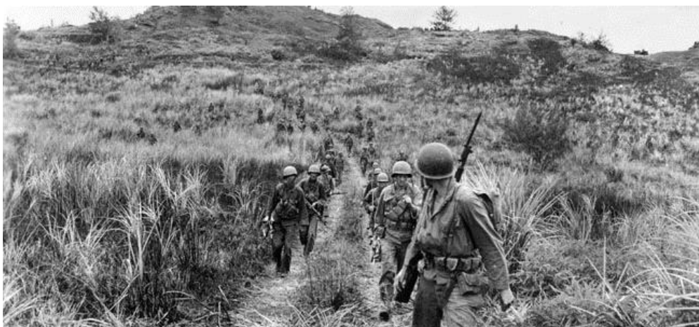
Солдаты Роты В 305-го Полка 77-й Дивизии продвигаются по одной из дорог острова Гуам

Тем не менее было очевидно, что японцы оставляют одну оборонительную позицию за другой и откатываются к горе Санта Роса в северо-восточном углу острова, где собираются сражаться до последнего человека. 5 августа армейская пехота была вынуждена пробиваться через исключительно густые заросли под проливным дождем, поднимаясь вверх по скользким склонам и спускаясь по ним вниз. Впереди продвигались танки и истребители танков, по возможности подавляя снайперские точки. К вечеру этого дня 305-й Полк продвинулся всего на 2 000 ярдов.