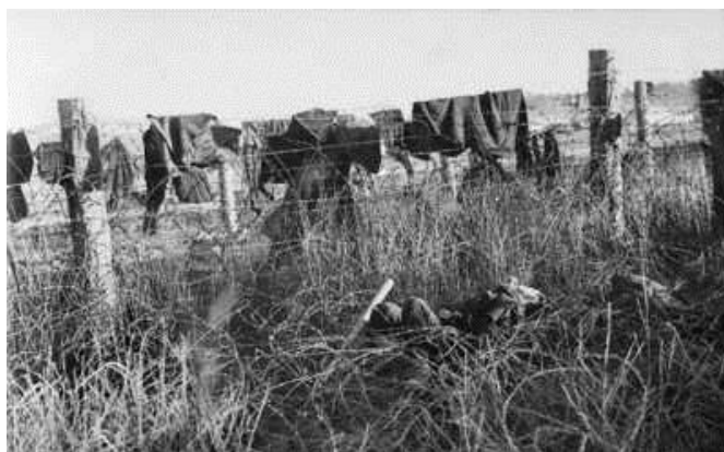
AWM 044172. Наутро после массового побега австралийцы увидели повсеместно валяющиеся трупы японцев вдоль проволочных заграждений, на которых висели шинели и одеяла...