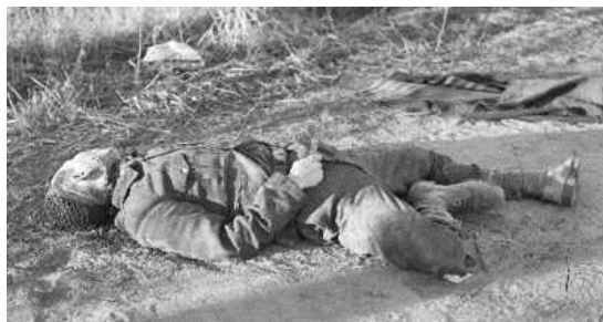
Труп японца, который перезал себе горло во время массового побега...

военнослужащие австралийских ВВС, полицейские, проходившие обучение в тренировочных лагерях солдаты и персонал из Австралийского Женского Батальона, базирующегося в Кауре. Многие бежавшие японцы прибегли к самоубийству, предпочтя смерть возвращению за колючую проволоку. Двое бросились под проходящий поезд, многие повесились. Когда японцев задерживали, они нередко просили, чтобы их застрелили. Другие сдавались мирно. По меньшей мере, двое японцев были застрелены местными жителями и несколько человек – военнослужащими...