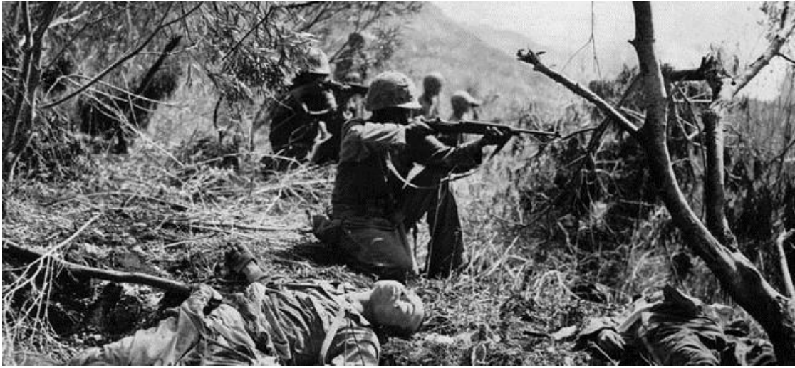
Последние бои в районе пункта Марпи...

Из-за узости острова в его северной части командование американцев уже не могло использовать все три дивизии, и 2-я Дивизия КМП была оставлена в тылу для отдыха и подготовки к вторжению на остров Тиниан.