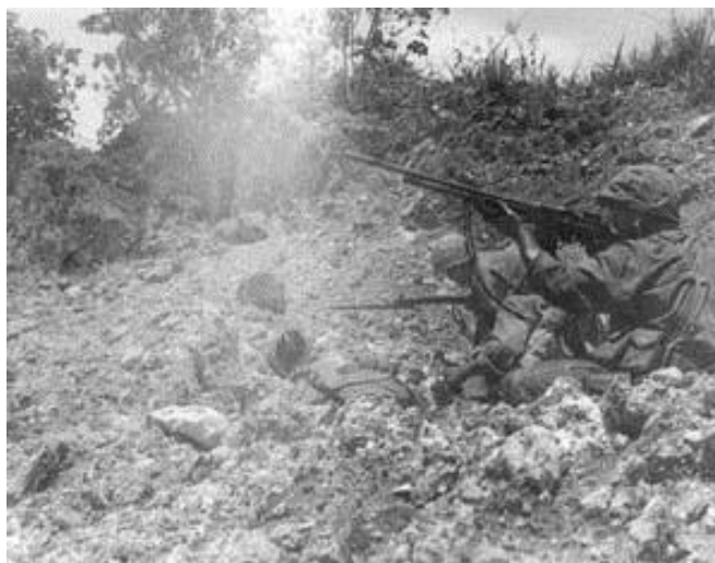
Морпехи в атаке...

Тем временем на участке высадки 6-го Полка три батальона морпехов продвигались вперед. К полудню к линии соприкосновения подошли три японских танка и атаковали фланги 1-го и 2-го батальонов, но вооруженные гранатометами американцы быстро подбили эти машины, и батальоны продолжили наступление на север. Однако приближались сумерки, и морпехи получили приказ окапываться. Известно, что один из рядовых солдат сказал следующее: «Отец говорил мне, что если я не окончу среднюю школу, мне придется рыть канавы!»