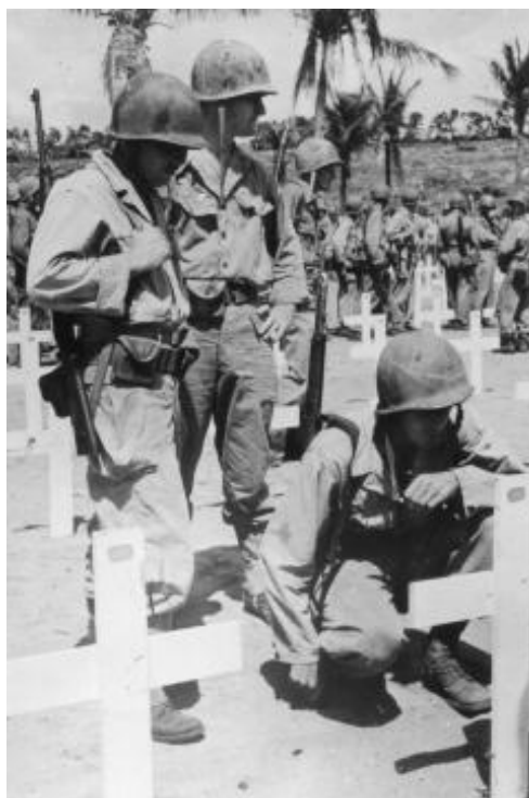
Американцы у могил погибших товарищей. Сайпан