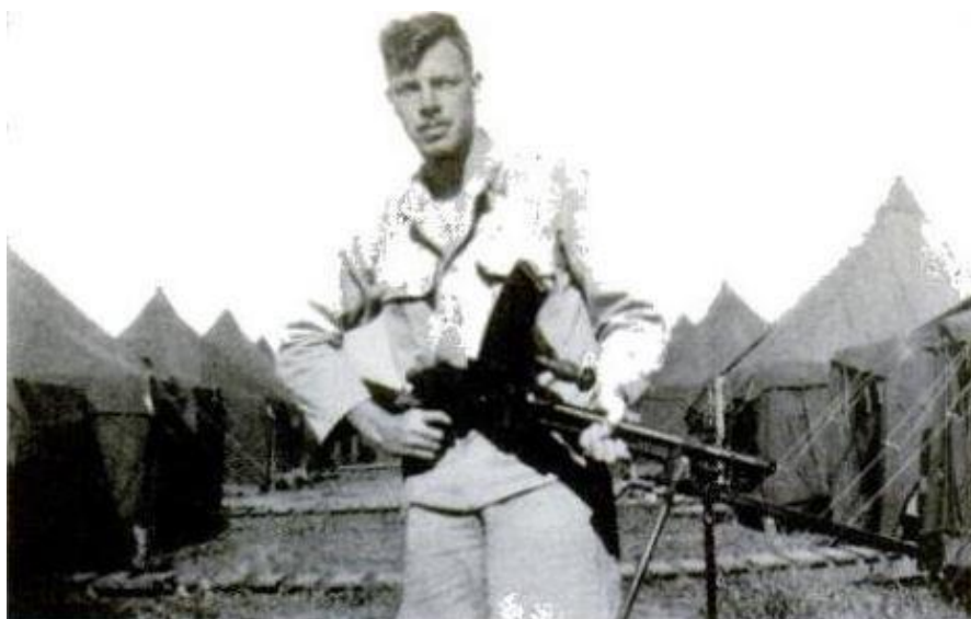
Ли Марвин в период службы в морской пехоте

Одним из молодых морпехов, раненых в сражении за Сайпан, был Ли Марвин (Lee Marvin, 1924-1987), будущая звезда Голливуда. Он высадился на берег в составе Роты / 3-го Батальона 23-го Полка на участке Yellow Beach 2 . «В перестрелке противник хорошо видит две части [твоего] тела, - вспоминал он в интервью журналу Leatherneck годы спустя, - голову и задницу. Если выставишь одну из них, ты – труп. Если приподнимаешь другую, получаешь пулю в ягодицу. В меня попала пуля, прошедшая через бумажник.» Японская пуля повредила Марвину седалищный нерв, после чего он провел в госпиталях более года, пока полностью не оправился от раны. Едва избежавший смерти знаменитый актер в шутку говорил: «Я получил своё Пурпурное Сердце в госпитале на Гуадалканале. На моей заднице навсегда остался шрам, и после этого мне каждый месяц приходится проходить медицинскую проверку.»