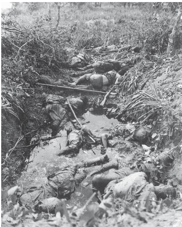
Судьба большинства японцев, оборонявших остров...