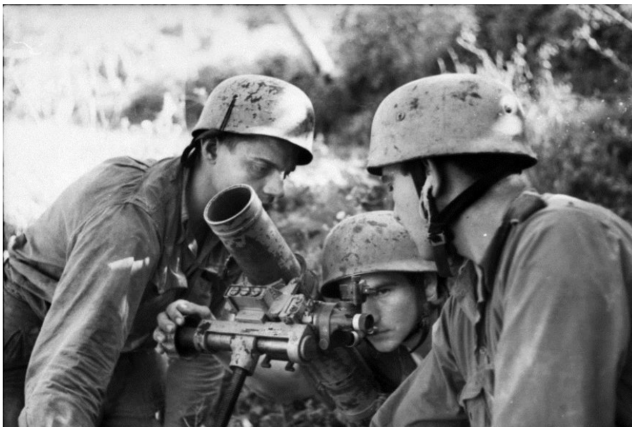
Немецкие минометчики 1-й Парашютной Дивизии генерал-лейтенанта Рихарда Хайдриха, оборонявшие Ортону в декабре 1943

Хотя основные атаки потерпели неудачу, прощупывающие оборону противника атаки батальонов Новой Скотии, Сифортцев и боевых машин Полка Онтарио Танков/ Ontario Tanks достигли определенных результатов. Канадцы выявили уязвимость позиции немцев на участке Casa Berardi , который на тот момент считался ключевым пунктом обороны всей позиции Gully . Воукс приказал батальону 22-го Королевского Полка 3-й Бригады атаковать утром. Канадцы не знали о том, что уставшие солдаты и офицеры понесшей тяжелые потери 90-й ПГД оставляют оборонительные позиции, а им на смену прибывают части 1-й Парашютной Дивизии. Многие из них были опытными бойцами, принимавшими участие в боях на Крите и на острове Сицилия , где, в частности, сражались под городом Катания против британских десантников. Забегая вперед, стоит сказать, что попавшие в плен немецкие парашютисты с презрением отзывались о пехотинцах и говорили, что «после того, как те делают все не так, их посылают исправлять положение.»