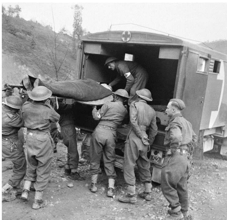
Канадцы эвакуируют одного из раненых товарищей, пострадавшего в ожесточенном бою под Ортоной