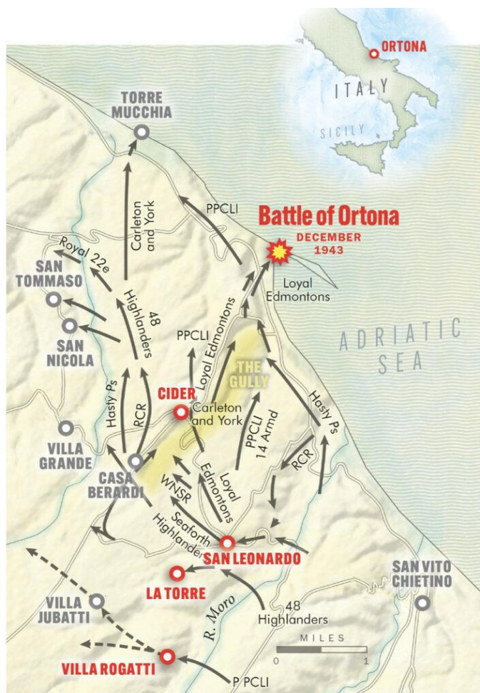
Схематическая карта боевых действий на подступах к Ортоне

После того, как попытки немцев выбить канадцев с плацдарма провалились, командование 90-й ПГД осознало, что их оборонительная линия на левом берегу реки Моро прорвана. В ночь в 9 на 10 декабря немцы отошли на хорошо укрепленные позиции, расположенные примерно в миле от Ортоны напротив дороги Орсонья-Ортона. Здесь немцы располагали врытыми в землю орудиями и блиндажами на левом берегу ручья, врезанного на глубину около 200 футов и впадавшего в Адриатическое море примерно в трех милях от этого участка. Канадцы так и прозвали эту оборонительную позицию The Gully/Ручей . В эту же ночь 3-й Полк немецкой 1-й Парашютной Дивизии генерал-лейтенанта Рихарда Хайдриха (Richard Heidrich) начал продвижение на юг от Адриатической Линии/Adriatic Line , чтобы сменить 90-ю Дивизию. За ним последовали другие части этой дивизии, солдаты и офицеры которой были полны решимости не дать канадцам взять Ортону.