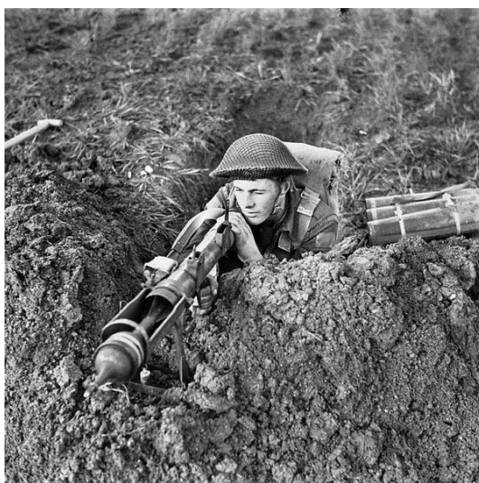
Канадский пехотинец с противотанковым гранатометом ПИАТ/PIAT в стрелковой ячейке под Ортоной