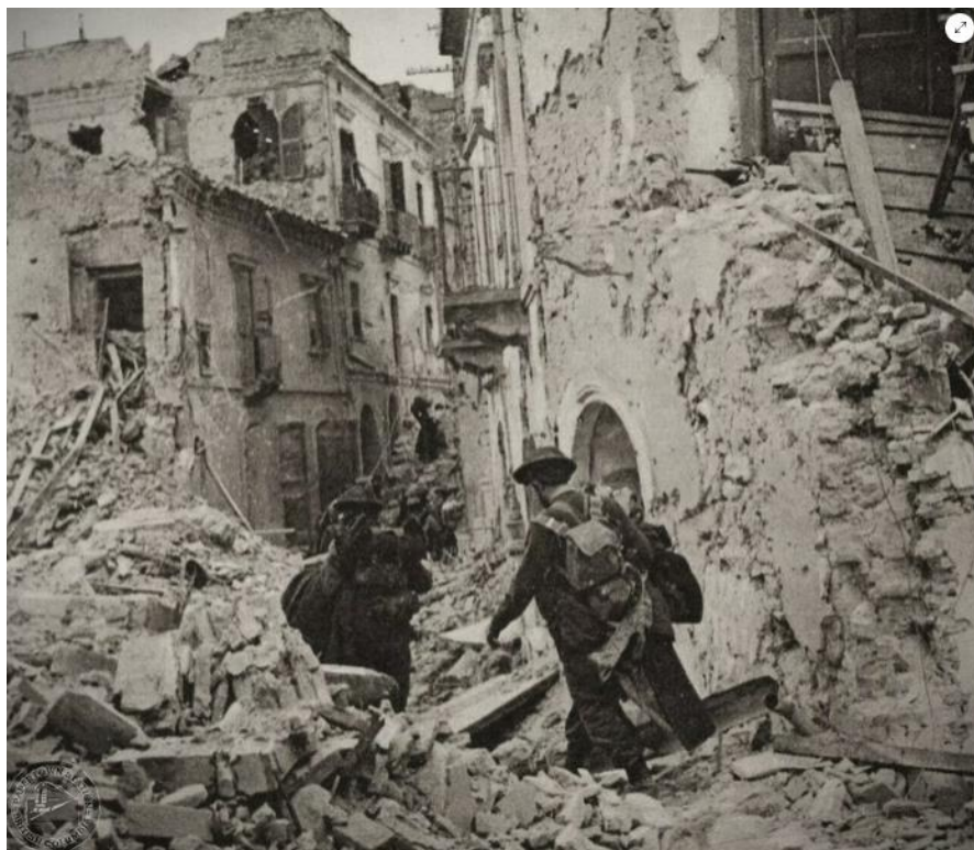
Канадцы продвигаются по улицам Ортоны...

противотанковые пушки особым способом. Снаряды не пробивали гранитные стены, которые иногда достигали 4 футов в толщину. Поэтому мы просто стреляли по окнам, и они начинали скакать внутри так же, как внутри танка, нанося страшный урон.» На поздней стадии боев артиллеристы просто стреляли по углам зданий, обрушая их и хороня под руинами обороняющихся... Допросы пленных подтвердили, что эта тактика была весьма эффективной и имела сильный деморализующий эффект.