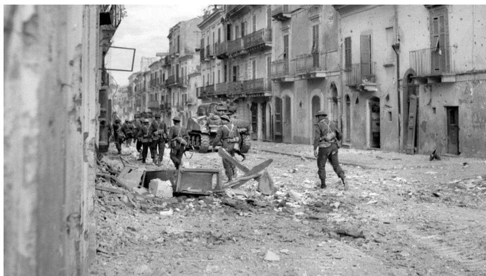
Машины 12-го Танкового Полка в сопровождении Верных Эдмонтонцев вступают в Ортону 22 декабря 1943 года.

позицию немцев и, перебросив через щит пушки осколочную гранату, уничтожил ее расчет. Вслед за этим канадцы начали продвижение к Piazza Municipale от дома к дому. Всем ротам, взводам и отделениям отводились свои цели, была установлена строгая система передачи командирами сообщений о завершении зачистки очередного дома перед тем как переходить к следующему. Опасность ждала канадцев везде и всюду: немцы оставляли в них мины-ловушки или заряды замедленного действия. Фасады некоторых зданий были взорваны, и входившие в них пехотинцы оказывались под огнем из соседних домов. Под огнем были и кучи обломков, перегораживающие улицы.