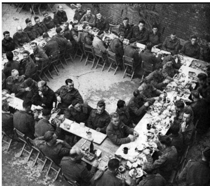
Рождественский ужин. Солдаты получили также небольшие подарки – лезвия для бритв, куски мыла и т.д.

Немецкие парашютисты, тем временем, окружили батальон Горцев и обрушили на них минометный и артиллерийский огонь. Королевские Канадцы получили приказ отказаться от первоначального плана перерезать шоссе и вместо этого пробить коридор к осажденным Горцам . 60 солдат и офицеров Саскатунской Легкой Пехоты/Saskatoon Light Infantry приступили к выполнению боевой задачи с наступлением сумерек. Они вступили в контакт с попавшими в трудное положение Горцами , доставив им необходимые припасы и эвакуировав раненых. Около 10 утра 26 декабря немецкие парашютисты пошли в массированную атаку на позиции окруженных. Горцы отчаянно сопротивлялись, отбив три штурма. Через какое-то время к ним пробились и пришли на помощь три Шермана . Уже вскоре Горцы сами пошли в контратаку, вынудив немцев отступить к деревням Сан Никола и Сан Томассо.