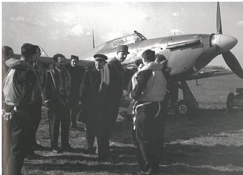
Де Голль с французскими летчиками. 1941-й год

К этому моменту голлистское руководство обнаружило желание создать самостоятельную французскую эскадрилью, а острую нехватку наземного технического персонала компенсировать за счет набора желающих из числа французов, ранее служивших в ВМФ и его авиационных подразделениях. В июне 1941 года в RAF находились 10 летчиков, 93 проходили начальную стадию обучения, 41 – продвинутую стадию обучения, и еще 35 проходили базовую подготовку на различных аэродромах. Однако, формирование эскадрильи было отложено, поскольку RAF в октябре-ноябре 1941 года пришлось передать 270 истребителей Hurricane советским ВВС, и самолетов для французов попросту не хватило.