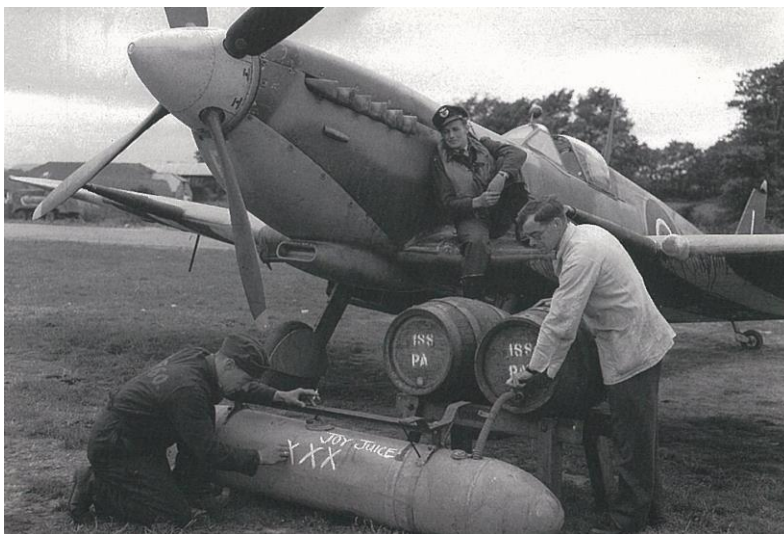
Приятная миссия – в топливные баки заливают пиво для доставки в боевые сухопутные части в Нормандию 1944-й год, 332-я норвежская эскадрилья RAF

В составе норвежских ВВС были сформированы две истребительные эскадрильи – 331-я и 332-я. Первая из них вступила в строй 21 июля 1941 года (вооружена самолетами Hurricane ), вторая – 16 января 1941 года (вооружена самолетами Spitfire ). Обе эскадрильи приняли участие в печально известной операции Jubilee (Дьеппский десант) в августе 1942 года. Летчики проявили недюжинную храбрость, записав на свой счет 10 вражеских самолетов, потеряв при этом 4 своих машины (2 пилота были спасены британскими моряками). Надо отметить, что в этой операции приняли участие также французские, чехословацкие, польские, голландские и бельгийские эскадрильи, проявившие себя с наилучшей стороны.