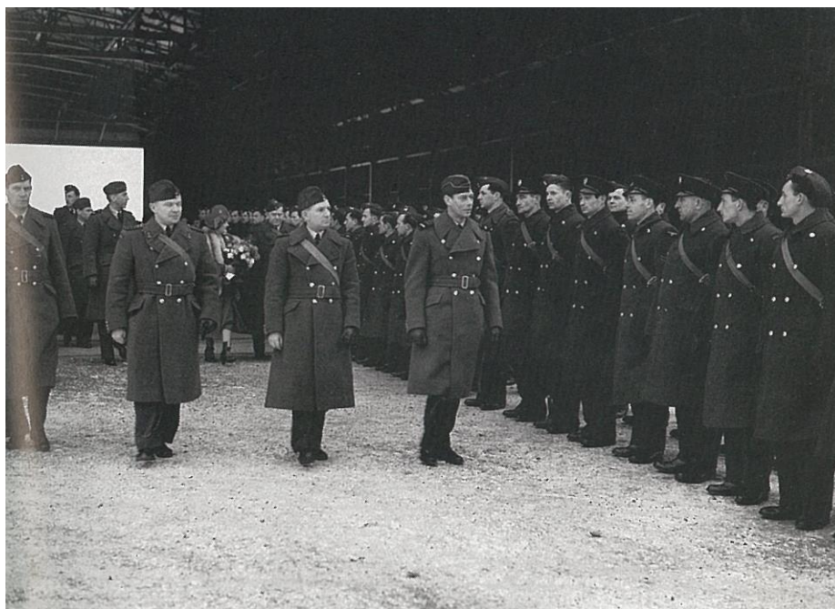
Король Георг VI инспектирует 300-ю и 301-ю эскадрильи польских ВВС, 1940-й год